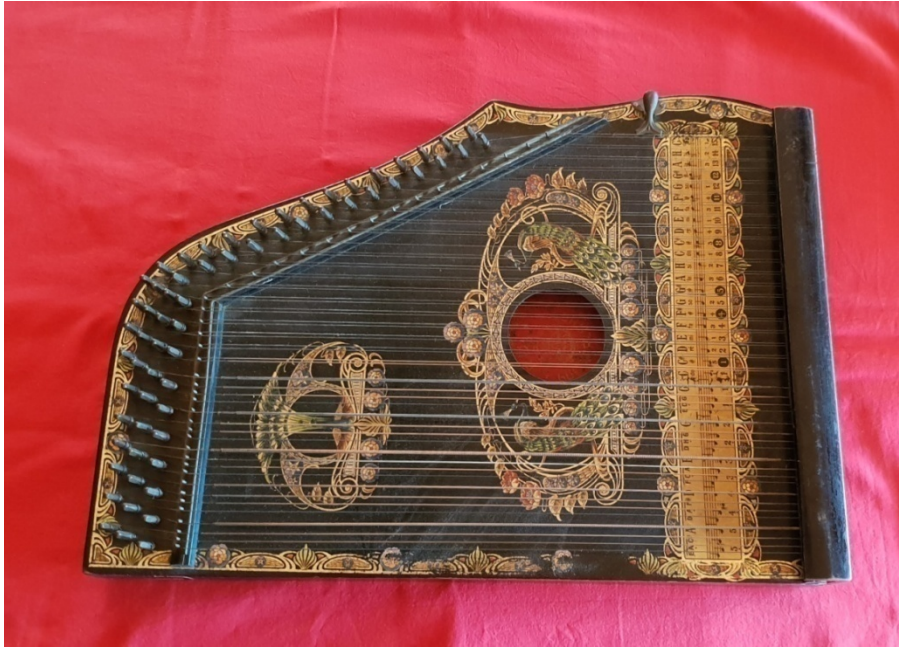
Fotografija 12: Citra