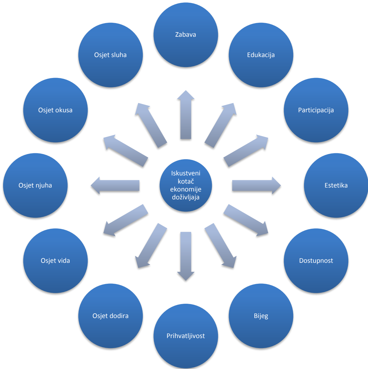
Slika 2. Iskustveni kotač ekonomije doživljaja