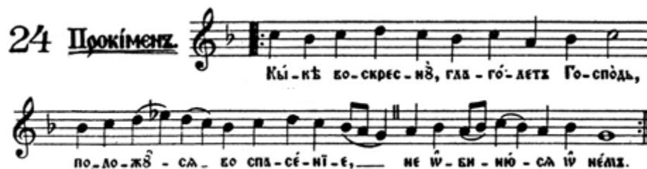
Slika 3. Primjer Prokimenena prema Stevanu Mokranjcu 22 pisanog za I. glas

c) Pričastan – ovaj se stih poje prilikom svećenikove pričesti na liturgiji.