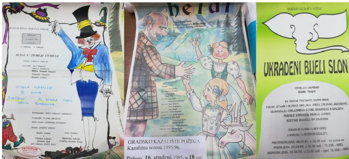
Slika 13. Plakati kazališnih predstava tijekom 1994. i 1995.