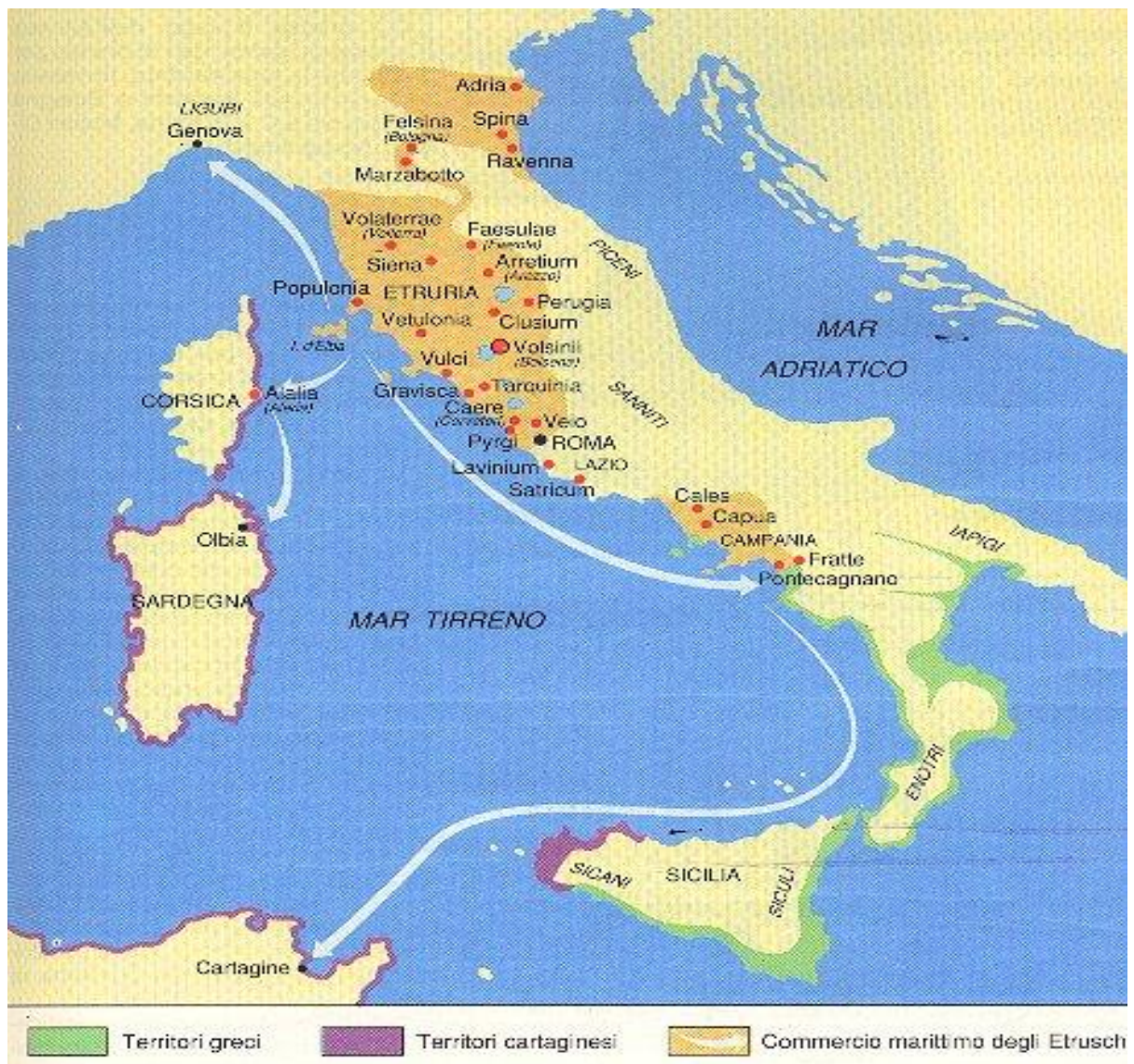
Slika 1. Karta etrušćanskih gradova (preuzeto 25.11.2018)

Na sjevernom dijelu Italije, područje današnje pokrajine Emilia-Romagna spada pod treću zonu koju su naseljavali Etrušćani. Kako je veliki dio poluotoka bio močvarno područje, to se tlo koristilo za proizvodnju poljoprivrednih proizvoda, jer je bilo bogato plodnim tlom i nalazilo se uz Padsku nizinu. Kasnije tamo nastaju dva najvažnija etrušćanska trgovišta, a to su Spina i Adria o kojima će kasnije biti više rečeno.