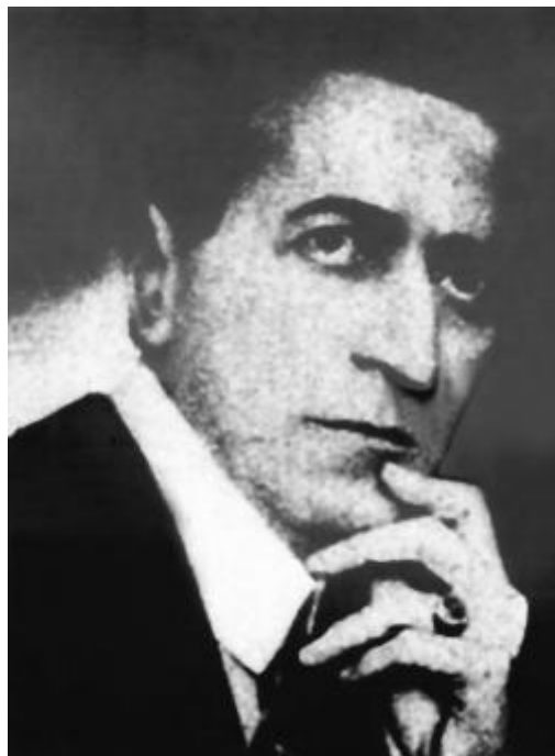
Slika 5. Đuro Stipetić