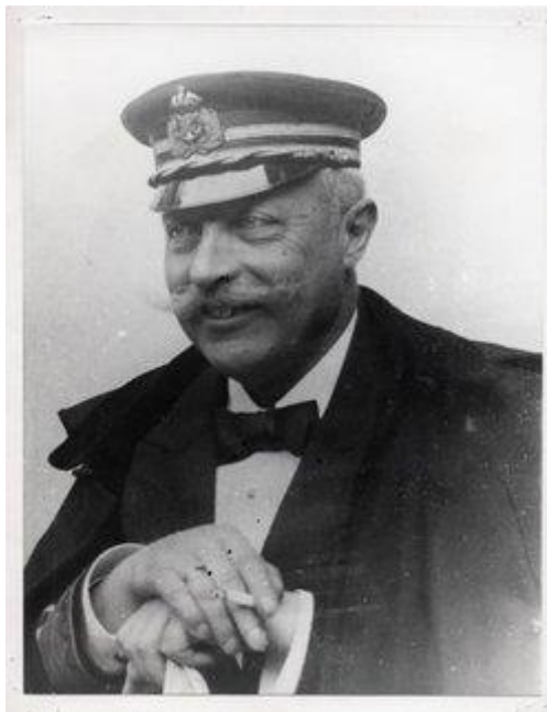
Slika 3. Maximilian Eichhain von Daublebsky