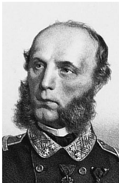
Slika 2. Wilhelm von Tegetthof

Austrijski admiral Wilhelm von Tegetthoff rođen je 1827. u Marburgu 8 u Štajerskoj u Austriji. Jedan je od najistaknutijih pomorskih zapovjednika 19. stoljeća. Autoritativnim i odlučnim stavom provodio je potpunu reformu u austro – ugarskoj mornarici. Poznat je po svojoj inovativnoj taktici, diplomatskoj i organizacijskoj sposobnosti te inspirativnom vodstvu. Intenzivno je zagovarao prelazak ratne mornarice na parni pogon. Viceadmiral Tegetthof (Slika 2.) stajao je iza projekta osnivanja Mornaričkog kasina (centra društvenog okupljanja vojne elite, visokih časnika i plemstva) kao predsjednik kluba, a zalagao se i za osnivanje Hidrografskog zavoda. Preminuo je iznenada od upale pluća 1871., u dobi od 43 godine.