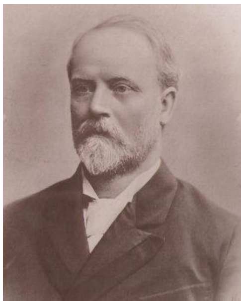
Slika 6. Paul Kupelwieser

Izuzetno uspješan poslovni čovjek i rudarski stručnjak Paul Kupelwieser, rođen u Beču 1843., poznat je po tome što je uredio i obnovio zapušteno Brijunsko otočje. Uredio je pristanište, izgradio pet hotela i bazene s grijanom morskom vodom te na taj način privukao otmjenu klijentelu i najuglednija imena Austro – Ugarske i Njemačke. Kupelwieser (Slika 6.). je 1894. pozvao šumarskog stručnjaka Alojza Čufara za pomoć u borbi protiv malarije, a nakon njegove smrti i poznatog njemačkog bakteriologa Roberta Kocha. Njegovom zaslugom malarija je napokon iskorijenjena 1900. i 1901.