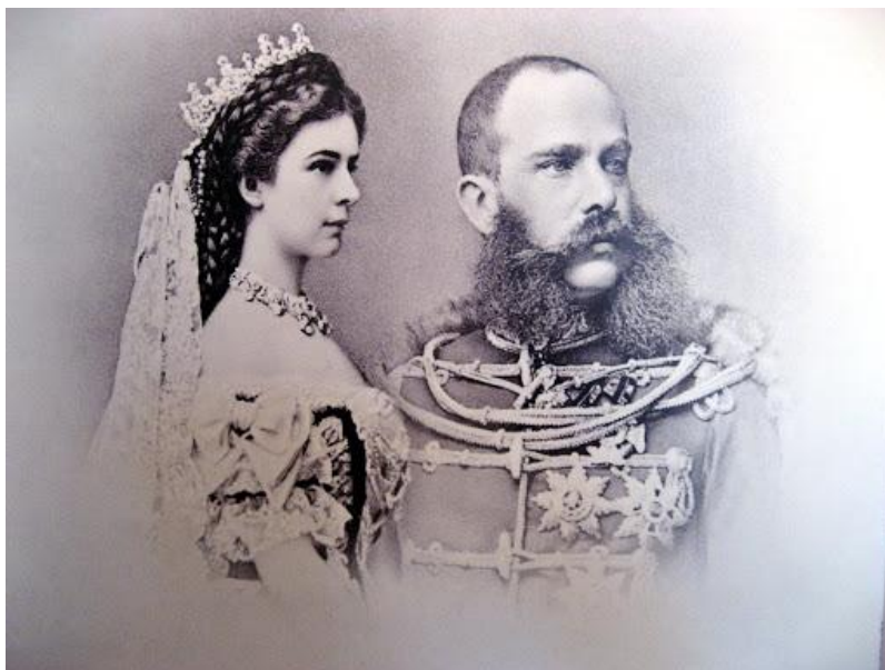
Slika 1. Elizabeta Amaia Eugenia i Franjo Josip I.