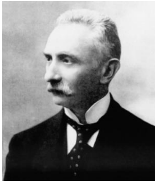
Slika 10. Lodovico Rizzi