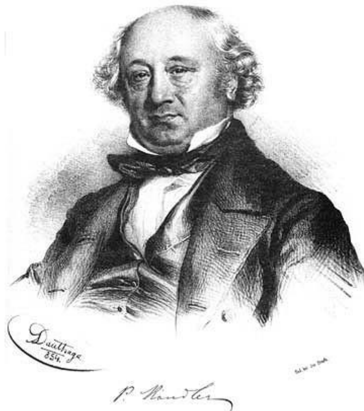
Slika 9. Pietro Kandler