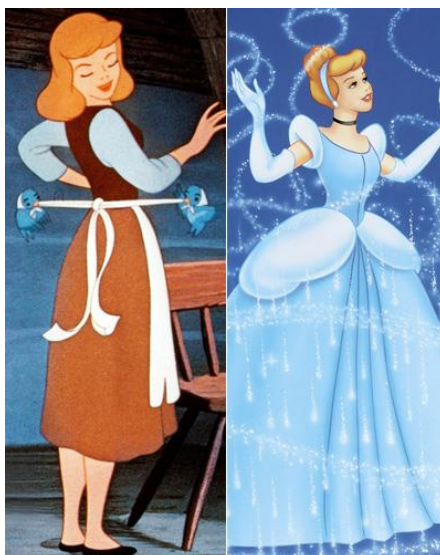
Slika 2. Pepeljuga