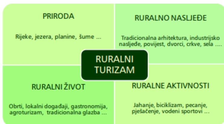
Slika 1: Koncept ruralnog turizma

Prema Svjetskoj turističkoj organizaciji, ruralni turizam temelji se na prirodnim resursima, ruralnom nasljeđu, ruralnom načinu života i ruralnim aktivnostima, odnosno, aktivnostima u ruralnom prostoru: