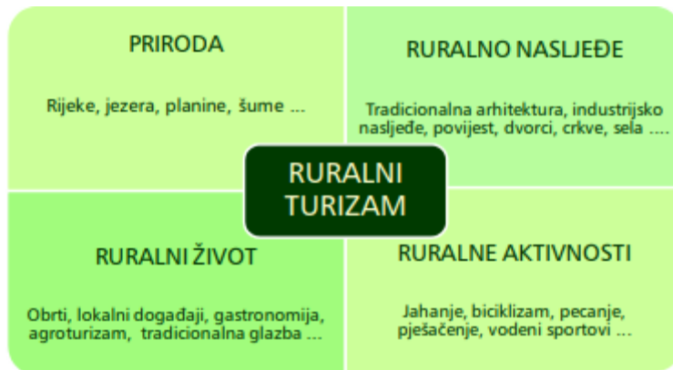
Slika 1: Koncept ruralnog turizma

Prema Svjetskoj turističkoj organizaciji, ruralni turizam temelji se na prirodnim resursima, ruralnom nasljeđu, ruralnom načinu života i ruralnim aktivnostima, odnosno, aktivnostima u ruralnom prostoru: