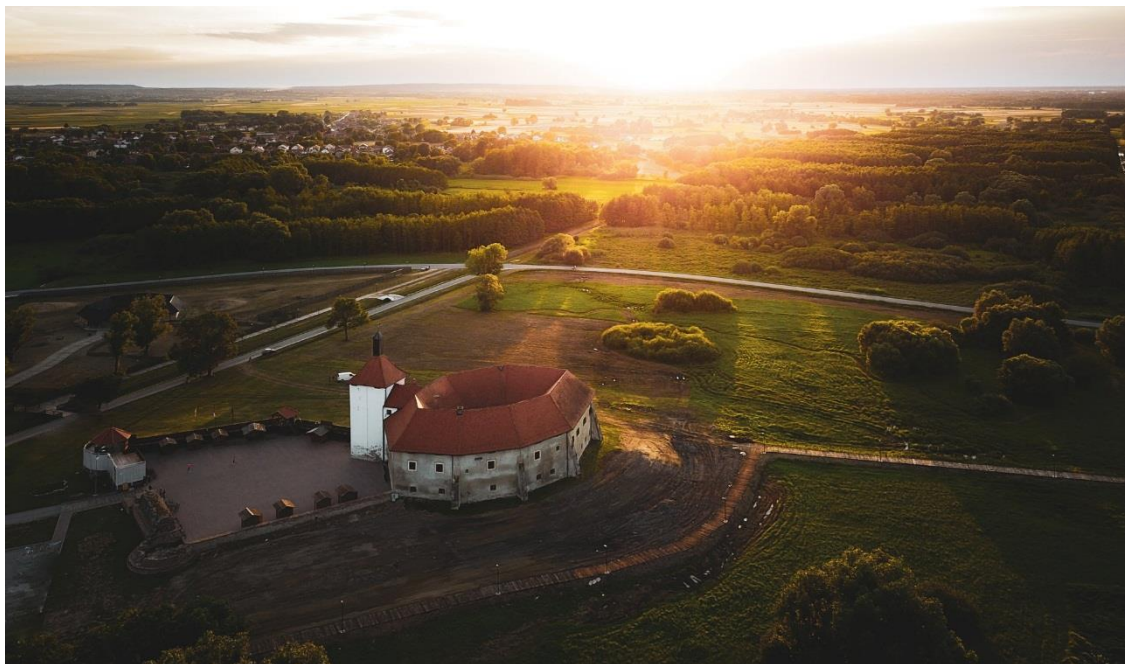
Slika 6: Utvrda Stari grad Đurđevac