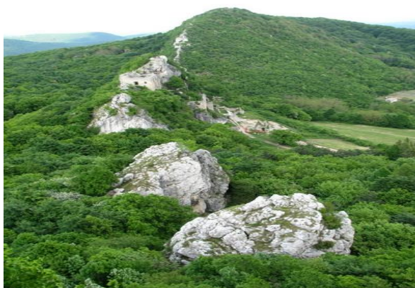
Slika 15: Staza Sedam zubi