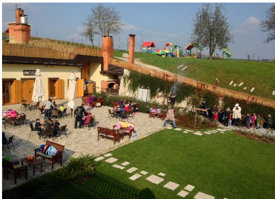
Slika 14: Podrum Vinarije