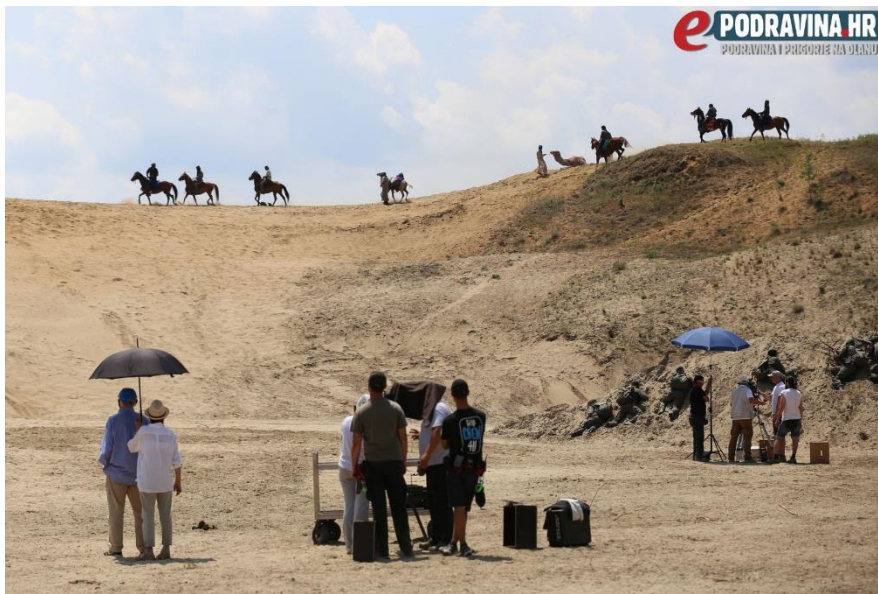
Slika 5: Snimanje filma u Đurđevačkim pijescima