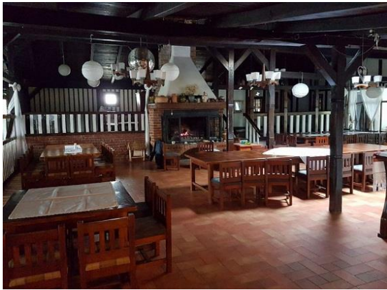
Slika 11: Restoran „Zlatni Klas“ Otrovanec Slika 12: „Zlatni Klas“ Otrovanec (dvorište)