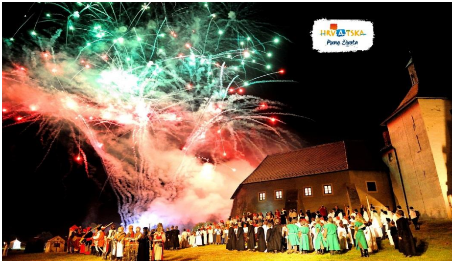
Slika 7: Prikaz „Legende o Picokima“