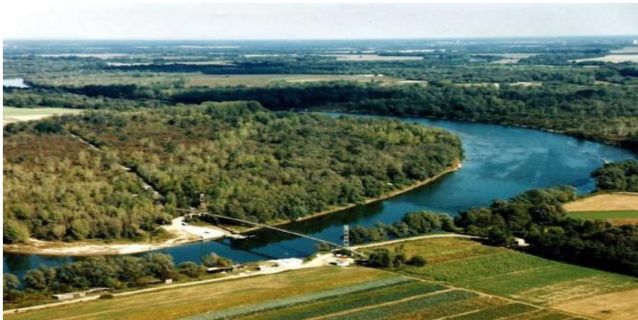
Slika 8: Križnica