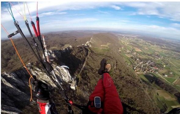
Slika 16: Padobransko jedrenje