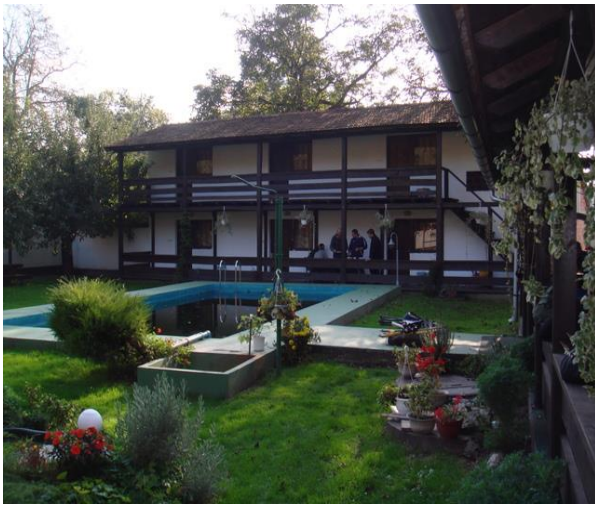
Slika 10: Smještaj u „Dravskoj kleti“