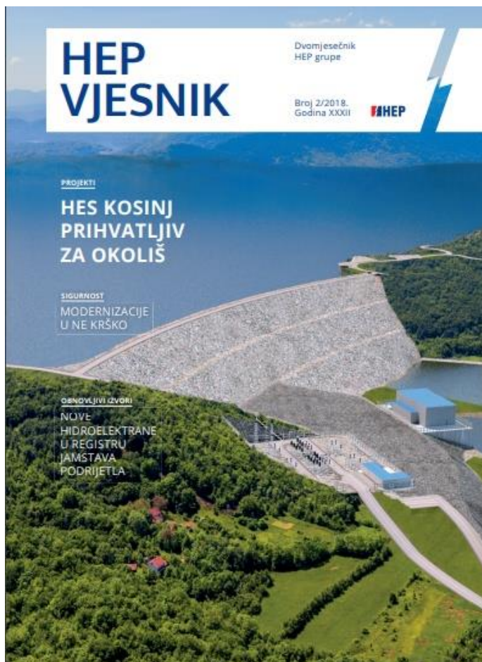
Slika 5. Naslovna strana HEP Vjesnika 2/2018