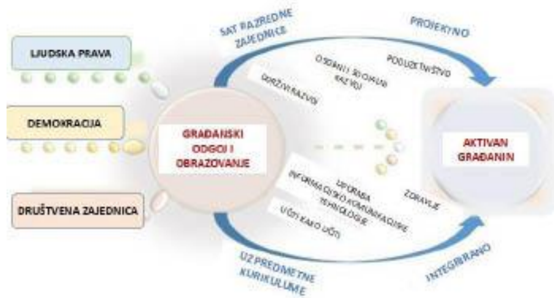
Slika 1. Shematski prikaz međupredmetne teme Građanski odgoj i obrazovanje 9

svoje konceptualno i teorijsko utemeljenje u sustavu odgoja i obrazovanja. Zbog velikih promjena koje se događaju u području odgojno-obrazovne politike Republike Hrvatske gotovo je nemoguće predvidjeti ishod ovog dugogodišnjeg procesa (Pažur, 2017). Na temelju članka 27. stavka 9. Zakona o odgoju i obrazovanju u osnovnoj i srednjoj školi (NN, 87/08, 86/09, 92/10, 105/10 – ispravak, 90/11, 16/12, 86/12, 94/13, 152/14, 7/17 i 68/18) ministrica znanosti i obrazovanja Blaženka Divjak donosi odluku o donošenju kurikuluma za međupredmetnu temu Građanski odgoj i obrazovanje za osnovne i srednje škole u Republici Hrvatskoj koja je na snagu stupila 25. siječnja 2019. godine.