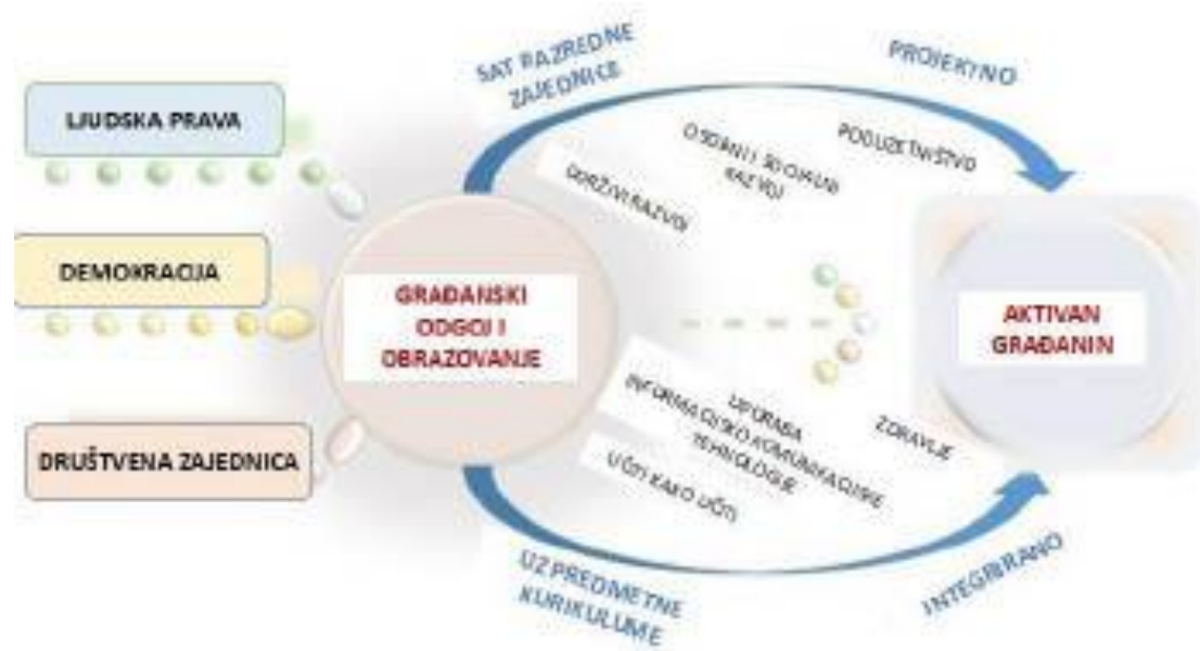
Slika 1. Shematski prikaz međupredmetne teme Građanski odgoj i obrazovanje 9

svoje konceptualno i teorijsko utemeljenje u sustavu odgoja i obrazovanja. Zbog velikih promjena koje se događaju u području odgojno-obrazovne politike Republike Hrvatske gotovo je nemoguće predvidjeti ishod ovog dugogodišnjeg procesa (Pažur, 2017). Na temelju članka 27. stavka 9. Zakona o odgoju i obrazovanju u osnovnoj i srednjoj školi (NN, 87/08, 86/09, 92/10, 105/10 – ispravak, 90/11, 16/12, 86/12, 94/13, 152/14, 7/17 i 68/18) ministrica znanosti i obrazovanja Blaženka Divjak donosi odluku o donošenju kurikuluma za međupredmetnu temu Građanski odgoj i obrazovanje za osnovne i srednje škole u Republici Hrvatskoj koja je na snagu stupila 25. siječnja 2019. godine.