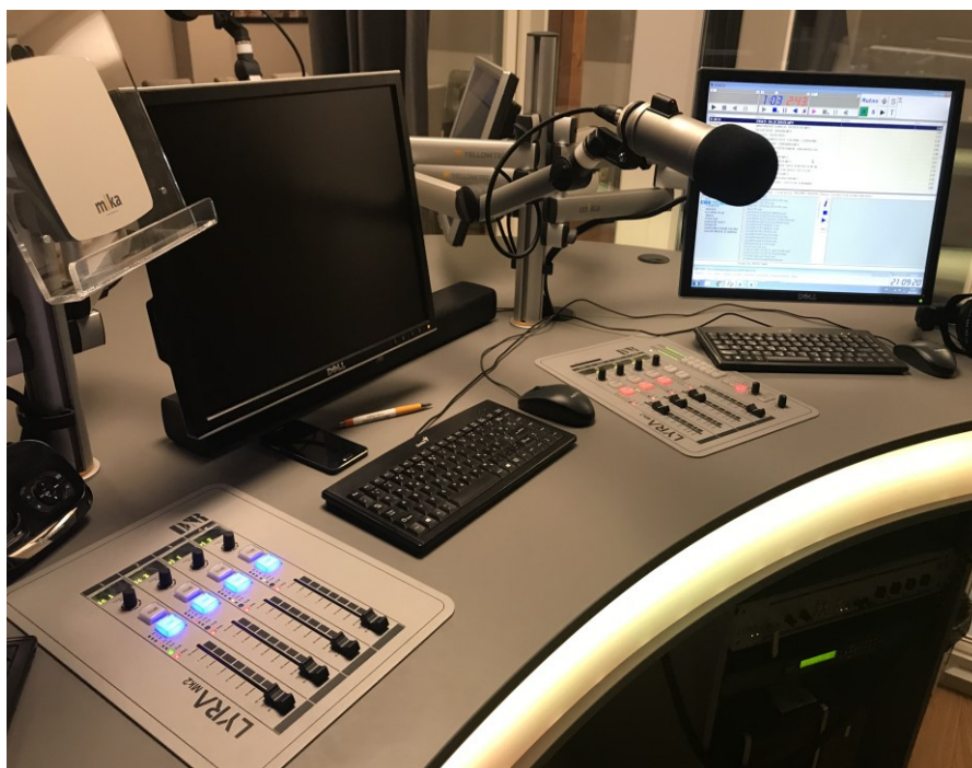
SLIKA 6. IZGLLED NOVE MIKSETE