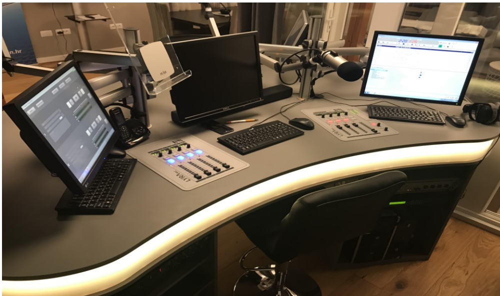
SLIKA 5. INTERIJER NOVOG STUDIJA