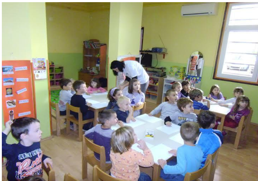
Slika 12. Djeca crtaju prizore koje su zapamtili iz priče „Ježeva kućica“

Nakon toga smo rasporedile djecu po stolovima te im podijelile olovke u boji i bijele papire. Potom smo im pokazivale slike stvarnih životinja pa su ih oni imenovali i tako smo još jednom utvrdili koji se sve likovi spominju u priči. Dale smo im izbor da naslikaju ono što ih se najviše dojmilo u pjesmici. Neka djeca su naslikala sve likove koji se spominju, neka su naslikala samo ježa ili samo liju, a neka su crtali i ježevu i lijinu kuću. Svaki je rad na kraju bio lijep i poseban. Dogovorili smo se koje ćemo lutke izrađivati drugi dan i od kojih materijala. Kako je većina djece još jako mala, ne mogu se sami služiti škalicama, njihove su odgojiteljice predložile da im mi izrežemo oblike od spuže, za sutradan.