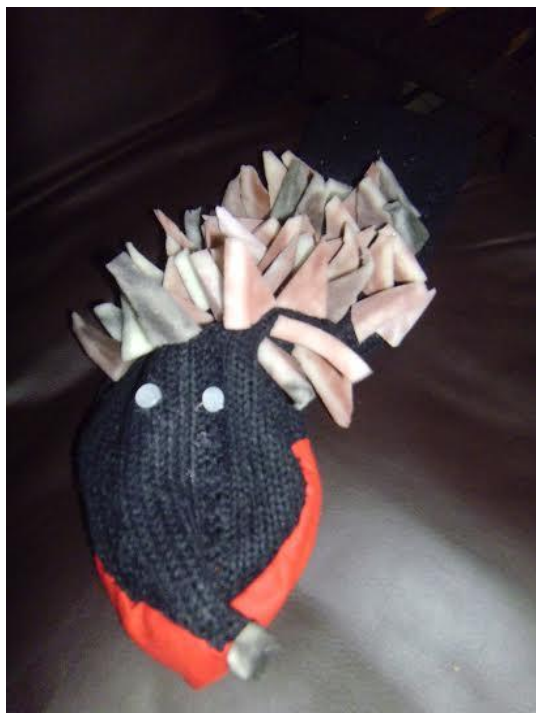
Slika 25. „Ježurka ježić“ - lutka zijevalica. Pri izradi ove lutke korišteni su ostaci starih majica, crvena tanka tkanina i dijelovi spužve. Te su djelove prethodno djeca rezala škarama u oblike trokuta, što je predstavljalo ježeve bodlje i obojila kredama u boji. Nakon bojanja spužve te su djelove aplicirali na lutkin trup.