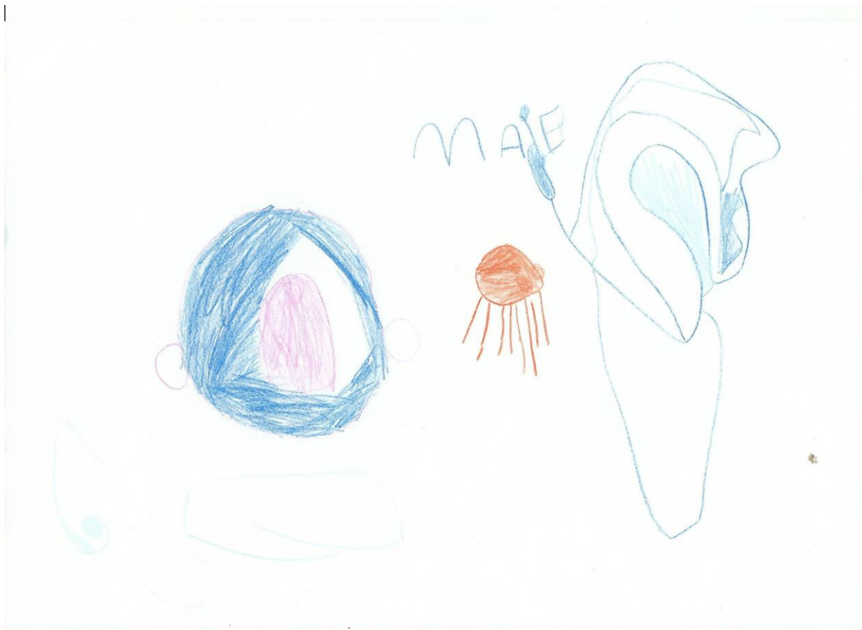
Slika 33. M. L. 4, 5 god., „ Jež, brlog i kućica“ – u ovom radu vidimo da nedostaju osnovni detalji što bi moglo ukazivati na lošu prilagodbu. Vidimo dosta jak pritisak olovke u boji na papir što može značiti da je dijete napeto. Koristi nekoliko nijansi plave boje te stavlja rad u središte papira što može značiti da je dijete sigurno u sebe. Tehnika: olovke u boji.