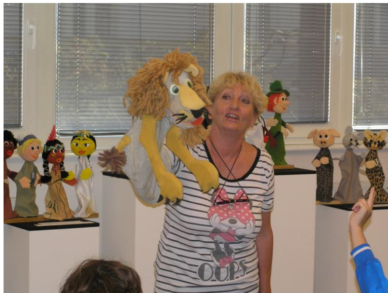
Slika 11. „Igra odgojitelja s lutkom

Odgojitelji bi kao prvo trebali pokazati poseban interes prema lutkarstvu i prema scenskoj lutki. Moraju biti spremni svoja znanja o razvoju djece i metodici rada s djecom predškolskog uzrasta integrirati sa znanjima iz umjetničkih područja te ih primijeniti u planiranju i provođenju programa u dječjem vrtiću. Također svaki odgojitelj mora biti spreman na obrazovanje i usavršavanje tokom cijelog života, no kako se misli na stručno usavršavanje tako se misli i na učenje od djece koja nam često znaju otvoriti oči, uputiti nas i često ostaviti bez daha svojim originalnim pitanjima. Odgojitelj bi mogao pristupiti djetetu kroz igru scenskom lutkom, on mora također biti zaigran i biti dijete u duši. U dječjoj mašti svaki predmet može oživjeti. Bilo kakav predmet ili igračka preuzima ulogu svijeta mašte, a dijete diktira pravila igre. Lutka može biti povjerljiv posrednik između djeteta i njegove okoline. Poznato je kako je jedan od najvažnijih koraka u djetetovom napredovanju otkrivanje načina komunikacije. Najbliži način je kroz osjećaje, međutim ponekad oni znaju za dijete biti stresni i opasni. Kako bi se takve stresne situacije izbjegle često se zbog bolje dvosmjerne komunikacije između djeteta i njegovog sugovornika uvodi lutka (Kroflin, Majaron, 2004).