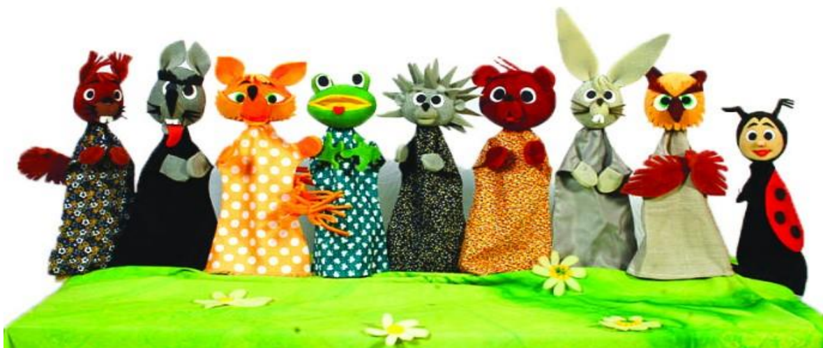
Slika 1. „Scenske lutke“

Za pisanje završnog rada, uzela sam temu „Lutka iz dječjeg kutka“ iz kolegija Lutkarstvo i scenska kultura. Na odabir ove teme potaknulo me više čimbenika. Prvi čimbenik koji me potaknuo na odabir ove teme je sama lutka, zato što je lutka nešto što nas najviše vuče nazad u djetinjstvo i u dane kad smo sanjali da smo likovi iz priča. Lutka je po mom mišljenju najljepša igračka u djetinjstvu svakog čovjeka. Drugi čimbenik zbog kojega sam izabrala upravo tu temu za pisanje je taj što smo na drugoj godini studija, iz istog kolegija imali zadatak napraviti lutkarsku predstavu od početka do kraja. To je bio period koji je mojim kolegicama i meni pomogao da se opustimo, da opet uključimo maštu i da se vratimo u djetinjstvo. Lutkarstvo je područje kreativnog izričaja djeteta i kroz tu umjetnost djeca se sama izražavaju i tako stvaraju. Zanimljivo ih je pratiti kroz cijeli taj pristup lutki i scenskoj umjetnosti. Lutkarstvo može pomoći djeci predškolske dobi u prepoznavanju vlastitih emocija, može im pomoći u izražavanju emocionalnih stanja u odnosu na druge, učenju ekspresivnih tehnika koje omogućuju izražavanje emocionalnih stanja kao što su ljutnja, strah i tuga, kroz likovne tehnike, pjesmu i ples, igre uloga te razvijanjem vlastite kreativnosti.