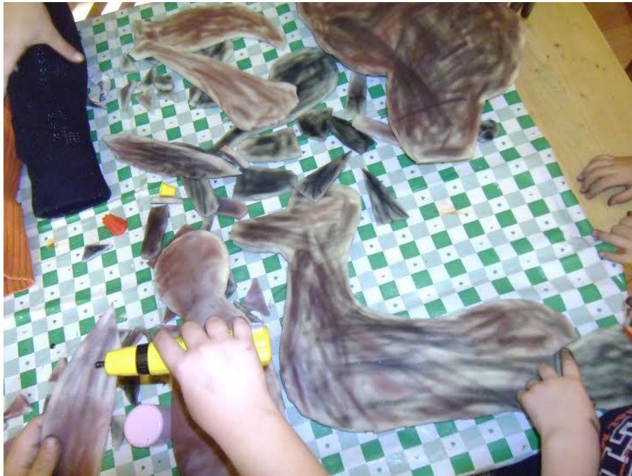
Slika 20. Apliciranje manjih dijelova spužve (šape, rep i uši) na veće dijelove (trup)spužve