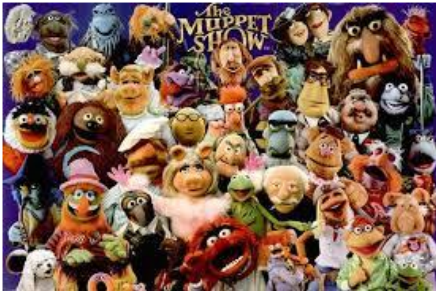
Slika 5. „The Muppet Show“

Zijevalica je ručna lutka i njezina je posebnost to što prsti animatorove ruke, otvaraju i zatvaraju lutkina usta. Zijevalicu odlikuju različite karakterne osobine, pa s njom možemo prikazati različite likove. Lutke zijevalice su idealne kada želimo njima ispričati neku priču, maskirati se u životinju iz neke basne, glumiti neku životinju itd. Lutke zijevalice mogu biti vrlo jednostavne, pa tako na primjer možemo na ruku navući običnu čarapu i na nju prišiti gumbiće koji će prikazivati oči i neku tkaninu koja će prikazivati usta. Isto tako lutke zijevalice mogu biti vrlo složene i namijenjene za televizijsku produkciju poput popularnih lutaka iz „The Muppet Showa“.