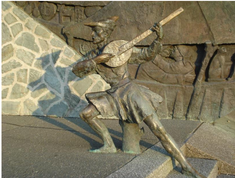
Slika 2. Petrica Kerempuh