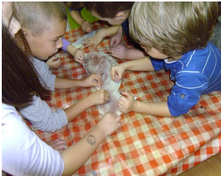
Slika 14. Bojanje spužve suhim pastelama

Aktivnost je protekla u odličnom raspoloženju, svi su bili jako angažirani, nitko nije odustao prije vremena. Začudilo nas je da su likovno jako aktivni jer su zadatak ozbiljno shvatili, iako im nismo ukazivale na to da površina treba biti sva obojana, oni su se trudili da cijela bude ispunjena. Na to su nam njihove odgojiteljice objasnile da svaki dan imaju neku likovnu aktivnost, te da petkom imaju likovnu radionicu.