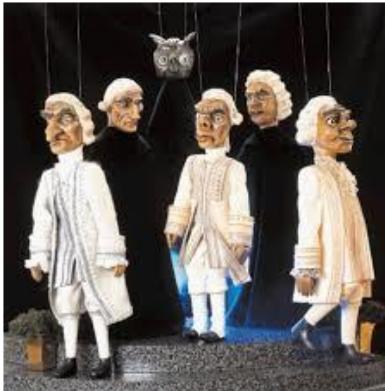
Slika 10. „ Marioneta“

Marioneta s više konaca - Ova vrsta lutke zadržala je omjere čovjeka. Sastoji se od glave, trupa, ruku i nogu te ima pokretljive zglobove. Ove marionete iziskuju veliku vještinu animatora (Vukonić-Žunić, Delaš, 2006.).