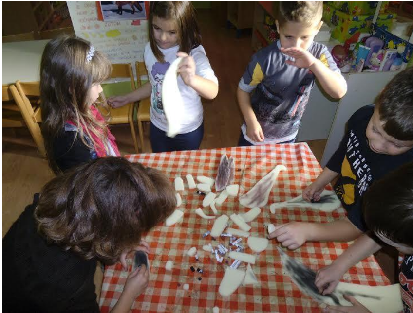
Slika 13. Djeca režu komadiće spužve te ih boje suhim pastelama