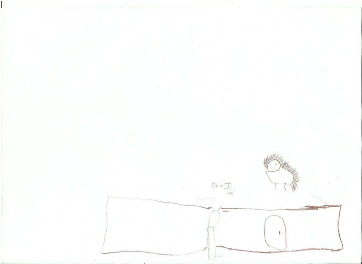
Slika 31. D.G. 4,7 god., „ Ježurka Ježić i Lija razgovaraju ispred ježeve kućice“ – u ovom radu vidimo lagane poteze olovkom, linije su veoma tanke i diskretne što može ukazivati na djetetovu nesigurnost. Rad je smješten u desni kut papira što nam ukazuje da je dijete povučeno. Tehnika: olovke u boji.