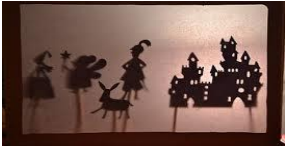
Slika 7. „Lutke sjena“