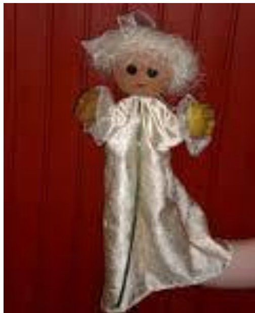
Slika 4. Ginjol lutka

Ginjol je ručna lutka i sam naziv te lutke nam otkriva da se navlači na ruku poput rukavice. Razlikujemo dvije vrste ručnih lutaka, a to su ginjol lutka i lutka zijevalica. Razlika između te dvije lutke je ta, što je ginjol tip lutke koji se navlači na ruku poput rukavice i najčešće kažiprstom pomičemo lutki glavu, a malim prstom i palcem pokrećemo lutkine ruke. Lutka zijevalica se također navlači na ruku, no razlika je u tome što je za nju karakteristično to da otvara i zatvara usta pomoću animatorove ruke.