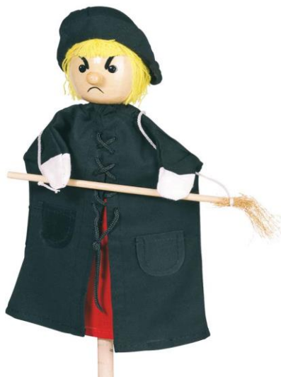
Slika 8. „Javajka“

Naziv joj dolazi od imena otoka Jave, jer je nastala po uzoru na tradicionalni indonezijski wayang golek . Obično je izrađena od drveta, a jedan štap prolazi kroz njeno tijelo. Taj štap povezan je s glavom gore, a na donjem dijelu drži ga animator, te njime okreće glavu. Ginjol-lutka ima dugačke pokretne ruke sa zglobovima. Javajke su izduženije forme od ginjol-lutke, ali im je košuljica također od platna. U slučaju da javajka treba imati i noge, onda se noge mogu animirati lijevom rukom. Javajke životinje su mnogo kompliciranije i za svaku se posebno smišlja mehanizam, ali zajedničko svim javajkama je da imaju jedan osnovni štap kojim su vođene odozdo.