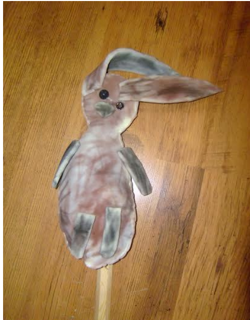
Slika 23. „Zec“ - štapna lutka, izrađena je od spužve, korištena je tehnika bojanja kredama u boji. Najprije su djeca bojala manje dijelove spužve koje smo im prethodno izrezali, u međuvremenu je jedna skupina bojala veće dijelove spužve. Nakon toga spajali su manje i veće dijelove spužve, odnosno aplicirali su oči, nos, usta, šape kako bi lutka dobila svoj oblik i potom su lutke punjene novinskim papirom. Vidimo da je obojana cijela površina spužve, koristili su smeđu, sivu i crnu boju.