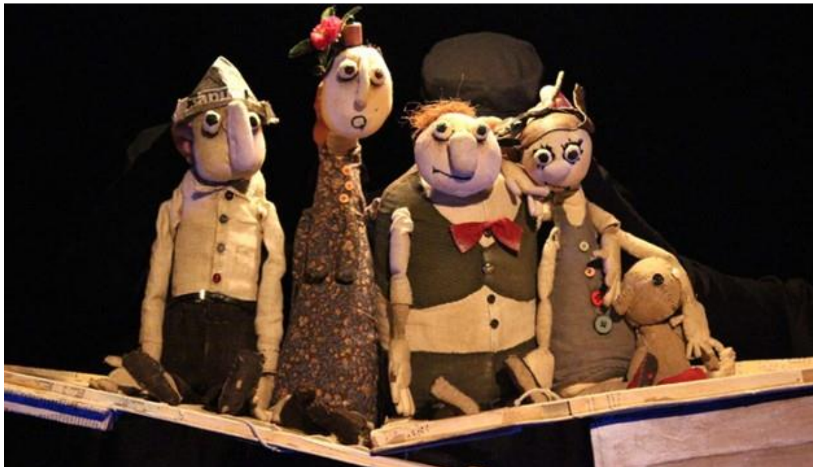
Slika 3. Lutkarska predstava

U Jugoslaviji lutkarsko kazalište gotovo da i nije imalo tradicije, tek nakon Drugoga svjetskog rata počinju pokušaji ozbiljnijih umjetničkih pretenzija. U našim je krajevima prva predstava održana u Ljubljani 1913. godine, a priredio ju je slikar Josip Klemenčić.