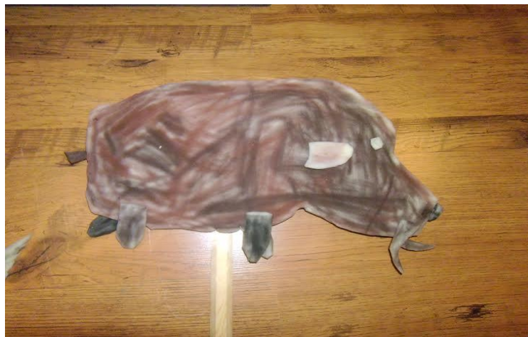
Slika 24. „Divlja svinja“ - štapna lutka, izrađena je istom metodom i tehnikom kao i lutka „Zec“.