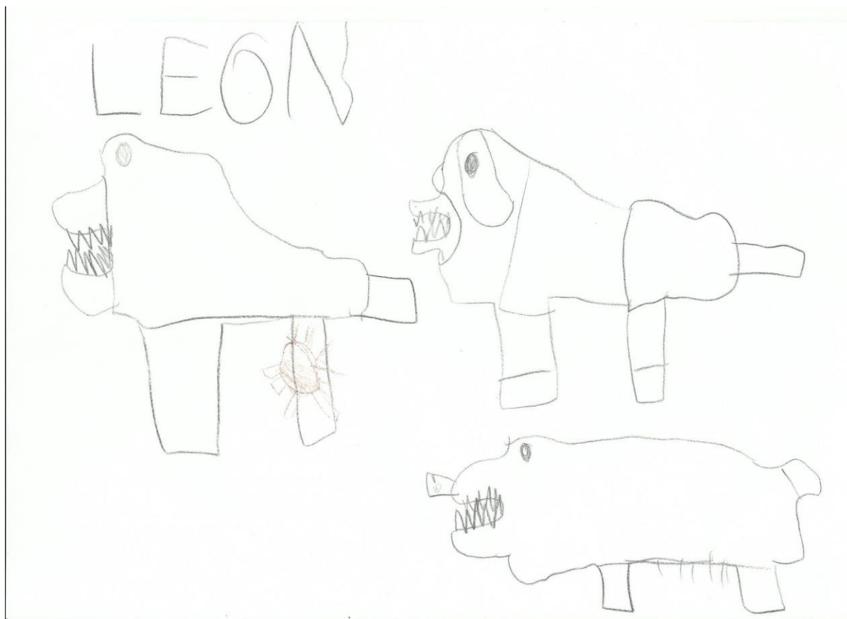
Slika 32. L. A. 5, 5 god., „Divlja svinja“ – u ovom radu vidimo da su linije čiste i potezi su čvrsti, dijete je tri puta nacrtalo lik divlje svinje, na što možda možemo zaključiti da se boji da će pogriješiti. Prikazana je istaknutost zubi što često može ukazivati na agresivnost. Također, vidimo ježa koji je nacrtan u drugoj boji i to veoma laganim linijama. Tehnika: olovke u boji.