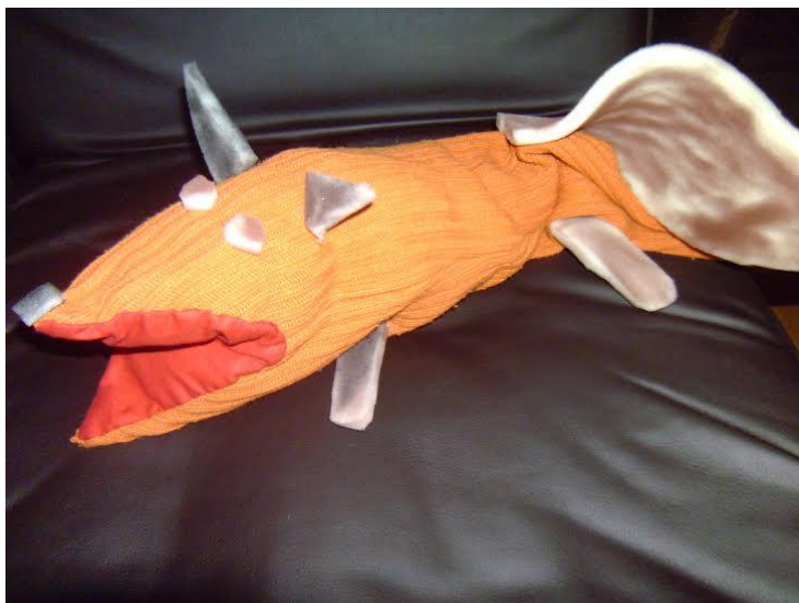
Slika 27. „Lisica“ - lutka zijevalica