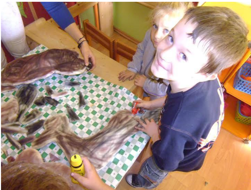
Slika 21. Apliciranje manjih dijelova spužve (šape, rep i uši) na veće dijelove (trup)spužve