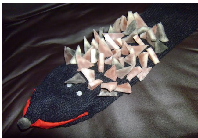
Slika 26. „Ježurka ježić“ - lutka zijevalica