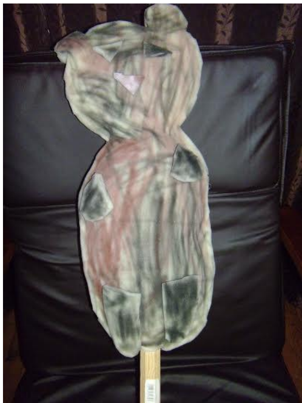
Slika 29. „Medo“ - štapna lutka