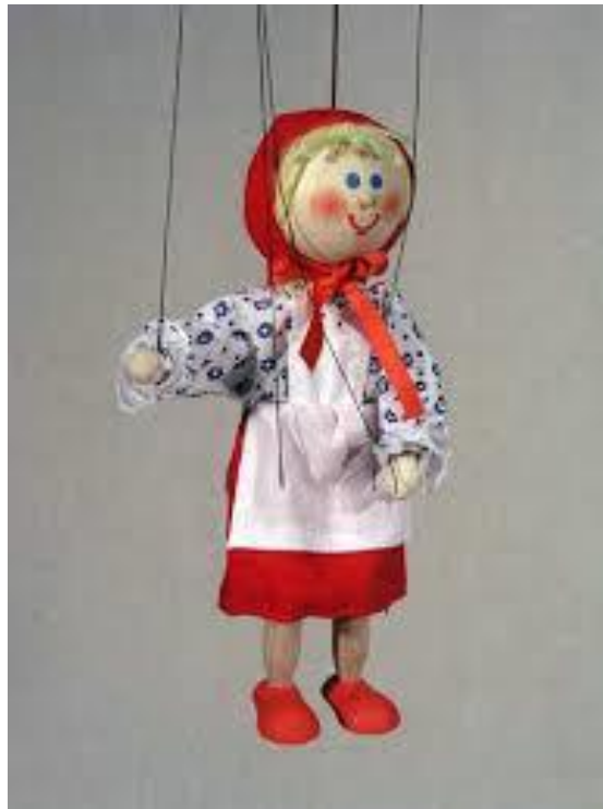
Slika 9. „Marioneta“

Osnovni materijal za izradu marionete je drvo. Marionete su lutke s dugom tradicijom, a poznate su još od doba Rimljana, Grka i Egipćana. U početku su bile vrlo jednostavne, animirane šipkom koja ide do glave, a njihovi pokreti bili su minimalni. S vremenom su te lutke dobivale konce za animacije ruku i nogu, te je stvoren drveni nosač-kontrolnik, na koji su ti konci pričvršćeni. Marionete se sastoje od glave, trupa ruku i nogu. Iako se u novije vrijeme marionete izrađuju od žice, pluta ili plastične mase, osnovni je materijal za izradu marionete drvo. Njezina je animacija složena i vrlo je teško upravljati njome. Marionete su nestvarne i poetične stoga im odgovaraju čudesne priče (Pokrivka, 1991.).