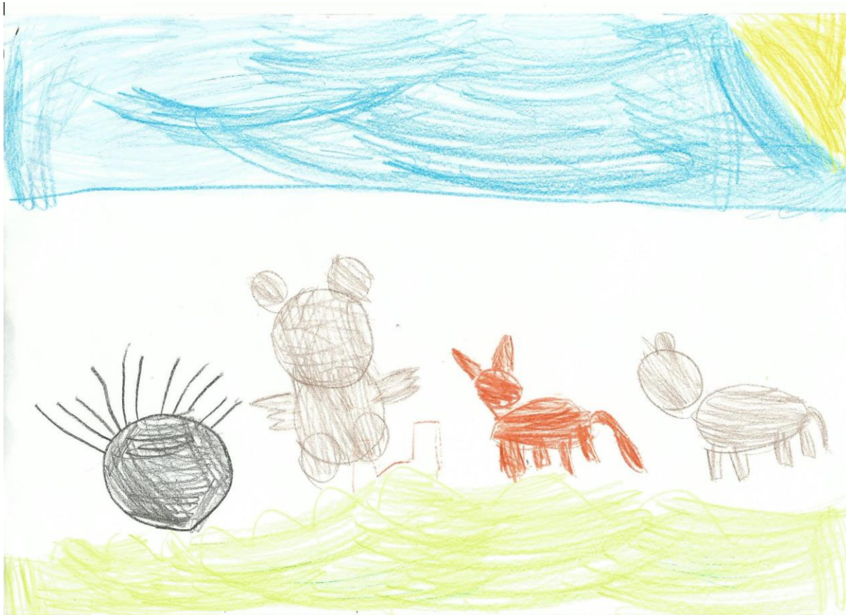
Slika 34. S. K. 5, 3 god., „Ježurka Ježić – priča“ – u ovom radu vidimo da je dijete prenijelo sve detalje iz priče. Vidimo divlju svinju, liju, medvjeda i ježa, te za svakog lika koristi drugu boju. Koristi liniju neba i liniju tla. Crtež je dosta pedantan i detaljan ali primjećujemo da na glavi nedostaju osnovni detalji poput oči, nos i usta. To može ukazivati na djetetovu lošu prilagodbu. Tehnika: olovke u boji.