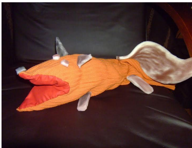
Slika 28. „Lisica“ - lutka zijevalica