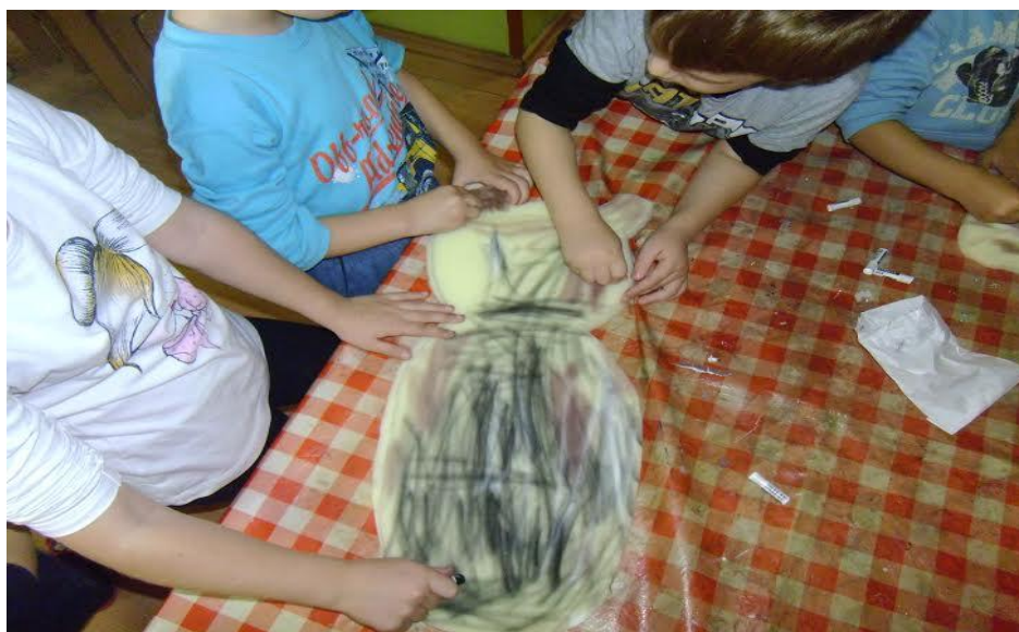
Slika 15. Bojanje spužve suhim pastelama

Kolegica i ja smo im donijele nekoliko kartonskih kutija i imale smo u planu da te kutije djeca oboje. Kroz razgovor s djecom, pažljivo smo slušale njihove prijedloge, pa smo tako došli na zajedničku ideju. Pošto su djeca imala želju da napravimo drvo za ježa, kutiju smo rastvorili te ju zarolali u oblik tuljka kako bi što više ličila deblu. Ja sam deblo izrađivala s jednom skupinom djece, dok je kolegica Martina Žgrablić s drugom skupinom djece radila lijinu kuću. Djeca su uz moju pomoć rastvorila kartonsku kutiju, pa smo ju pritiskanjem omekšali kako bi je lakše savili. Kada smo je savili, zalijepili smo ju silikonskim ljepilom. Nakon toga, njihov zadatak je bio da “deblo“ oboje smeđom temperom, pa sam im podijelila posudice s bojom i kistove. Kolegica Martina Žgrablić je s drugom skupinom djece, u zasebnoj prostoriji, gužvala novinski papir u nepravilne oblike. Kada su završili sa gužvanjem novinskog papira, lijepili su ga na kartonsku kutiju kako bi dobila oblik stijene i pritom predstavljala lijinu kuću. Kada smo dovršili brloge, išli smo s njima u šetnju u šumu i tamo smo skupljali lišće, po njihovoj želji. U šumi je bilo veoma zabavno, djeca su se igrala. Vratili smo se u vrtić i stavili sušiti lišće za sutradan.