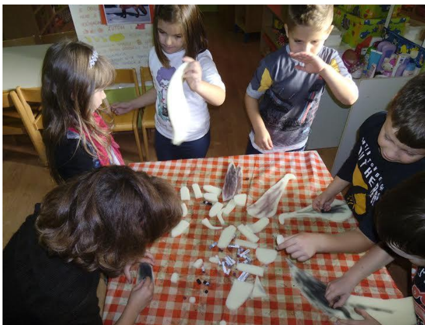
Slika 13. Djeca režu komadiće spužve te ih boje suhim pastelama