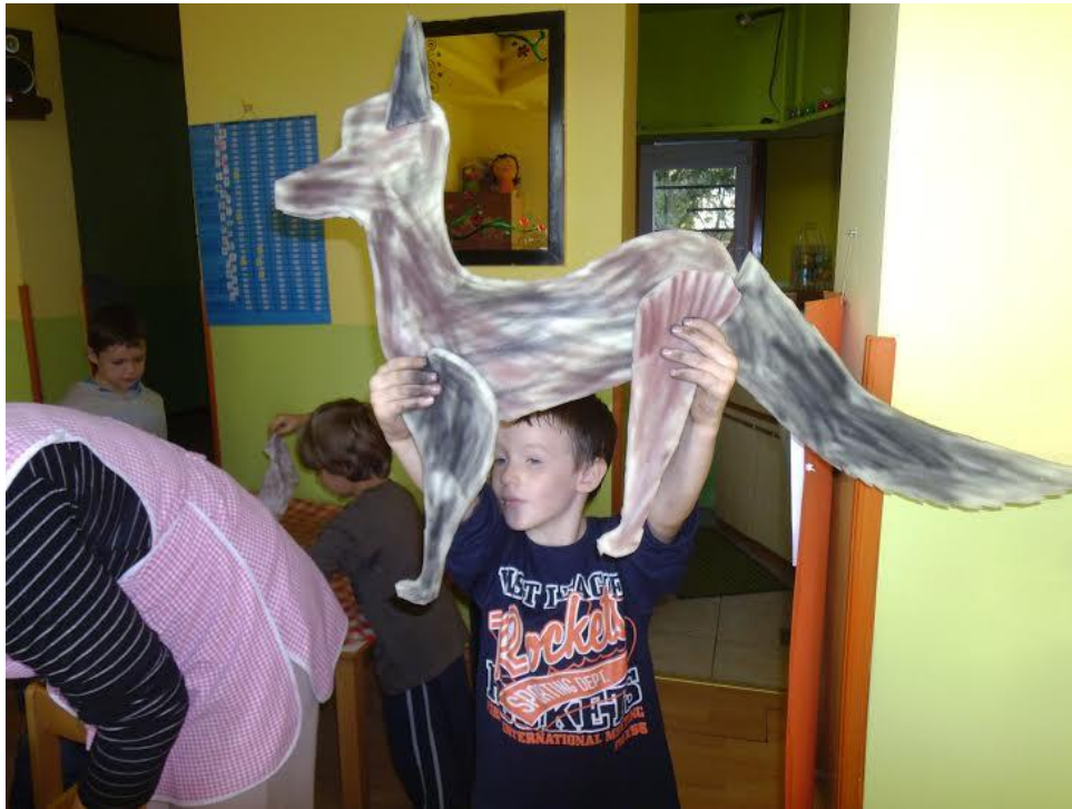
Slika 22. Dječak D.B. 6,2 god drži ne dovršenu lutku vuka