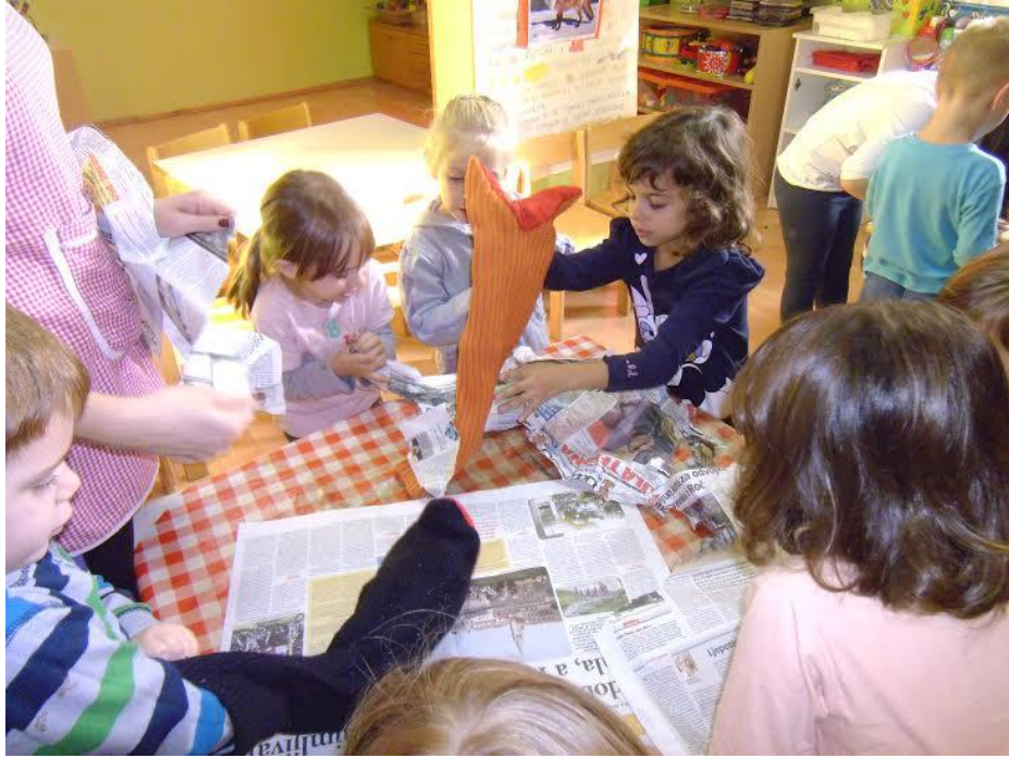
Slika 18. Gužvanje novina i punjenje štapnih lutka i lutka zijevalica