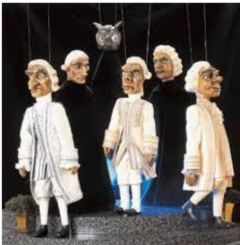
Slika 10. „ Marioneta“

Marioneta s više konaca - Ova vrsta lutke zadržala je omjere čovjeka. Sastoji se od glave, trupa, ruku i nogu te ima pokretljive zglobove. Ove marionete iziskuju veliku vještinu animatora (Vukonić-Žunić, Delaš, 2006.).