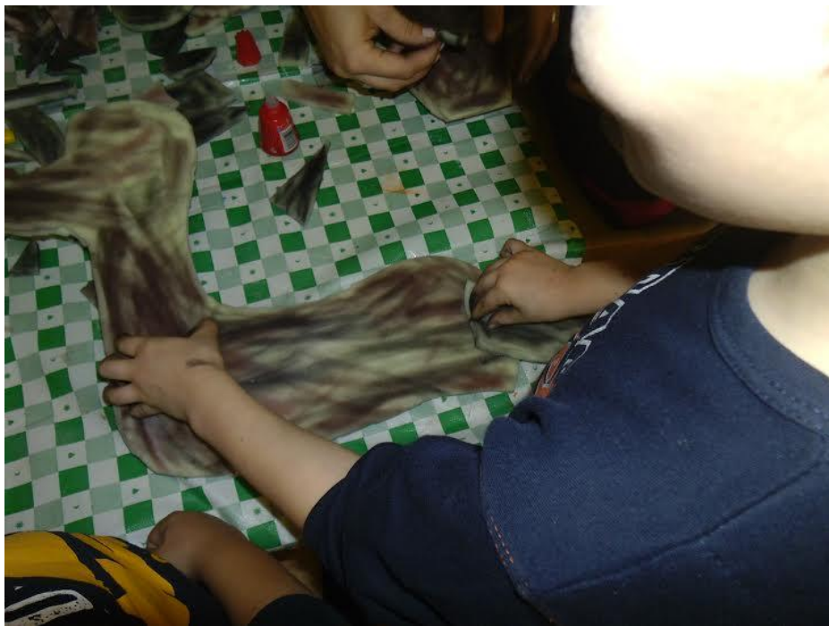
Slika 19. Apliciranje manjih dijelova spužve (šape, rep i uši) na veće dijelove (trup)spužve