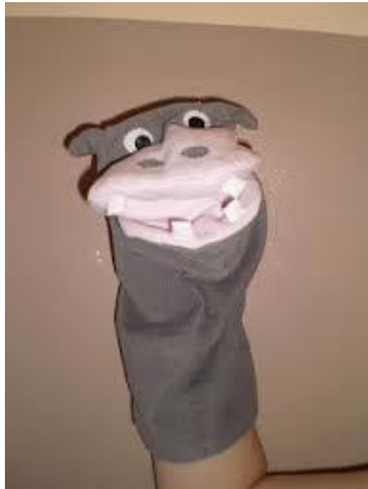
Slika 6. Lutka zijevalica

Županić-Benić (2009), ukazuje na to da lutka zijevalica ima glavu s izraženim ustima, napravljenu tako da se mogu otvarati i zatvarati, kako bi postigli da izgleda da lutka govori.