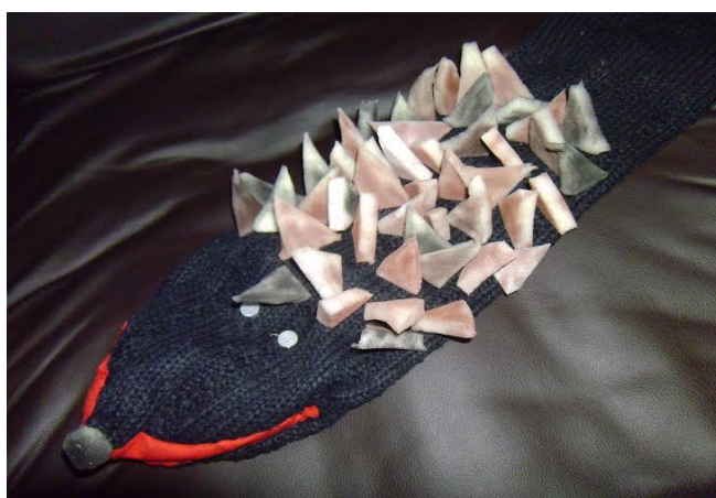
Slika 26. „Ježurka ježić“ - lutka zijevalica