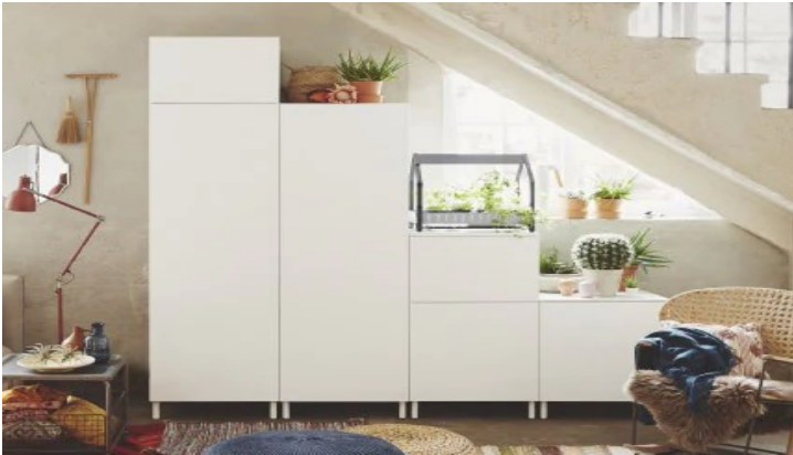
Slika 4. PLATSA ormar iz IKEA kolekcije.