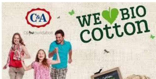
Slika 6. H&M i oznaka organskog pamuka 25 Slika 7. C&A i oznaka bio pamuka 26