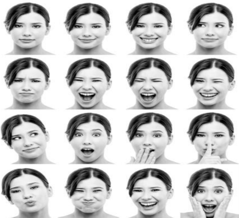
Slika 3.2. Mimika kao izraz ljudskih osjećaja

značenja u svim kulturama. (Katnić-Bakaršić 2001: 99) Geste (pokreti ljudskoga tijela, najčešće ruku ili nogu) izražavaju unutarnja stanja i osjećaje izazvane vanjskim događajima i odnos prema drugoj osobi (po gestama se osobe mogu i karakterizirati). Služe kao sredstvo pojačavanja, prijenos informacija ili zaštita, a mogu potencirati i promjenu stanja. Donose i količinsku informaciju. Često su dio rituala ili obreda te se tako vežu uz tradiciju. Mimika je najbolji pokazatelj čovjekovih osjećaja i unutarnjih stanja (pokreti očima, obrazima i slično). (Hrnjak, 2005.) Mimiku i geste možemo donekle razlikovati i prema tome pripadaju li situaciji u kojoj se govori standardno ili nestandardno. Kontrolirane i uljudne ekspresije, društveno prihvatljive i odobravajuće pripadaju izricanju u okvirima jezika kao standarda.