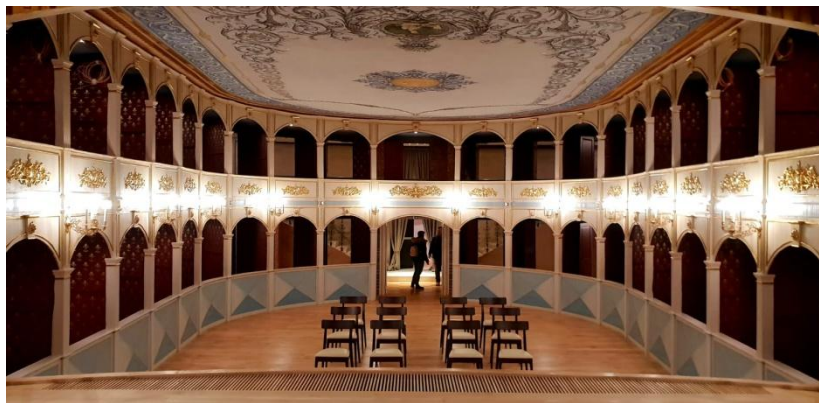
Slika 5.: Obnovljeno hvarsko kazalište