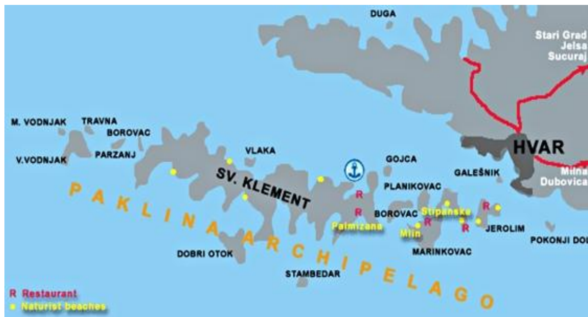
Slika 6.: Karta Paklenih otoka