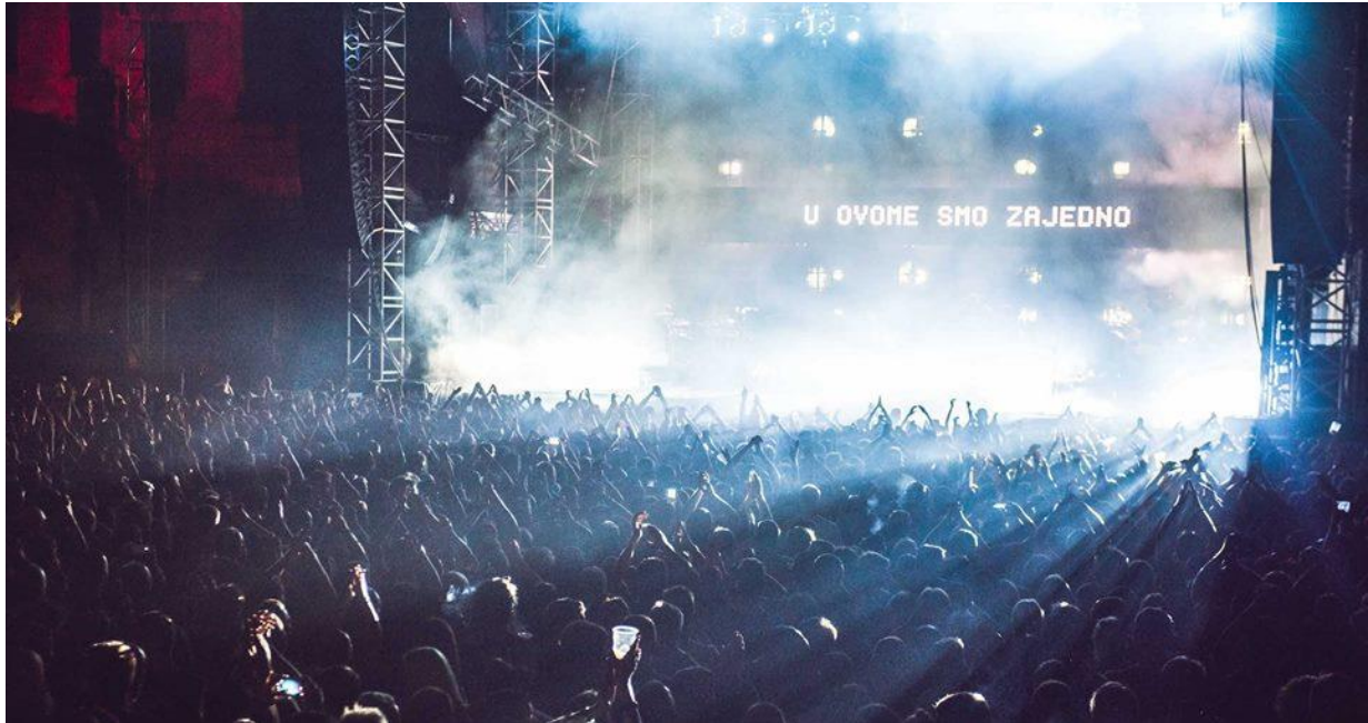
Slika 6. Dimensions Festival 2016. 23

manifestacije teško dostupne logistici današnje festivalske industrije. Zahvaljujući toj okolnosti festival je uspio stvoriti konkurentsku prednost, ali i prestižan imidž pred festivalima sličnog glazbenog izričaja.