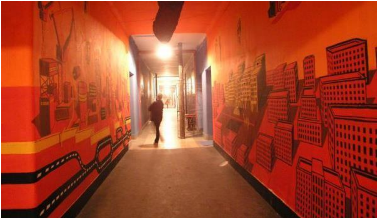
Slika 4. Oslíkani hodnici Društvenog centra Rojc 19

Antifa fest, obljetnice mirnog prosvjednog mimohoda građana Pule kao odgovora na napade neonacističke skupine tzv. skinheads na članove udruge Monteparadiso u dvorištu Društvenog centra Karlo Rojc. U sljedećim godinama djelovanja Rojc postaje međunarodno prepoznati primjer razvoja civilnog društva, održivosti i upravljanja multikulturalnim društvenim centrom s obzirom na jedinstveni model po kojem u suradnji s Gradom, Rojcem autonomno upravljaju korisnici više od stotinu aktivnih udruga. Filozofija Društvenog centra Karlo Rojc jasno nalaže osudu i protivljenje svakom obliku nasilja, homofobije, rasizma, diskriminacije, seksizma, nacionalizma ili fašizma te stvaranje solidarne društvene zajednice bez privilegiranih, potičući društvene promjene u smjeru autonomije i zajedništva. 18