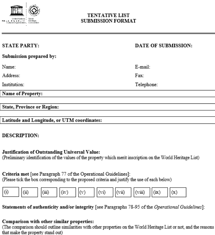
Slika 16. Dio dosjea za podnošenje Tentativne liste

„UNESCO-ov Savjet prema predanim podacima odlučuje je li lokalitet doista vrijedan nominacije. Od vlade države koja nominira lokalitet zahtijeva se da ima pravne i regulatorne okvire te mehanizme upravljanja kojima bi mogla poduprijeti samu nominaciju.“ (Jelinčić, 2008: 89). Države potpisnice trebaju se preispitati i ponovno dostaviti svoju Tentativnu listu u roku od najmanje svakih deset godina. Kulturno ili prirodno dobro, jednom upisano na Listu svjetske baštine, miče se s popisa Tentativne liste.