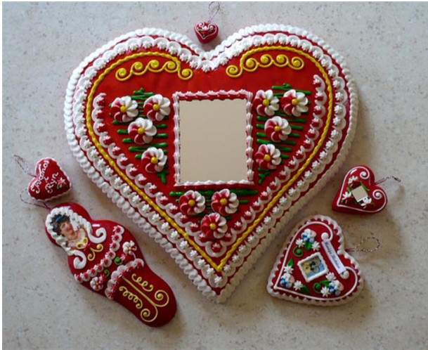
Slika 11. Medičarski obrt

Na UNESCO-ovu Reprezentativnu listu svjetske nematerijalne baštine čovječanstva ovaj fenomen upisan je 2010. godine.