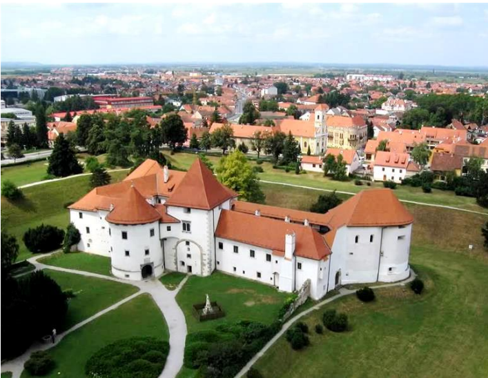
Slika 17. Stari grad Varaždin

Tvrđava Starog grada se nalazila u središtu plemićkog imanja. Kula u sredini je najstariji njen dio. Od 1446. dobiva utvrđenja – zemljane bedeme, grabišta i drvene palisade. „Unutrašnjost prizemlja glavne gotičke kule, urešena je lučno svedenim kamenim reljefima s motivima ribljeg mjehura i rozeta, najljepšim primjerima svjetovne gotičke plastike u sjevernoj Hrvatskoj.“ (Čehok, 2006: 85). Opasnost od Turaka u 16. stoljeću zahtijevala je urbanistički razvoj grada, pa je tvrđava pretvorena u renesansni „Wasserburg“, utvrdu – dvorac okružen visokim zemljanim nasipima s bastionima i zidovima, okružen pojasom vode. U kuli s