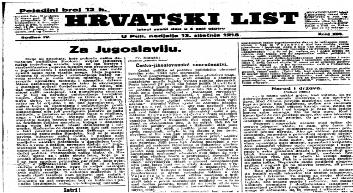
Slika 5: „Hrvatski list“, dnevnik, broj iz 13.siječnja 1918.