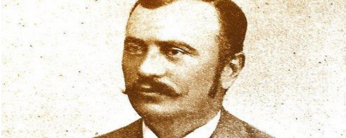
Slika 8: Dinko Trinajstić

čestim oporbama koje su se borile protiv germanizacije i mađarizacije u Hrvatskoj. Kada je krenula austrijska cenzura prebjegao je granicu Monarhije i postao član Jugoslavenskog odbora 1915. godine. Kratko vrijeme je bio predsjednik Odbora.