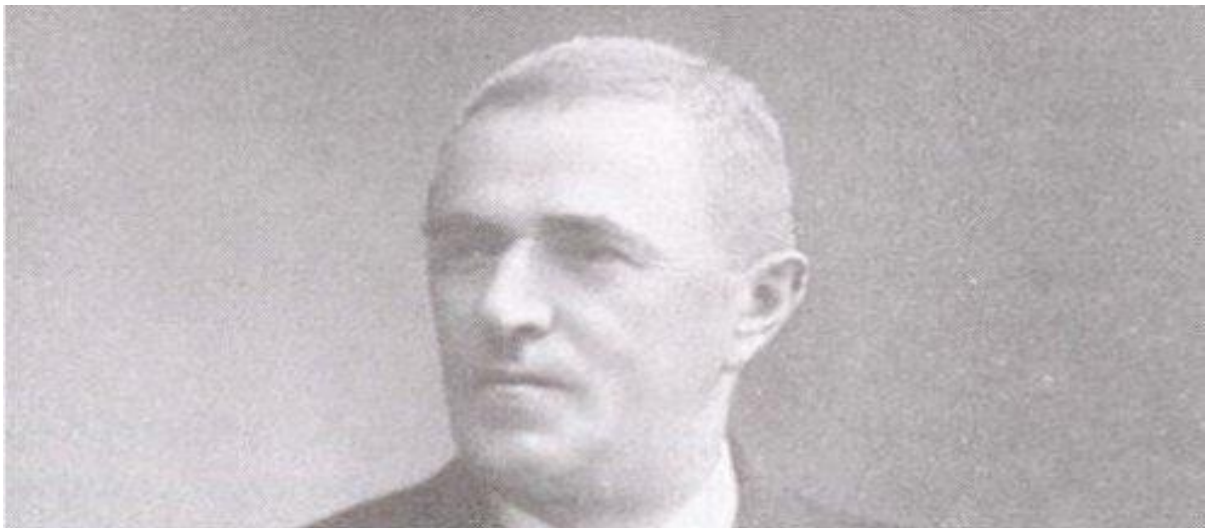
Slika 10: Vjekoslav Spinčić

„Nastojanje moje za koristi tudi tržaških Slovencev bilo je dano samo seboj tudi z razloga, ker je to slavno političko društvo imelo svoj delokrog ne samo v Trstu in njegovi okolici, ampak tudi v Istri. Kdor je delal za narod jednega, delal je tudi za narod drugega tega ozemlja. Kakor ni mej izmed slovenskega naroda na Tržaškem in slovenskega naroda v Istri, in kakor nebi niti najbolji filologi zamogli točno ustanoviti, kje da konča slovenski a kje da začne hrvatski narod v Istri; tako nisu tržaški in istarski slovenski in hrvatski politiki delali nikakih razločkov izmed Slovencev Trsta in Istre, in izmed Slovencev in Hrvatov v Istri. Skupno, bratsko bilo je njihovo delo. Skupno bratsko naj bode tudi naprej za vse čase, brez ozira na to, ali so sedaj dva politična društva, za vsako ozemlje svoje,1 ali jih bode v bodočnosti še več! Ta skupnost in to bratstvo naj se raztegne tudi dalje na ves naš narod na jugu.“ 70 Iz navedenog se vidi kako se Spinčić borio za bratstvo između Slovenaca i Hrvata kako bi se zajedničkim snagama mogli usprotiviti Austriji i izboriti svoja prava.