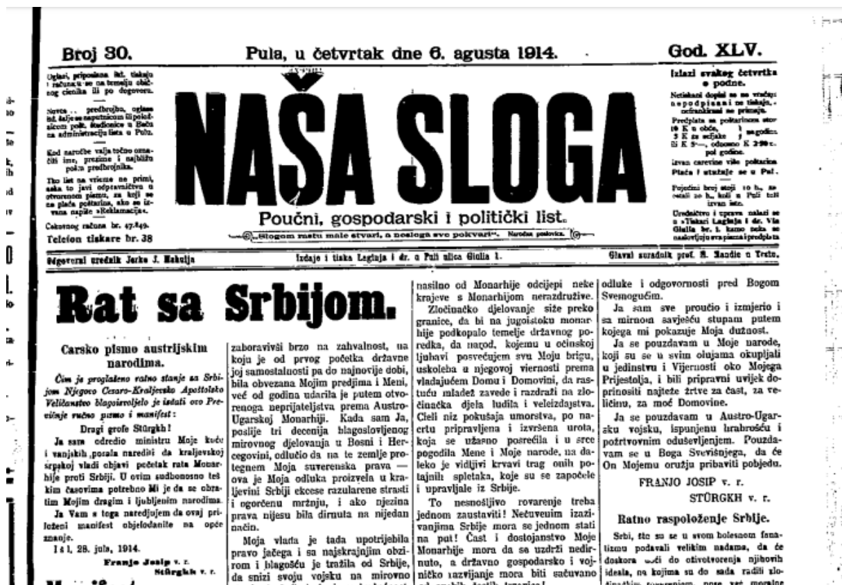
Slika 7: Najava rata protiv Srbije u istarskim novinama „Naša sloga“

obiteljima mobiliziranih u kojoj se osiguravala novčana pomoć za obitelj kojima je član obitelji mobiliziran.