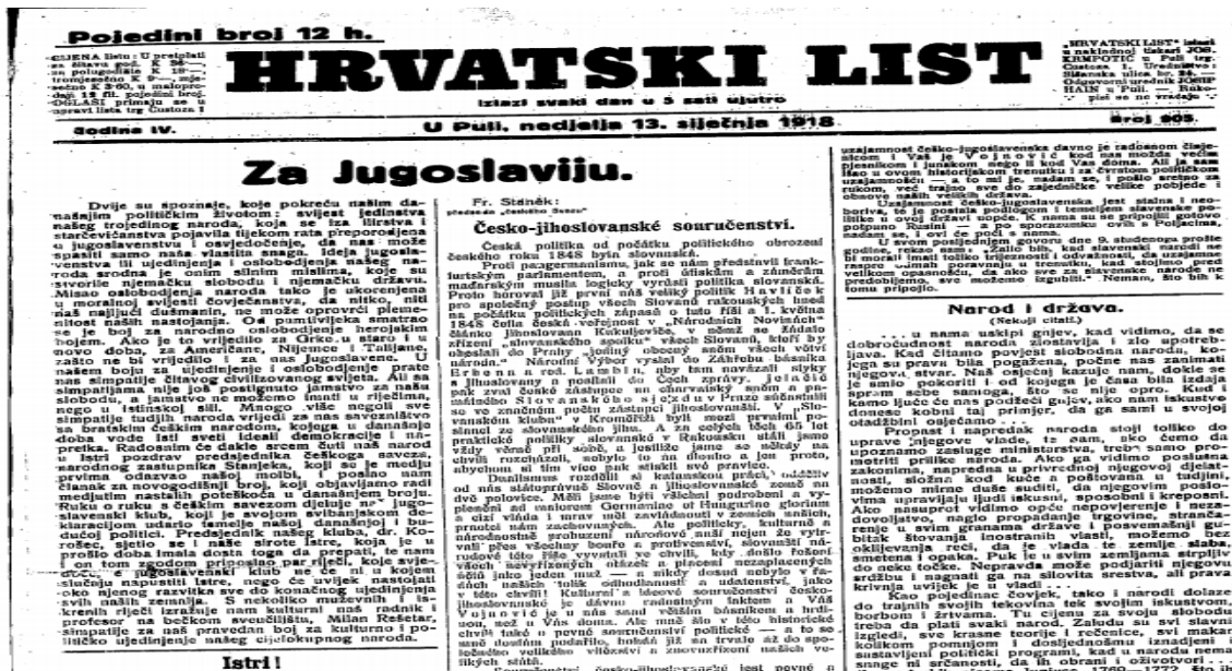
Slika 5: „Hrvatski list“, dnevnik, broj iz 13.siječnja 1918.