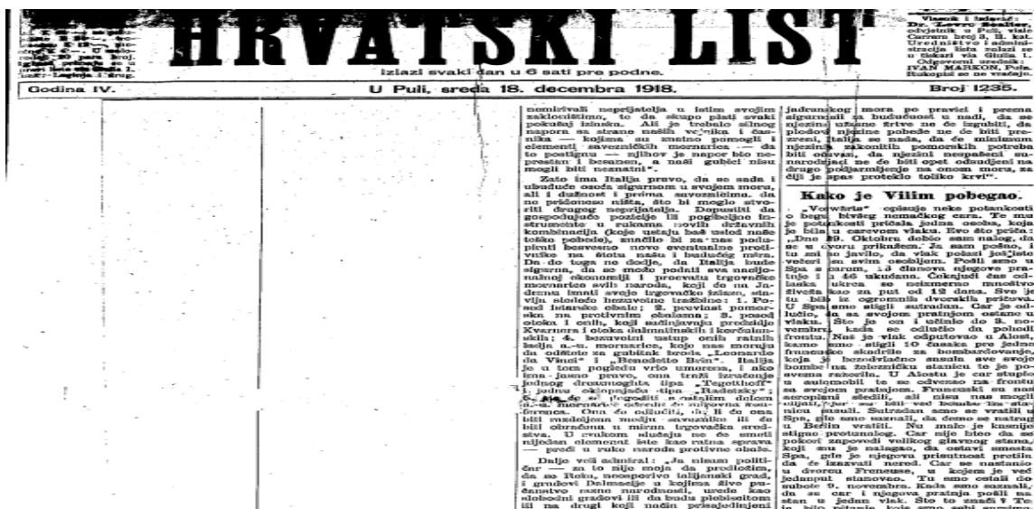
Slika 6: posljednji broj „Hrvatskog lista“

Početkom 1918. godine u list dolazi sve više dopisa iz raznih sela i gradova, o raznim dobročinstvima, o potrebi za donacijama i o drugim događajima koji su vezani za stanovništvo Istre. Prekretnicu u listu je donijela pobuna u Boki Kotorskoj, gdje su se pobunili mornari. Pobuna je ugušena i smrtnu kaznu su dobili začetnici pobune. Začetnici pobune su uglavnom bili Jugoslaveni i to je bila prva velika pobuna. Smrtne kazne koje su dobili organizatori pobune su preplašile narod i povjerenje koje su stjecali niz godina Krmpotić i ostali koji su radili tu je oslabilo.