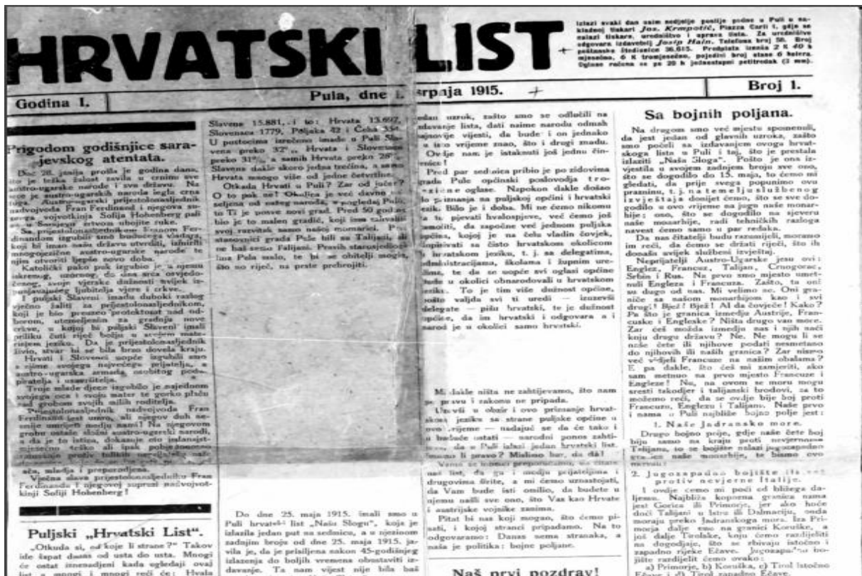
Slika 3: „Hrvatski list, dnevnik“, prvi broj

kraju izlaženja lista Antu Šepića. 1918. godine glavni urednik je bio Mijo Mirković, koji se zbog skrivanja da radi u mornarici morao potpisivati kao Mate Balota.