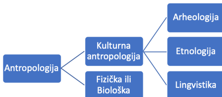
Slika 1. Podjela antropologije u Sjedinjenim Američkim Državama, 1992.

Uredila autorica prema izvoru: Jasna Čapo Žemgač (1993.), Etnologija i/ili (socio) kulturna antropologija , Zagreb. str.10.