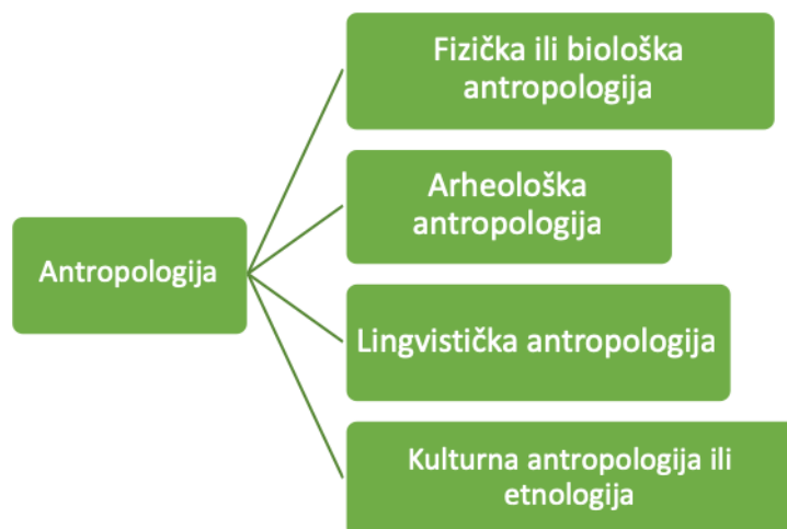
Slika 2. Podjela antropologije prema Anandu Pandianu, 1985.

Uredila autorica prema izvoru: Jasna Čapo Žmegač (1993.), Etnologija i/ili (socio) kulturna antropologija , Zagreb. Str.10.