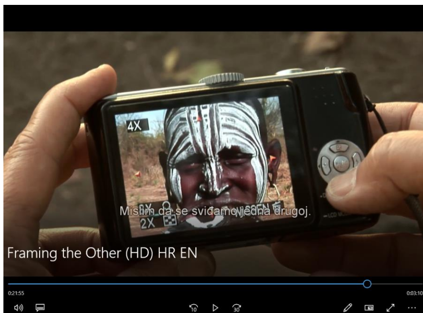
Slika 4. Percepcija interakcije od strane domorotkinje

Iz Slike 3 i Slike 4 vidimo kako rezultati interakcije podijeljeni i suprotni s obje strane.