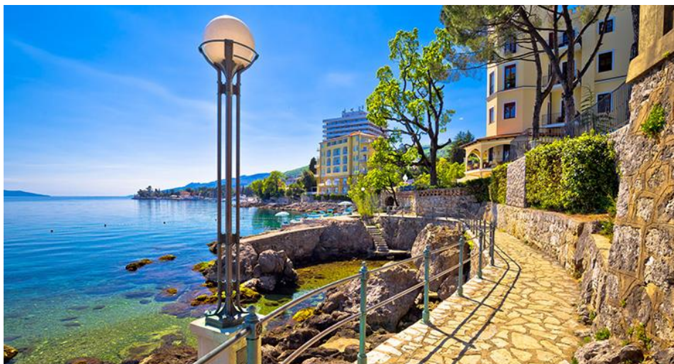
Slika 2. Opatija