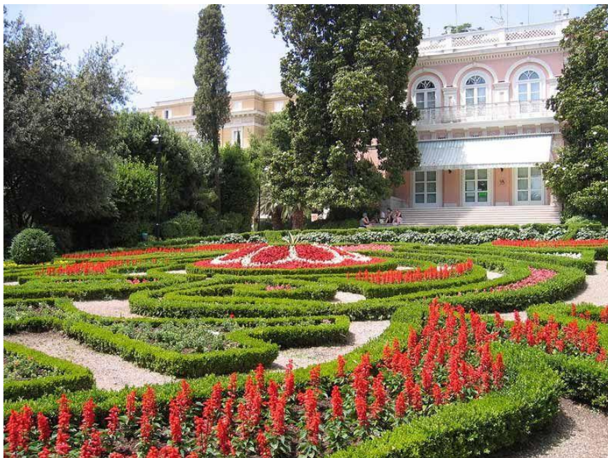
Slika 3. Villa Angiolina