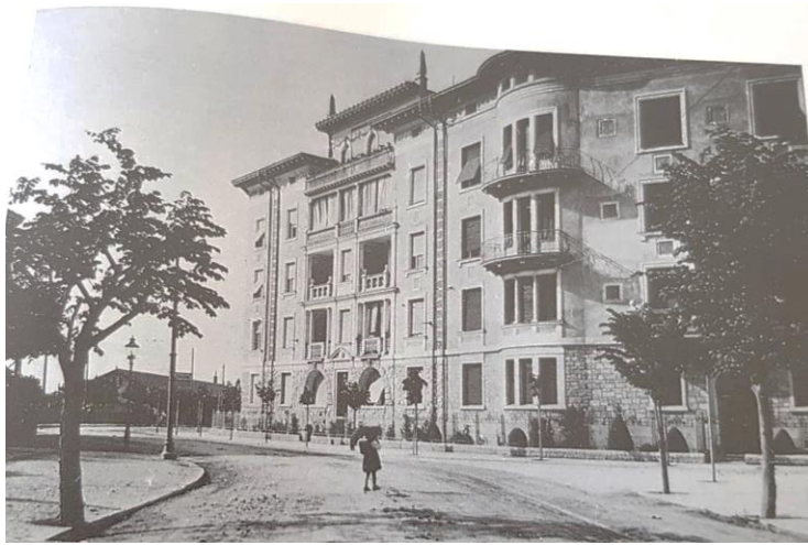
Slika 11. Pogled na vile Munz početkom 20. stoljeća

stanovanje najbliža hotelu Rivijera, sagrađena je 1901. godine, a sastoji se od podrumskih prostorija, prizemlja, tri kata, potkrovlja i svjetlarnika. 72