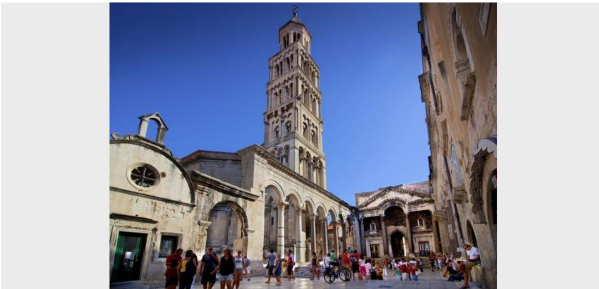
Slika 4. Peristil

u palači. „Car se pojavljivao pod arhitravnim lukom središnjeg dijela protirona, podanici su mu pristupali, klečeći mu ljubili skute njegova grimiznog plašta, ili pred njim padali ničice, ležeći cijelim tijelom na zemlji.“ 6 Istočno od njega je Dioklecijanov mauzolej. U njegovoj osnovi nalazi se hram posvećen Jupiteru. S obje strane prilaza prema hramu pronađeni su temelji koji su bili posvećeno Kibeli i Veneri. Palača je služila kao utočište rimskih velikaša koji su bili u nemilosti cara 7 .