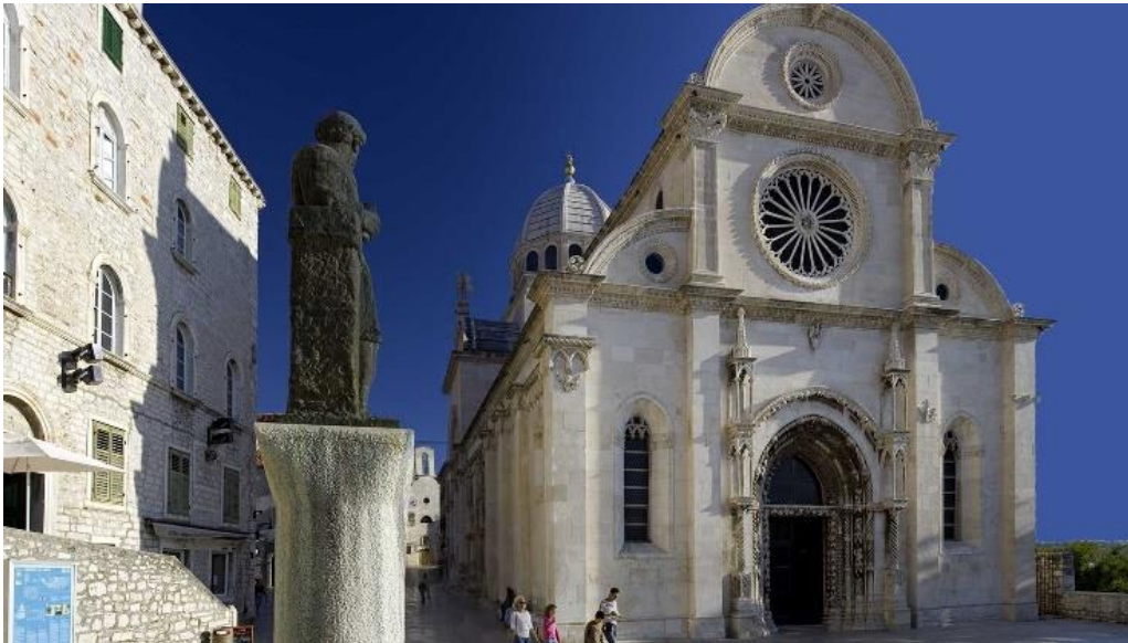
Slika 7. Katedrala sv. Jakova

katedrale završava trima apsidama. Šibenska se katedrala smatra najljepšim primjerom umjetničkog dosega svojega doba u Hrvatskoj. Izgradnja katedrale dovršena je 1536., a 1555. biskup Ivan Lucije Štafilić ju je posvetio. Katedrala je prošla temeljitu obnovu u 19. stoljeću te je nakon toga ponovno posvećena 1860.