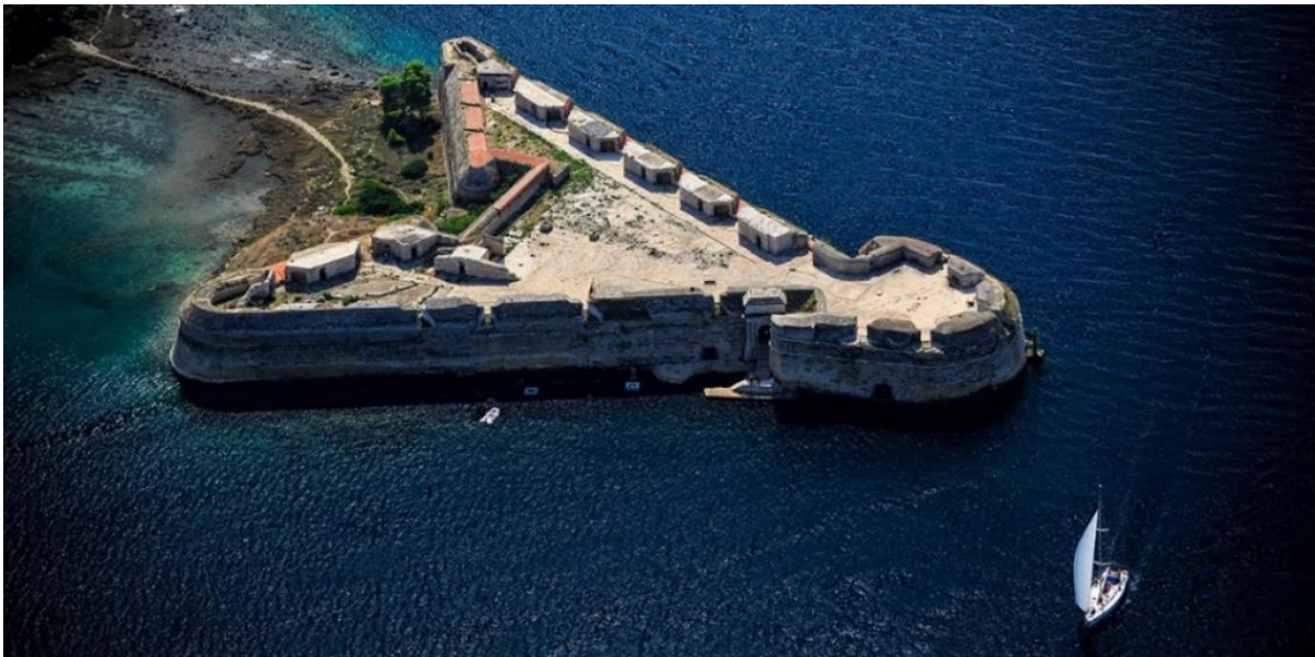
Slika 10. Utvrda sv. Nikole u Šibeniku

Pod ovim nazivom su okupljene utvrde koje su izgrađene od 16. do 17. stoljeća od strane Mletačke Republike te su služile za njezinu zaštitu od raznih neprijatelja koji su dolazili, kako s mora-Stato di Mare, tako i s kopna-Stato di Terra. Utvrde su pokrivale preko 1000 kilometara te su bile neophodne da bi štatile republiku, ali ujedno omogućile i njezino širenje na okolne prostore. Mletačka Republika je u razdoblju od 11. do 18. stoljeća bila jedna od najjačih sila te je s razvojem vojne tehnologije i uvođenjem baruta izgradnja fortifikacija prešla na novu razinu.