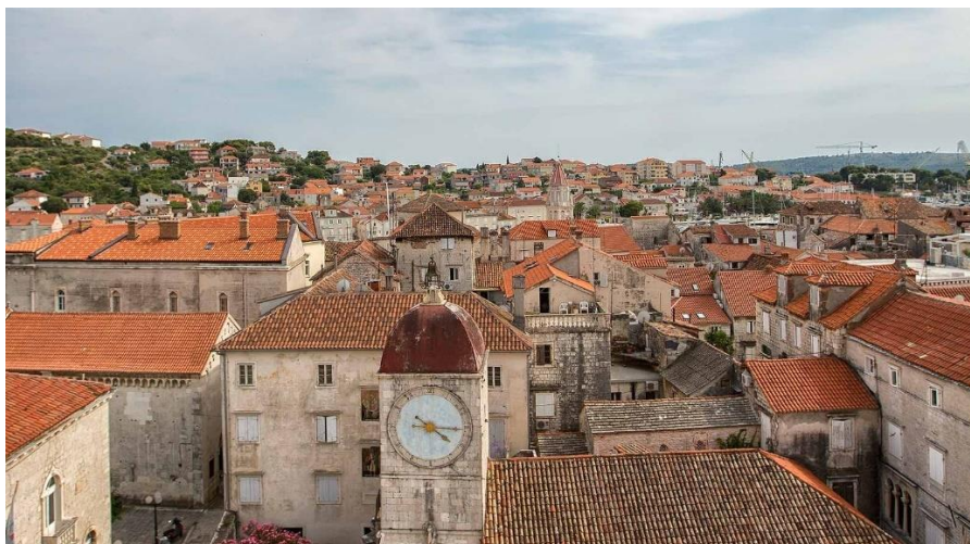
Slika 6. Povijesna jezgra Trogira