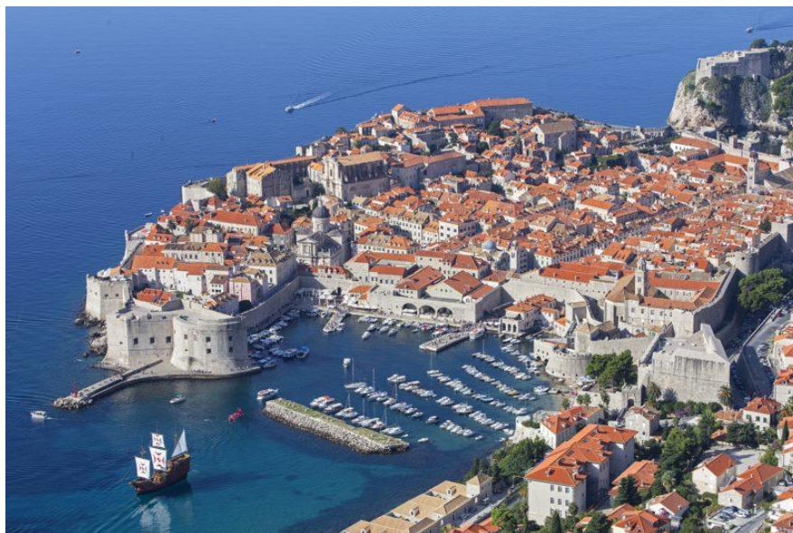
Slika 3. Gradska jezgra Dubrovnika