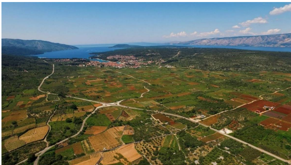
Slika 8. Starogradsko polje Hvar

strige, veličine približno 180x900 metara. Podizani su suhozidi te poljske kućice koje su služile za čuvanje alata, kao i zaklon od nevremena. Kulture koje su se najviše uzgajale bile su vinova loza, pšenica i maslina. Doseljenici su u poljima gradili nastambe, a one luksuznije su bile iz rimskog doba. Kako bi se polja zaštitila, stanovnici su na uzvišenjima formirali obrambeni sustav, čiji se ostatci mogu vidjeti još i danas. Također se mogu naći manje crkve i kapele.