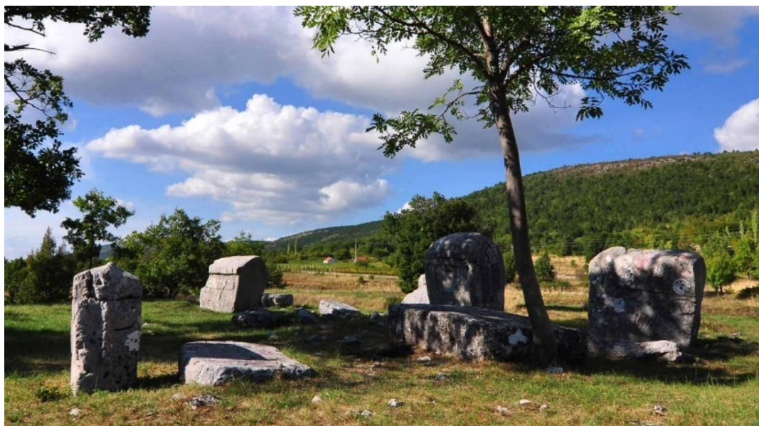
Slika 9. Stećci

Stećci su vrsta kamenog nadgrobnog spomenika. Sam naziv im dolazi od prezenta glagola stajati. Nastali su u srednjem vijeku te se na njima ocrta tadašnji život naroda. Prva pojava im se javlja u drugoj polovini 12. stoljeća, a procvat su doživjeli u 14. i 15. stoljeću. Prvi pisani zapis o stećcima je putopis Slovenca Benedikta Kuprešića koji je izdan 1530., iako je zanimljivo da je do tada uporaba stećaka bila u opadanju. Najrašireniju uporabu imali su u Bosni i Hercegovini, ali ih se može naći i u okolnim zemljama. Postoje dvije vrste stećaka: položeni i uspravni. Ukrašeni su s različitim srednjovjekovnim motivima koji su mogli biti religiozne naravi: križevi, polumjesec, ljiljan; ili svetkovne: ples, lov, turniri, prirode. Ovi motivi su se skoro uvijek međusobno miješali te su bili uklesani ili ucrtani direktno na kamenu plohu.