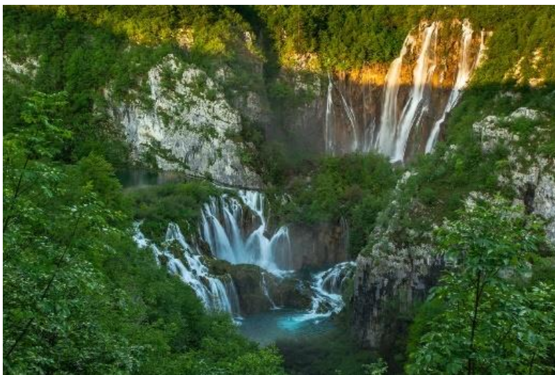
Slika 2. Plitvička jezera