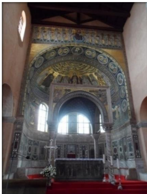
Slika 5. Središnji mozaik u bazilici

Kompleks Eufrazijeve bazilike u Poreču na listi UNESCO-ve baštine se nalazi od 1997. Ispunjava 2., 3. i 4. kriterij. Naziv je dobio po biskupu Eufraziju koji je sredinom 6. stoljeća uredio tadašnji kompleks i ukrasio ga poznatim mozaicima. Prije bazilike na tome su mjestu postojale dvije faze ranokršćanskih građevina. U Poreču je kršćanstvo utemeljeno već u 4. stoljeću. Izgradnja bazilike započela je 553. god. Kompleks su činile tri četverokutne dvorane odvojene zidovima. Srednja je služila za euharistijske žrtve, u južnoj su se čuvale relikvije i ostaci sv. Maura, a u sjevernoj je bila krstionica. Brodovi bazilike završavaju polukružnim apsidama, a u centralnoj je smješten ciborij. Posebnu umjetničku vrijednost imaju skulpture i mozaici, posebice u centralnoj apsidi koja je reprezentativni primjer bizantskog monumentalnog stila 6. stoljeća. Osim zidnih, sačuvani su i podni mozaici.