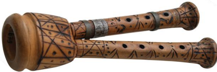
Slika 3. Šurle

instrument zove šurla (Anton Rudani), danas kaže, da je to tutula, a šurla da je nešto drugo (Ivančan, 1963: 31).