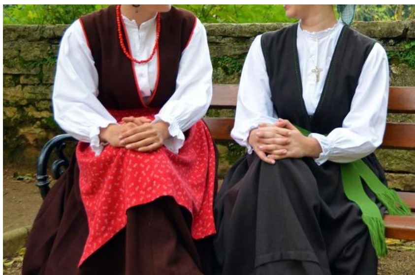
Slika 13. Ženska istarska nošnja

Žene su kosu češljale u dvije pletenice koje bi omotale oko glave, a u kosu bi uplele bijelu traku poput vijenca. Neke su nosile facu – kvadratni rubac za glavu načinjen od debljeg čvrstog platna.