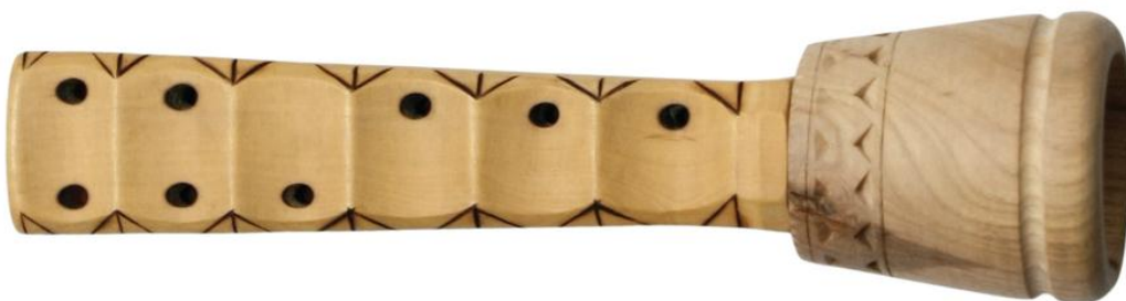
Slika 1. Mišnice

Kao glazbeni instrument, vrlo su slične gajdama. Mišnice su većinom izrađivali sami svirači, od drva masline, trešnje ili smreke. Dijelovi mišnice su miješina, kanu, zaletavac, kolarin i did, a izrađuju se od janjeće ili jareće kože, puranove kosti, drva ili plastike. Svirač upuhuje zrak kroz otvor ili kanu u miješinu, a povratak zraka sprječava zaletavac ili ventil. Did se stavlja na vrat ili kolarin, a on se stavlja na mišnice (Palčić, 2015).