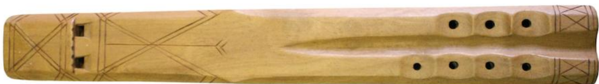
Slika 4. Vidalice

Vidalice se sastoje od dvije sviraljke i dva drvena piska. Drvo masline, javora ili trešnje, od kojih se izrađuju, treba se sušiti i do pet godina. Dimenzije vidualica nisu određene, ali su važne za intonaciju. Što je vidualica duža, ton je niži, a što je kraća, ton je viši (Palčić, 2015).