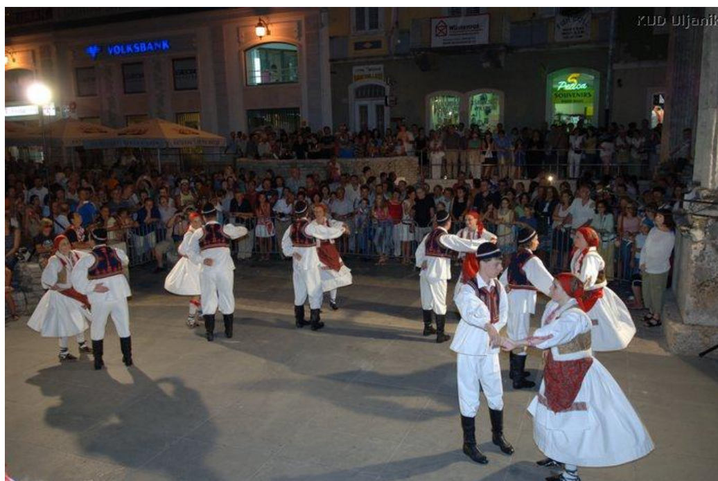
Slika 7. KUD Uljanik – Balun

(Božac, Božić, Prenc, Tkalčec, Vrtačić: Folklorni plesovi Istre u nastavi tjelesne i zdravstvene kulture, CD/DVD)