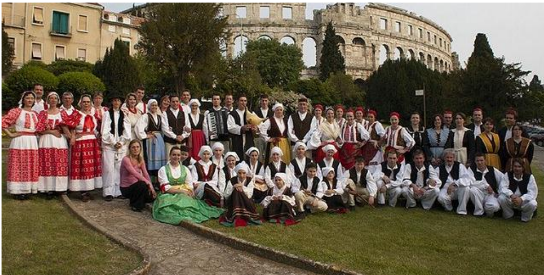
Slika 10. KUD Uljanik

promena, mažurka i slično. Uz navedene plesove, ovaj KUD neguje i glazbenu baštinu te glazbu izvodi na istarskim tradicijskim instrumentima poput miha, roženica, šurli i dr. Svake godine predstavljaju se na brojnim nastupima u zemlji i inozemstvu. Ljeti nastupaju na pulskim trgovima u sklopu manifestacije Na ulicama i trgovima . Prikazuju raznolikost nošnje i predstavljaju stare običaje i plesove. Svakog prosinca, od 1994. godine, KUD Uljanik sudjeluje na Večeri tradicijske glazbe i plesa u Istarskom narodnom kazalištu.