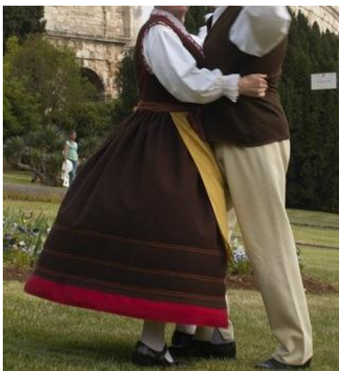
Slika 12. Istarske nošnje