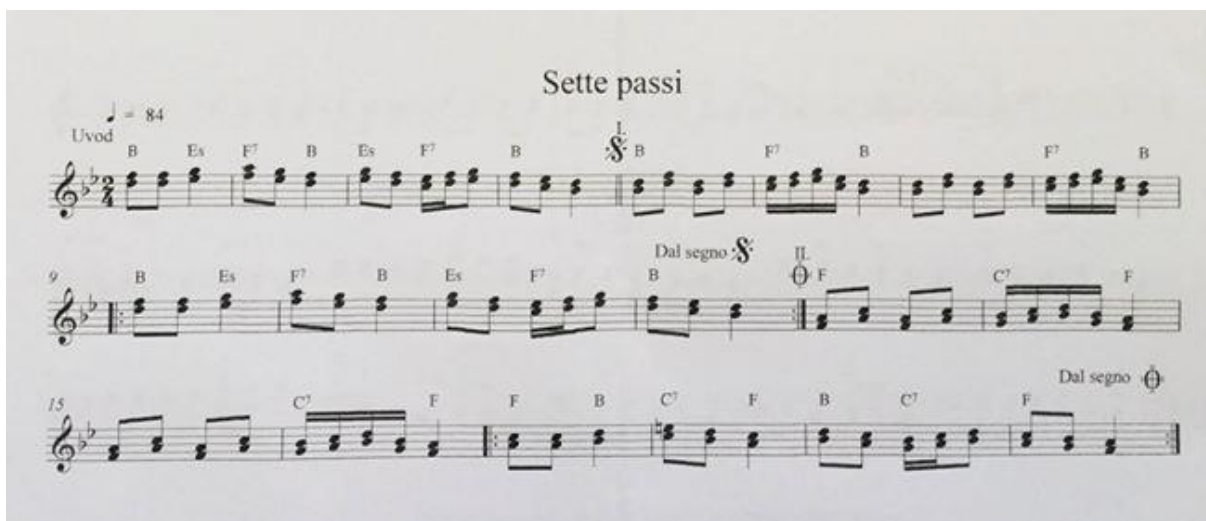
Slika 8. Notni zapis: Šete paši

(Božac, Božić, Prenc, Tkalčec, Vrtačić: Folklorni plesovi Istre u nastavi tjelesne i zdravstvene kulture, CD/DVD)