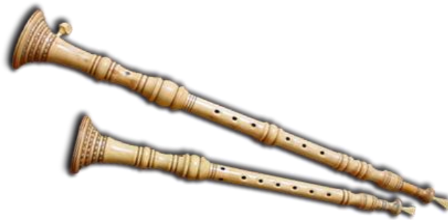
Slika 2. Roženice

Roženice su najmlađi i najpopularniji istarski instrument koji se izrađivao od maslinova, orahova ili lovorova drva. Sastoji se od dva drvena puhaća instrumenta – vela i mala roženica, sadrži pisak, špulet, prebiralice i krila. Pisak stvara ton, a često su ga svirači znali umočiti u bijelo vino kako bi lakše svirali. Pisak se stavlja na špulet. Glavni dio roženice je prebiralica koja se postavlja na krilo koje pojačava intenzitet zvuka (Palčić, 2015).