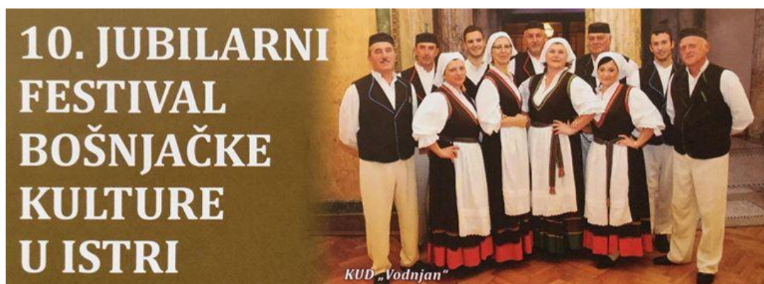
Slika 11. KUD Vodnjan