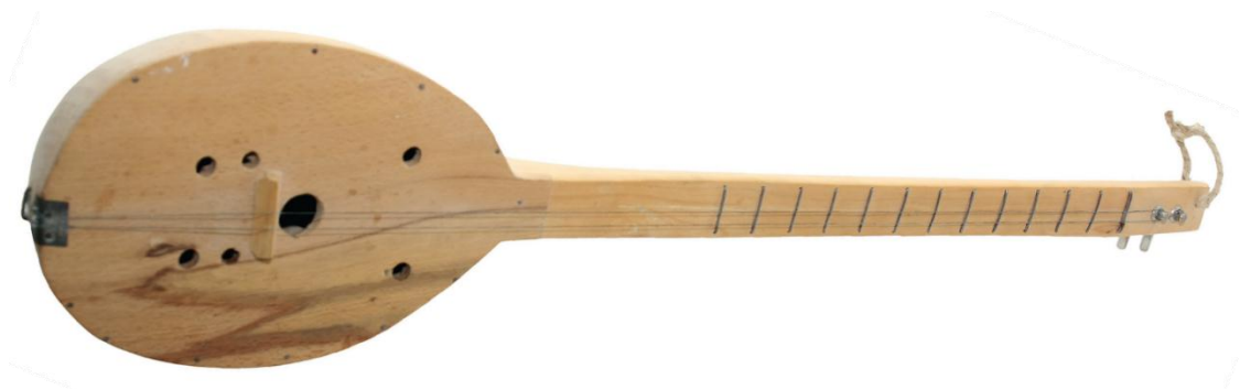
Slika 5. Tamburica na dvije žice

Istarska tamburica ili cindra je instrument koji ima dvije žice s kojih se neprestano trzalo. Najčešće se izrađuje od javorova drva. Sastoji se od korpusa, hvataljke, kobilice, gornje daske i konjića na koji su naslonjene žice. Rijetko su se izvodili plesovi uz pratnju ovog instrumenta, a najčešća je bila u selima na Ćićariji. Najpoznatiji svirač bio je Franjo Šverko iz Prapoća koji je sam izradio svoj instrument (Ivančan, 1963).