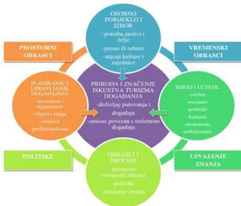
Slika br. 1. Shematski prikaz upravljanja događajima

Kako bi se dobio bolji uvid o percepciji turizma događaja u prilog rada dodana je shema koja prikazuje kako razumjeti znanje o kreiranju događaj, tj. festivala