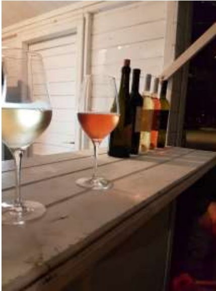
Slika br. 2. Vinski grad Pula

Kao uzorak istraživanja uzeto je 10 dobrovoljnih ispitanika što je rezultiralo sa 10 ispunjenih anketa prema kojima su izrađeni rezultati istraživanja. Ciljana populacija su bili vinari i radnici na kućicama koji su prodavali vino. Metoda uzrokovanja je neprobabilistička, a uzorak je kvotni. Dalje u radu slijedi prikaz anketa i objašnjeni rezultati uzorka.