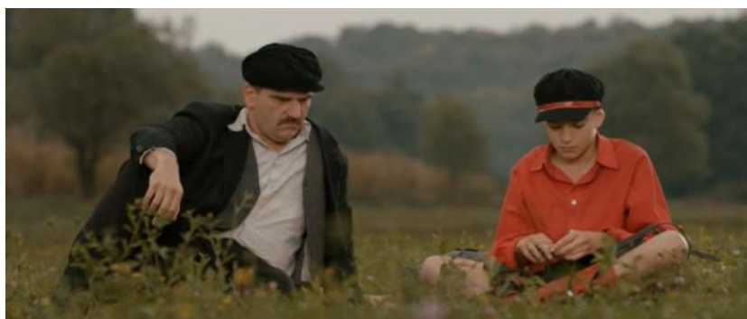
Slika 4. Šegrt Hlapić i majstor Mrkonja

U različitim izdanjima knjige i ekranizacijama, kao neizostavan Hlapićev modni dodatak pojavljuje se i kapa. U svakom je izdanju ona gotovo istog oblika, a takav oblik kape osim Hlapića nosi i majstor Mrkonja (slika 4.). Poznata je pod različitim nazivima. Ustaljen naziv našeg područja je poštarska kapa, a popularan strani izraz je Gatsby . Riječ je o kapi rađenoj od mekane, okrugle tkanine s malim obodom koja se povezivala s radničkom klasom, a u ranom 20. stoljeću u New Yorku je bila poznata i pod nazivom newsboy cap jer su je nosili dječaci koji su raznosili novine. Oko 1920-ih ovakva kapa postaje popularna među različitim klasama, kako u Americi, tako i u Europi, a prije nekoliko godina ponovno se vratila u modu (Lambeth, 2016).