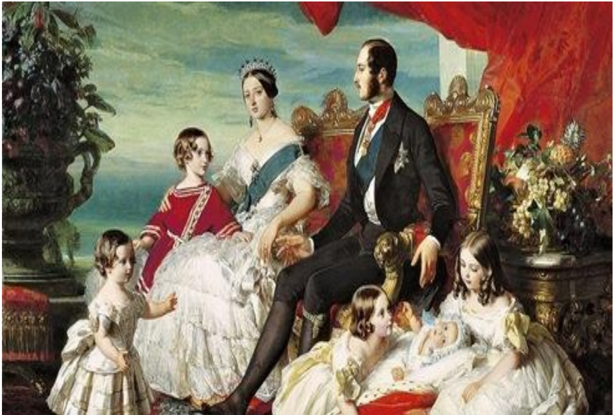
Prilog 5. obitelj kraljice Viktorije 32

mirisljava-jelka%2Fviktorija-i-albert&psig=AOvVaw1IFg89yJcWBj-HH4YswoJK&ust=1564429665078429 (posjet: 21. srpnja 2019.).