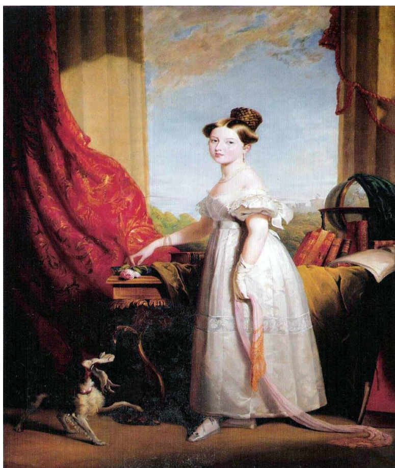
Prilog 1. Mlada Viktorija i njezin pas, kavalirski španijel Dash 12

spomenuta barunica Lehzen, poticala ju je da ne vjeruje majci i njezinim prijateljima i zbog toga su je pokušali udaljiti od Viktorije kako ne bi predstavljala opasnost, no to je dovelo do toga da je mlada buduća kraljica još više zavoli. Stalna majčina i Conroyjeva navaljivanja i upletanja jako su iscrpila Viktoriju, što je rezultiralo prekidanjem odnosa između majke i kćeri. Nije to više mogla podnositi, vršen je snažan pritisak na nju. Kanila se osamostaliti od majke, smanjila je kontakt s njom, dok je sira Conroyja otpustila iz svoje pratnje i bio je lišen bilo kakvog položaja na dvoru. 11