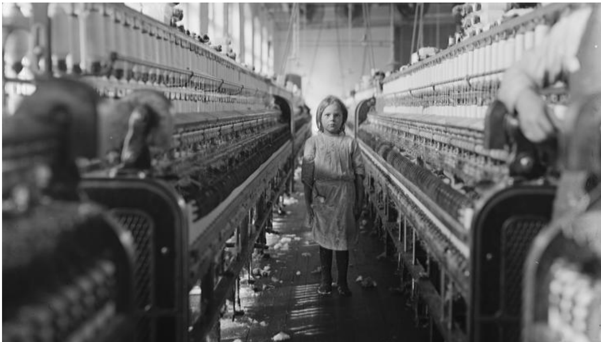
Prilog 7. Dijete - radnik tijekom industrijske revolucije 47

industrije, revoluciji prijevoznih sredstava i dr. 43 No, ona je bila uspješna i zbog dva važna čimbenika, a to su bili princip podjele poslova i razvitak mobilnog kapitala. 44 Engleska je bila glavna vodeća sila u industriji. Tekstilne industrije (pamuk) bile su na prvome mjestu, a na drugome mjestu slijedila je obrada svile. Kasnije je postala i glavni uvoznik željeza. Ujedno je prešla i na sustav slobodne trgovine. 45 Ukinućem carine na žito 1846. i Zakona o plovidbi 1849. sustav slobodne trgovine došao je do vrhunca i time su se htjele uništiti industrije koje su se rađale na području Europe. 46