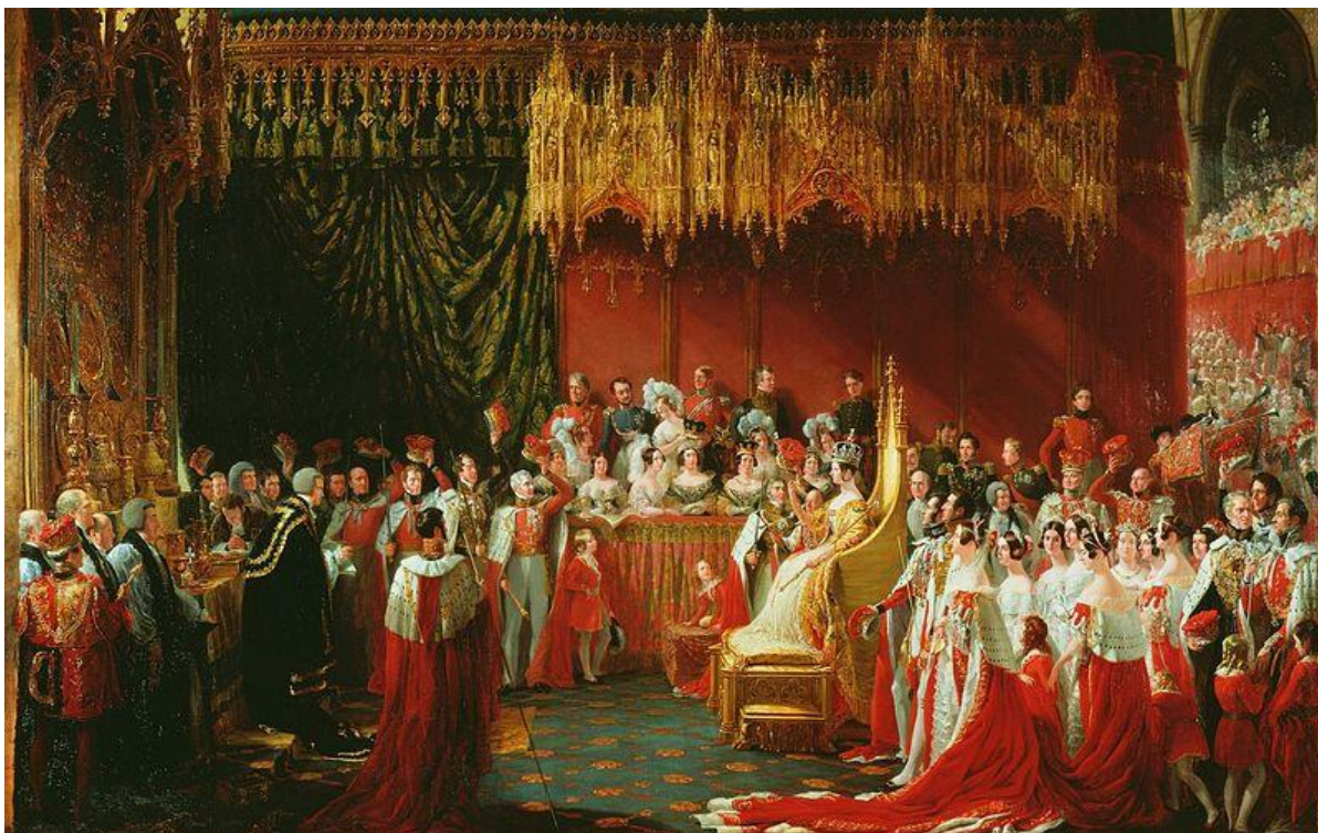
Prilog 3. Krunidba kraljice Viktorije 22