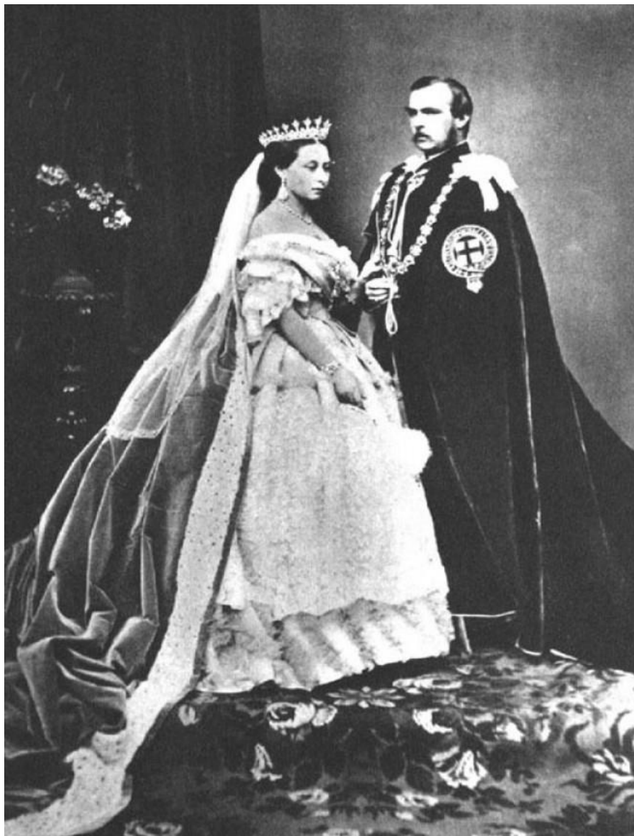
Prilog 4. – Viktorija i Albert 31

izrazito pouzdan i vjerni pratitelj kraljice Viktorije, u tolikoj mjeri da su naokolo počele kružiti glasine da između njih postoji nešto, odnosno da su ljubavnici, a čak su je iza leđa nazivali "gospođom Brown". No, naravno ništa od toga nije bilo istinito jer ipak, ljudi su poznati po tome da od muhe naprave slona. Njezino srce zauvijek je pripadalo Albertu i nitko ga nikad nije mogao zamijeniti. On je zauzimao posebno mjesto u njezinom životu te se može zaključiti da je njihova ljubav zaista bila izuzetno snažna. 30