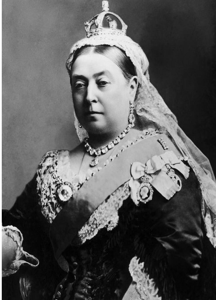
Prilog 8. Kraljica Viktorija 64