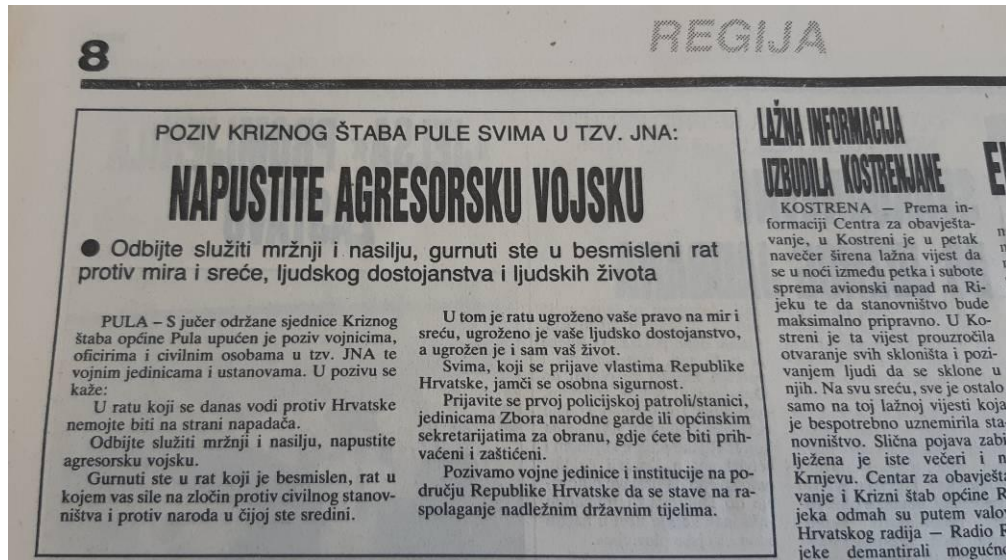
Slika 5. Krizni štab Pule preostalim armijskim djelatnicima o besmislenosti i tragediji ratovanja te poticanje da napuste JNA 228

Dana 17. rujna Jugoslavenska ratna mornarica (JRM) blokirala je pulsku luku. 229 Plovila nisu smjela uplovljavati i isplivljavati. 230 Dana 19. rujna nije propušteno pet njemačkih i dvoje austrijskih brodova za krstarenje s 25 članova posade. Imali su samo usmene dozvole. 231 Blokada je naštetila poslovanju tvornice cementa Giulio Revelante. 232 No ona je još prije negativno poslovala čemu su doprinijeli ratno stanje, nesigurnost i oprez stranih suradnika. 233