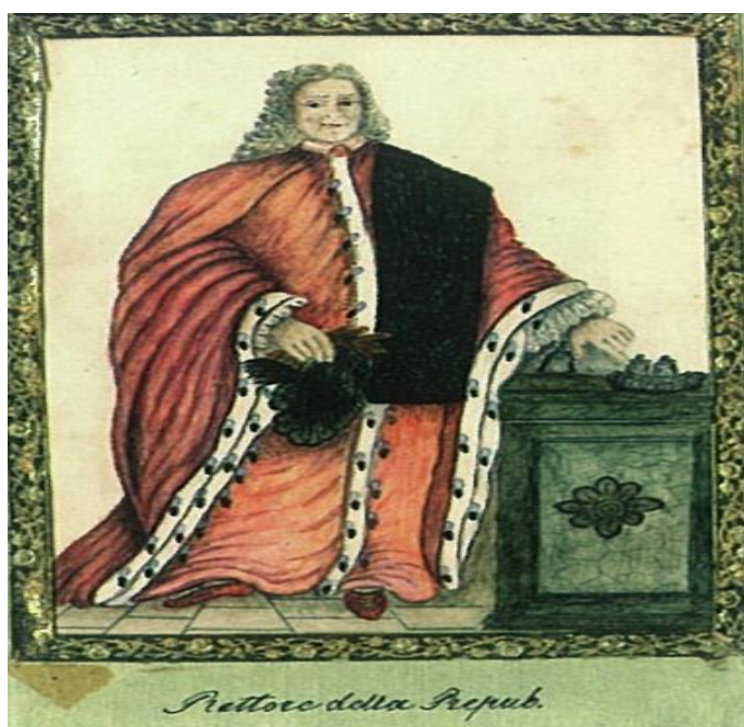
Knez Dubrovačke Republike

Ovakvim ustrojem političkih tijela u Dubrovniku sprječavao se i ograničavao utjecaj moćnijih obitelji u Dubrovniku. Sudstvo, koje je bilo vrlo bitan element dobrog funkcioniranja društva, ostalo je pod nadzorom Senata i Malog vijeća s knezom na čelu. Dubrovačka vlastela je obavljala sve funkcije u upravi i sudstvu države. Pučanima i građanima bile su dostupne samo manje važne službeničke dužnosti. Rijetki su bili slučajevi gdje bi se povjerila poneka diplomatska misija ili konzularna funkcija običnim pučanima ili građanima.