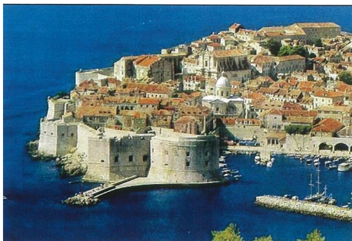
Utvrdre na ulazu u dubrovačku luku

Rat između Mletačke Republike i ugarsko-hrvatskoga kralja Ludovika je završen te 1358. kada je potpisan Zadarski mir koji je i službeno označio kraj vrhovne vlasti Venecije nad Dubrovnikom. Tada je Dubrovnik postao slobodnim gradom s jakom trgovačkom flotom, dobro utvrđen, izvrsnom diplomacijom i s velikim ugledom. Unatoč vrhovnoj vlasti ugarsko-hrvatskog kralja, Dubrovnik vodi samostalnu politiku prema Mlecima i vojvodi Hrvoju Vukčiću Hrvatiniću što pokazuje njegovu moć početkom petnaestog stoljeća. 28