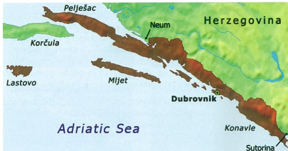
Cjeloviti državni teritorij Dubrovačke Republike

Temeljne odrednice i načela dubrovačke vanjske politike su inzistiranje na dobroj informiranosti, vrlo dobre analize i procjene vanjskopolitičkih odnosa, oprez u donošenju odluka te svijest o vlastitim mogućnostima i potencijalima. Vlada je nastojala ostvariti ravnotežu između svojih interesa i realnih mogućnosti, uvijek stavljajući na prvo mjesto prosperitet Republike. Jedno od glavnih načela dubrovačke vanjske politike bilo je izbjegavanje sukoba s drugim državama. Ako i nastane nekakav nesporazum ili konflikt, dubrovačka vlada je težila mirnom rješavanju otvorenih pitanja.