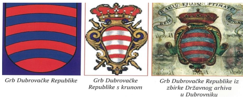
Slika 1: Grb Dubrovačke Republike 1

Osamnaesto stoljeće je vrijeme kad se Republika lagano oslobađa konstantnog pritiska Mletačke Republike. No, tad na scenu stupa Francuska koja također ne gaji simpatije prema Dubrovniku. Španjolska, koja je bila saveznik Republike sve više slabi i gubi interes za Dubrovnik, dok Francuska, koja je saveznik Osmanskog Carstva, na sve načine pokušava naškoditi Dubrovniku i podvrgnuti ga svojem teritoriju. Na kraju, upravo se to i dogodilo. Car Napoleon je 31. siječnja 1808. ukinuo Dubrovačku Republiku i pripojio je ostalim područjima pod nazivom Ilirske pokrajine.