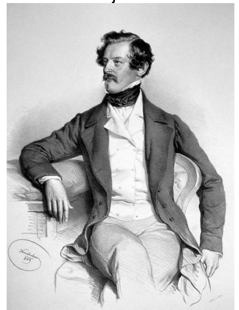
Prilog 5. Barun Alexander von Bach

S novim carem nastupalo je i novo razdoblje. Kako bi se okružio ljudima od povjerenja Franjo Josip trebao je nove ministre. Grofu Stadionu, ministru unutarnjih poslova je nakon donošenja ožujskog ustava 1849. počelo opadati mentalno zdravlje. Stadion se ovim ustavom želio boriti protiv federalizma krunskog plemstva time da je integrirao lokalnu autonomiju i samoupravu u centralnu administraciju te je primijenio koncept građanstva tako da svi građani, bez obzira iz kojeg djela Monarhije, budu jednaki pred zakonom. 12 Premijer Felix Schwarzenberg imenovao je Alexandera Bacha za ministra unutarnjih poslova, baruna Karla von Brucka za ministra financija te Antona von Schmerlinga za ministra pravosuđa, međutim on 1851. daje ostavku zbog baruna Karla von Kübecka koji je izbacio sve predstavničke odredbe iz Stadionovog ustava. 13