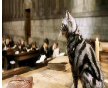
Slika 2. Minerva McGonagall- Animagus