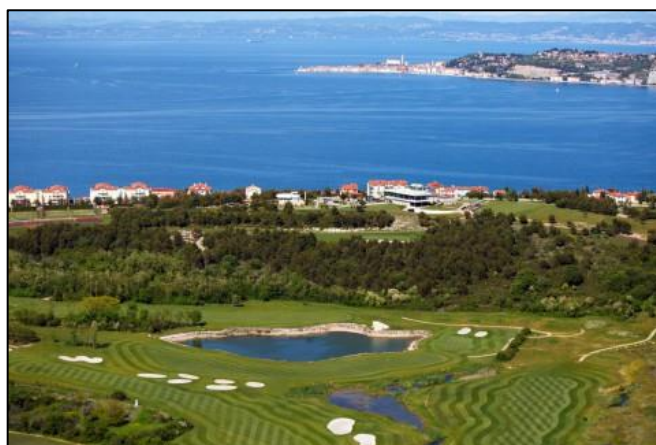
Slika 4 Golf Club Adriatic