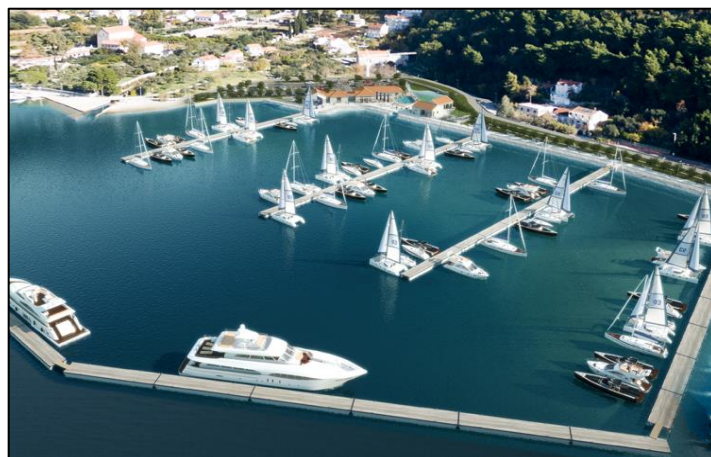
Slika 3 Nautički turizam