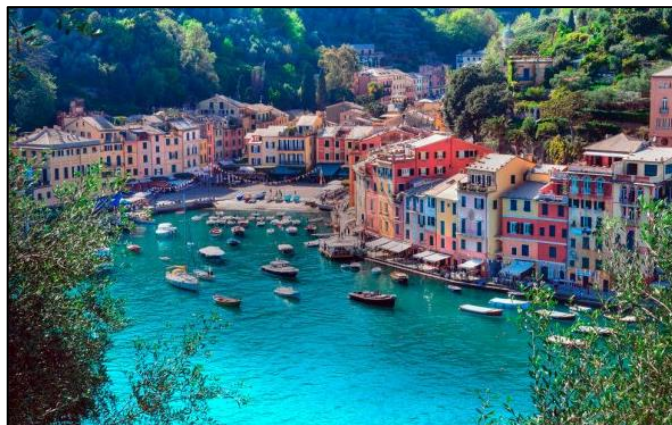
Slika 2 Portofino