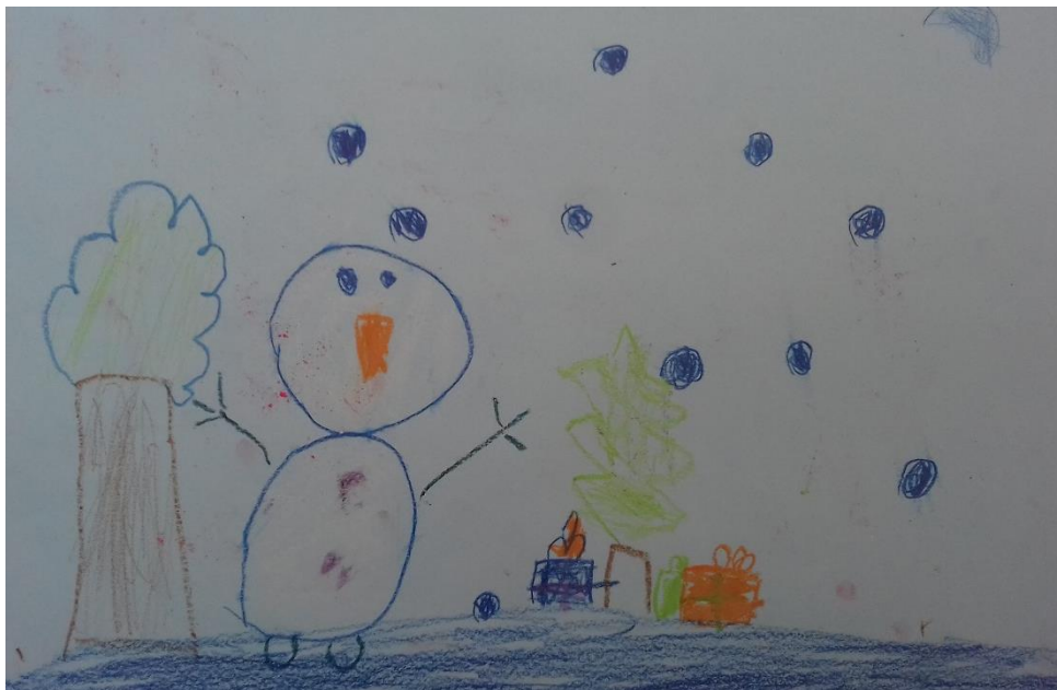
Slika 14. Pastela

„Zimi pravim snjegovića.“ djevojčica (6,5 god)