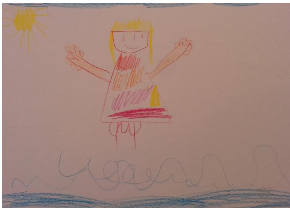
Slika 6. Drvene bojice

„Ovo sam ja na plaži, ljeti najviše volim ići na more.“ djevojčica (5,4 god)