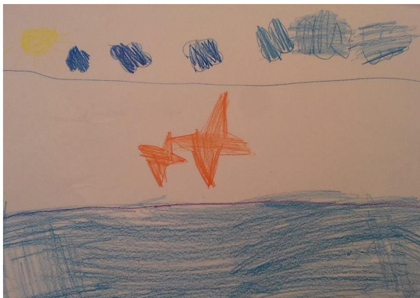
Slika 9. Drvene bojice

„Nacrtała sam more, tu su i zvijezde iz mora.“ djevojčica ( 6,3 god)