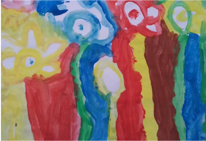
Slika 5. Tempere

„Teta sviđa li ti se? Nacrtała sam veliko cvijeće i sunce, moja najdraža boja je žuta.“ djevojčica ( 4,10 god)