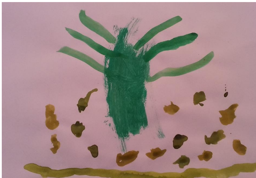
Slika 11. Akvarel

„Nacrtao sam stablo, lišće je palo sa stabla po podu.“ dječak (4,3 god)