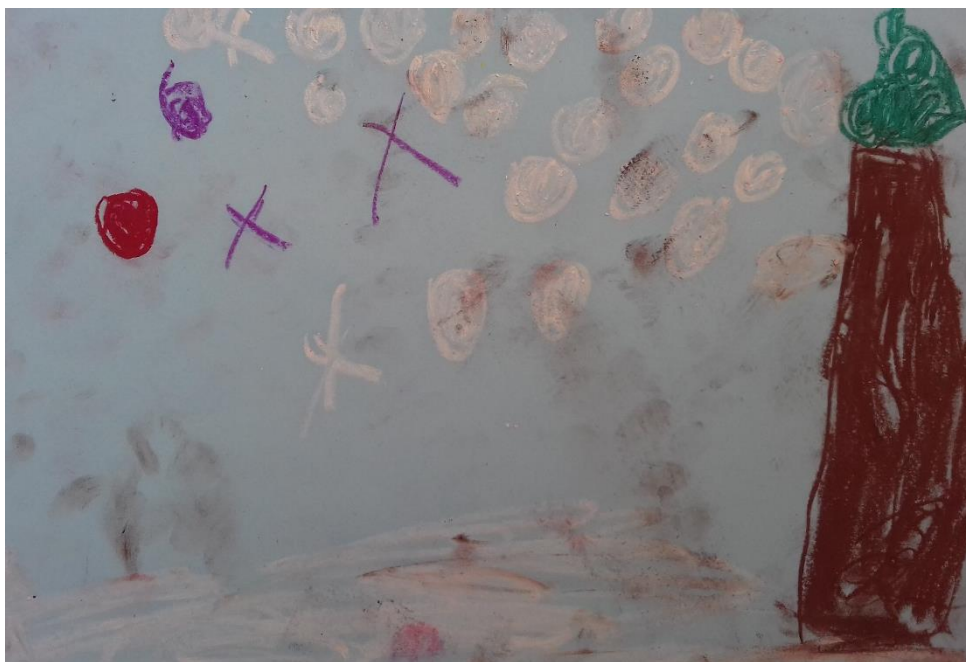
Slika 16. Pastela

„Nacrtała sam snijeg, kišu, pahuljice.“ djevojčica (4,2 god)