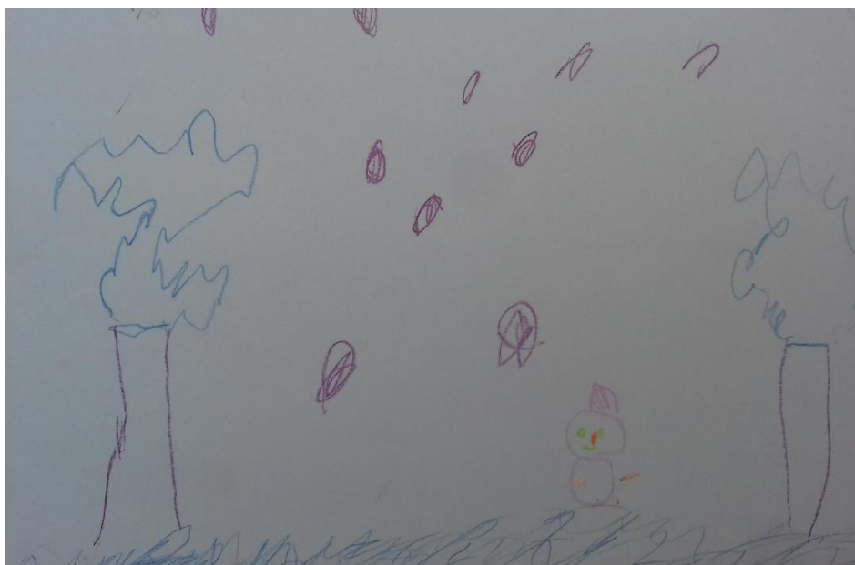
Slika 17. Pastela

„Nacrtała sam snijeg, drveće i snjegovića.“ djevojčica (5,8 god)