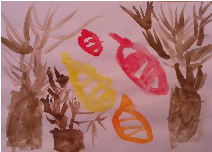
Slika 12. Akvarel

„Ovo su drveća s kojih pada lišće, lišće je žute i crvene boje.“ djevojčica (6,3 god)