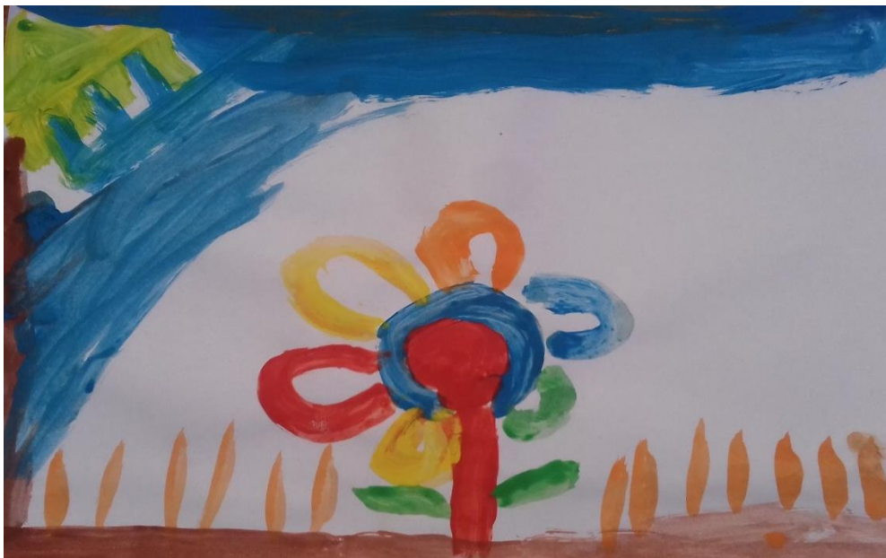
Slika 2. Tempere

„U proljeće raste cvijeće, nacrtala sam šareni cvijet.“ djevojčica (5,8 god)