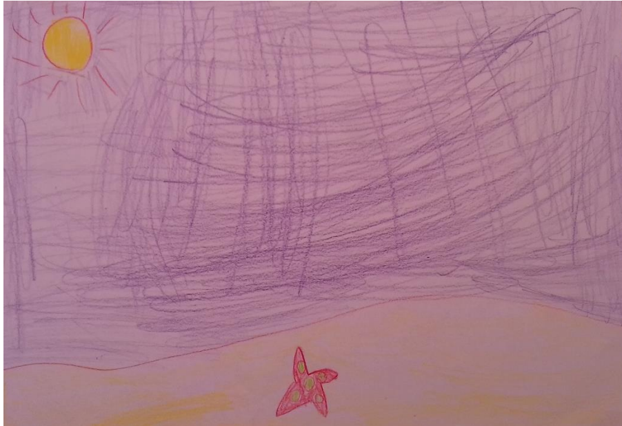
Slika 7. Drvene bojice

„Nacrtao sam zvijezdu u moru i more.“ dječak (6,2 god)