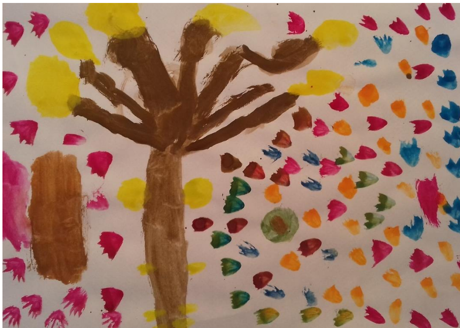
Slika 10. Akvarel

„Jesen je šarena.“ djevojčica ( 6,5 god)