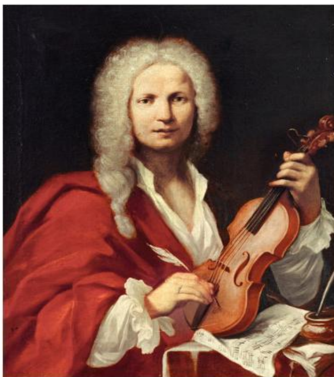
Slika 1. Antonio Vivaldi