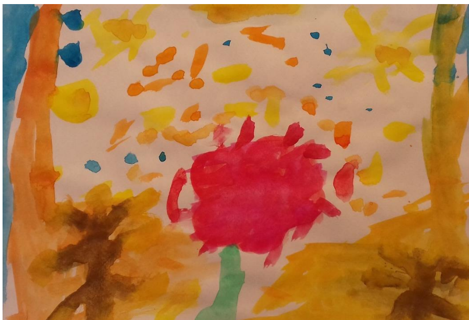
Slika 13. Akvarel

„Nacrta sam cvijet i vjetra koji puše.“ djevojčica (6,5 god)