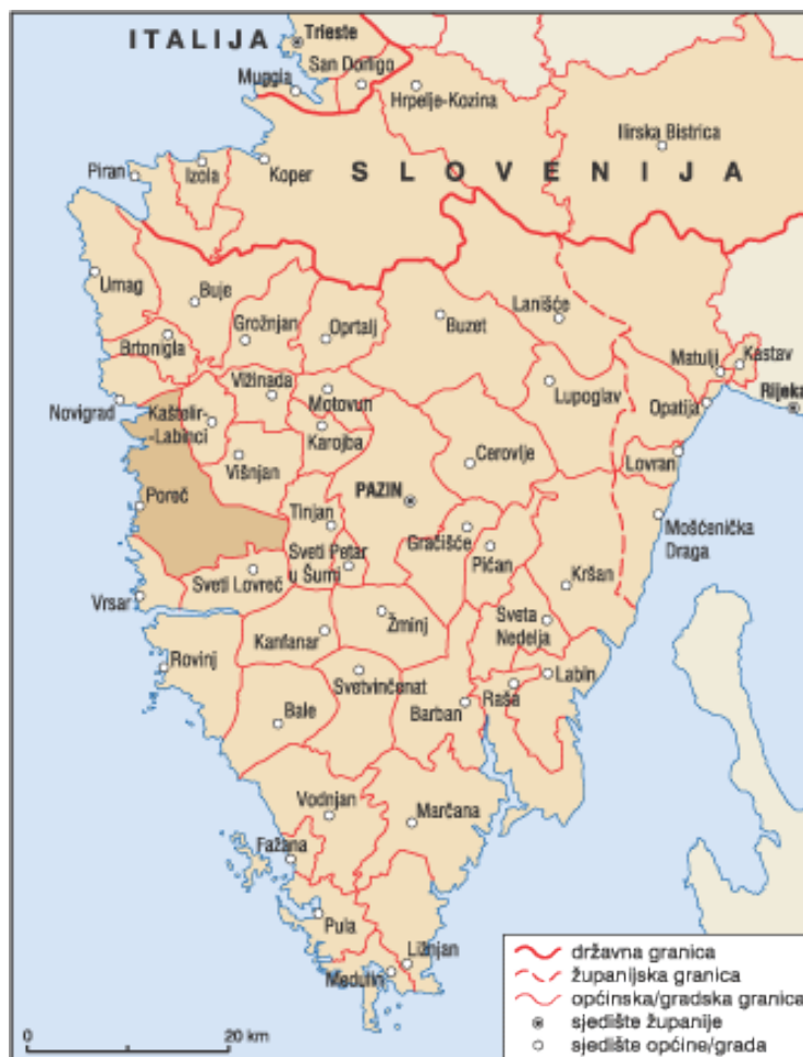
Slika 2. Lokacija grada Poreča u Istarskoj županiji