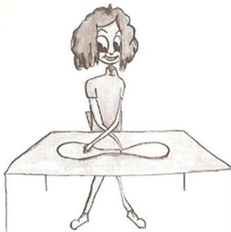
Slika 3. Taping rukom (Pejčić, 2005)

Ocjenjivanje: Izvedba traje 20 sekundi. Rezultat je broj uspješnih dvostrukih dodira u roku od 20 sekundi, ako nisu dotaknuta oba kruga mjeritelj to ne broji (Pejčić, 2005).