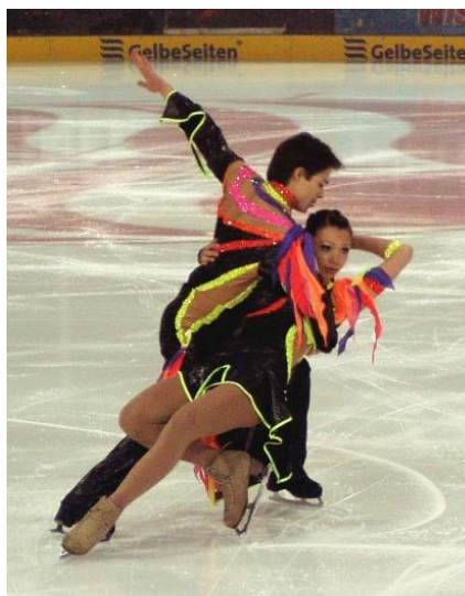
Slika 4. Klizanje

Koordinacija se razvija vježbanjem odnosno treniranjem slijedećih aktivnosti: akrobatika, klizanje, koturaljkanje, ritmičko-športska gimnastika i drugo ( Slika 4. ).