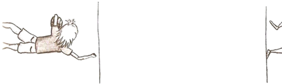
Slika 5. Puzanje s loptom (Pejčić, 2005)

Zadatak: Dijete leži na podu ispred startne crte, jednom rukom drži loptu tako da je stisne uz tijelo. Na znak dijete počinje puzati. Prilikom puzanja ne smije ispustiti loptu niti je smije kotrljati po podu. Kada prijeđe ciljnu crtu koja je od starta udaljena 4 m, zadatak je završen. Ukoliko dijete za vrijeme izvršavanja zadatka ispusti loptu, zadatak se mora ponoviti.