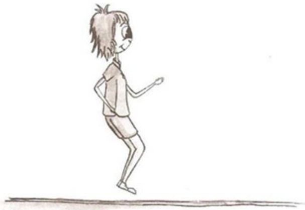
Slika 1. Sunožni bočni preskoci (Pejčić, 2005)

Ocjenjivanje: Upisuje se broj sunožnih izvedenih preskoka. Kao jedan preskok broji se jedan preskok preko užeta i preskok natrag (Pejčić, 2005).