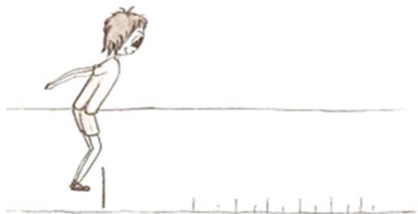
Slika 2. Skok u dalj iz mjesta (Pejčić, 2005)

Ocjenjivanje: Upisuje se sva tri skoka i ocjenjuje se onaj skok koji je bio najbolji.