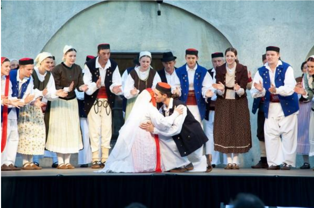
Slika 17. Nastup folklornog ansambla KUD-a Klek

Društvo poseban naglasak stavlja na duhovne pjesme pa KUD „Klek“ svake godine održava Božićni koncert na kojem izvodi preko 60 božićnih pjesama iz različitih krajeva Hrvatske (Službene stranice grada Ogulina, 2020). Jedan je od takvih nastupa zabilježen je na Slici 17 .