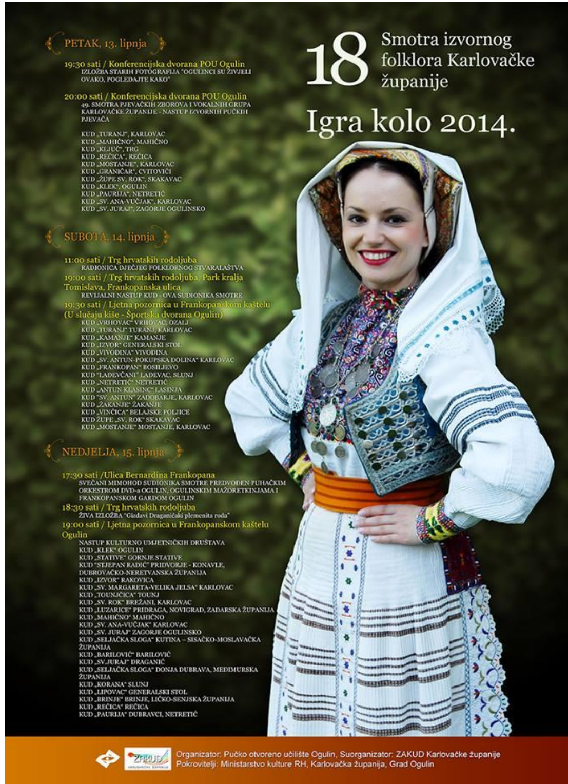
Slika 18. Plakat za Smotru izvornog folklor Karlovačke županije

su zaigrati stare pučke igre. Subota i nedjelja bile su rezervirane za svečani mimohod svih sudionika i njihov nastup (Ogportal, 2020).