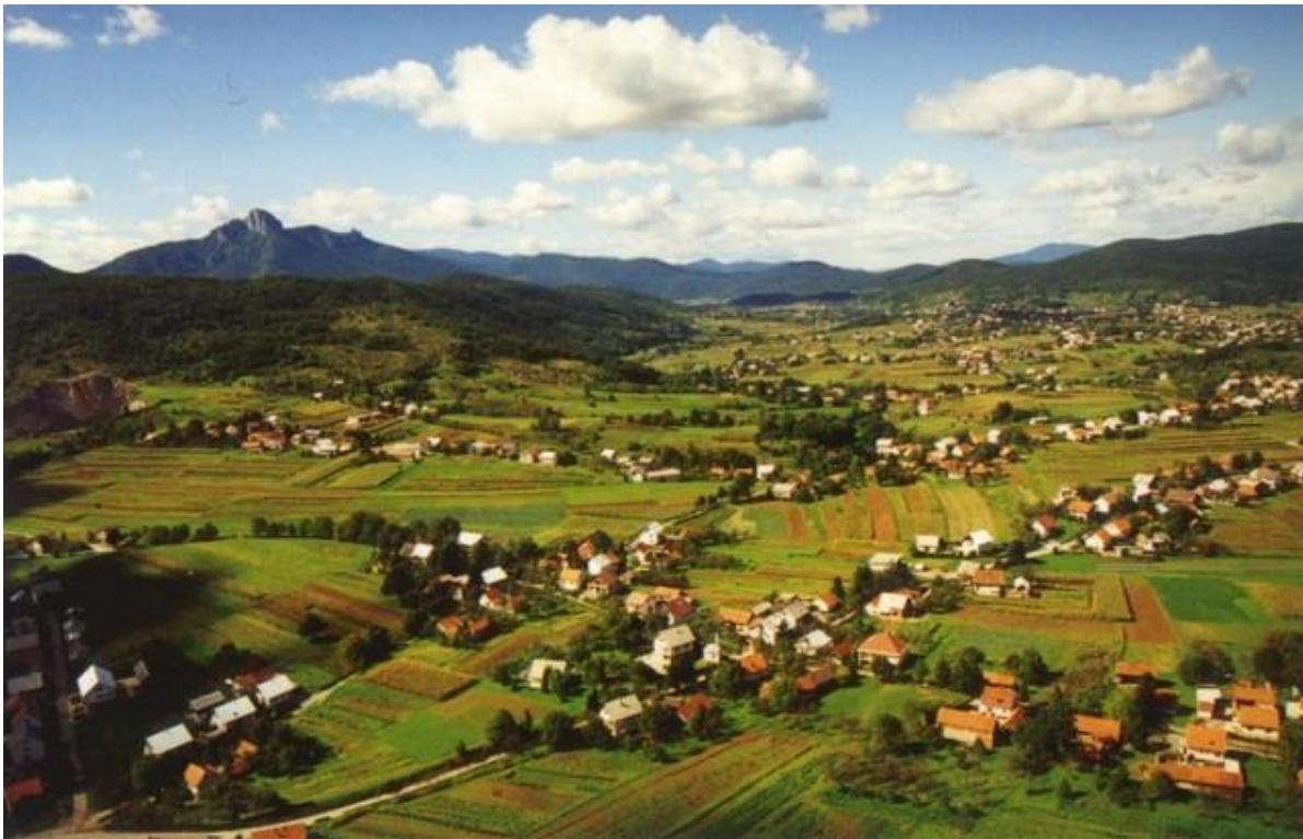
Slika 1. Grad Ogulin