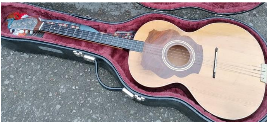
Slika 13. Kontra

Jedini je instrument koji u tamburaškom sastavu svira akordsku pratnju kontra ( Slika 13. ). To je instrument koji oblikom liči na E-basprim, ali je malo veći od njega. Ovaj instrument najčešće svira na nenaglašeni dio takta te se pomoću njega sviraju oni akordi koji se u partituri obilježavaju svim tonovima jednog akorda ili samo prvim tonom i nazivom akorda iznad tog tona. Postoji i E-kontra koja je nešto veća od E-basprima te ima pet žica od kojih su prve dvije jednake. Postoji i A-kontra koja ima samo četiri žice.