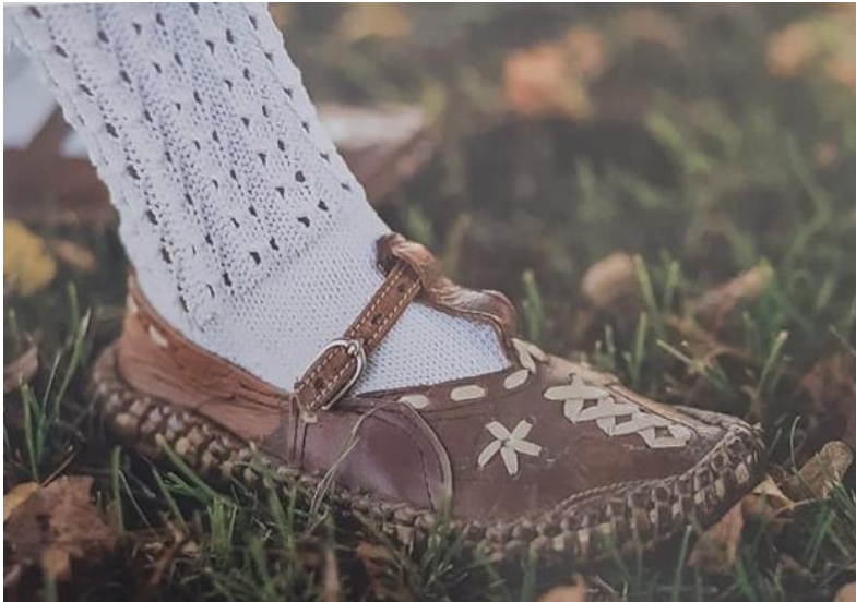
Slika 10. Ženska obuća