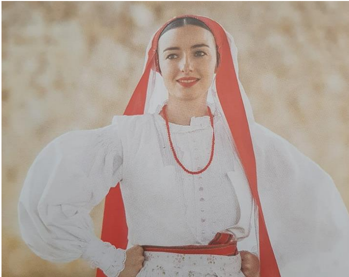
Slika 7. Djevojačko oglavlje i nakit