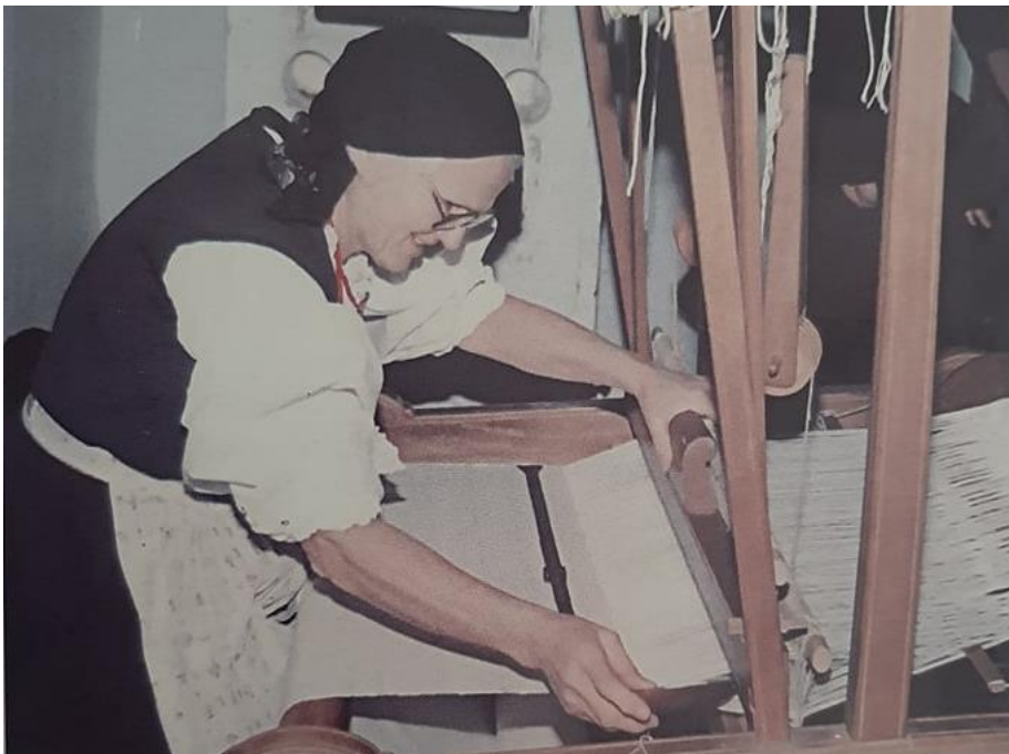
Slika 3. Tkanje

Nakon poslijeratnog razdoblja dolazi do promjena u načinu života te prelaska s poljoprivrede u industrijski proizvodni sektor što dovodi do promjena u životima ljudi toga kraja. Time selo gubi svoja ruralna obilježja te se priključuje urbanom dijelu Ogulina. Usporedno s takvim promjenama nošnja dvadesetog stoljeća polagano izlazi iz uporabe. Dvadesetih godina 20. stoljeća raspale su se obiteljske zadruge što je dovelo do smanjenja proizvodnje lana i konoplje, a samim time i domaće tkanog platna pa je i materijal za proizvodnju odjeće postao drugačiji (Luketić Delija, 2018).