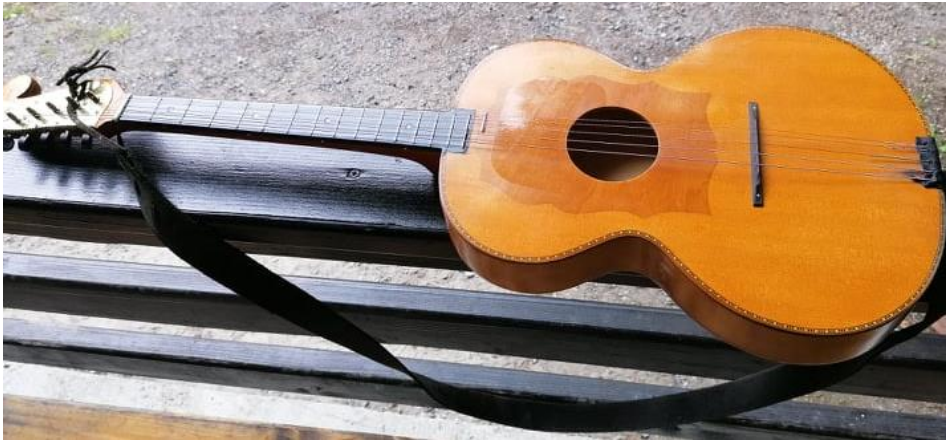
Slika 12. Basprim

i napisano. Također, u orkestru se koristi i E-basprim koji je oblikom sličan A-basprimu, ali je veći od njega. Isto ima pet žica od kojih su prve dvije jednake. U orkestru se upotrebljava samo jedan E-basprim, a u nekim ih većim orkestrima ima i više. Dionice se u partituri pišu u violinskom ključu te zvuče onako kako je i napisano.