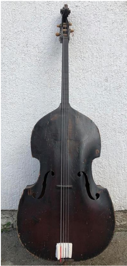
Slika 15. Bas