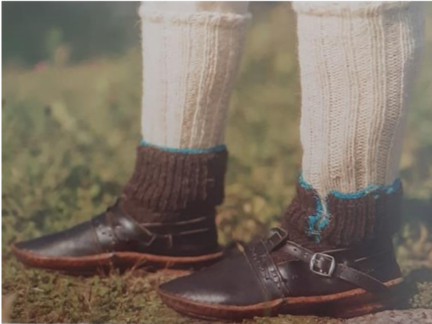
Slika 9. Muška obuća