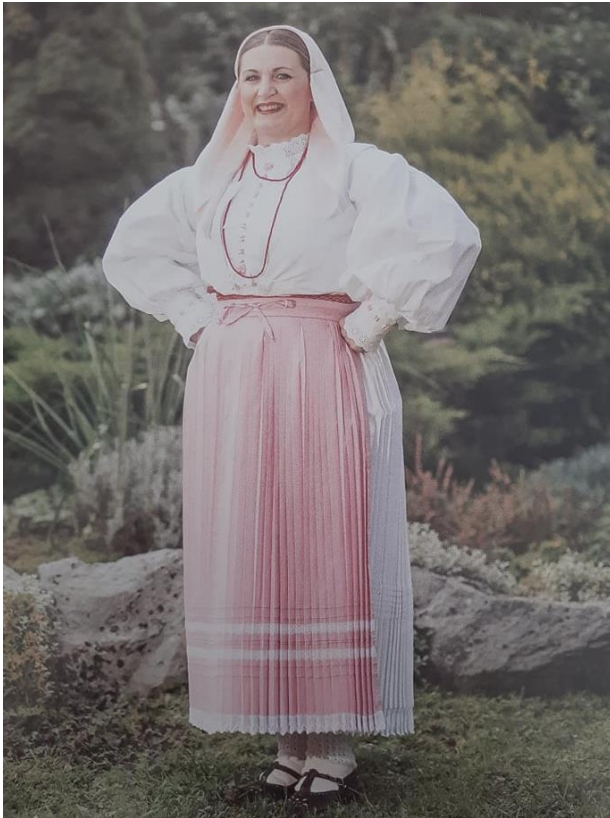
Slika 4. Ženska narodna nošnja