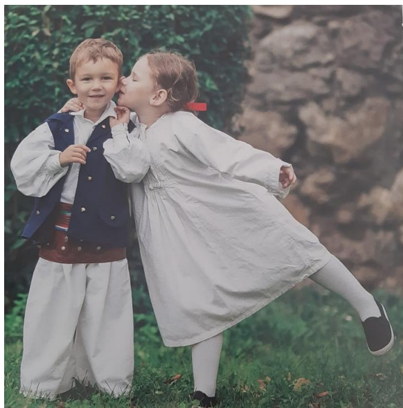
Slika 6. Dječja narodna nošnja

Za razliku od muške i ženske tradicijske odjeće, dječja je odjeća bila jednostavna i skromna (Slika 6.). Majke su šivaćim strojem ili na ruke svojoj djeci najčešće šivale stomanje 15 . Njih su nosile djevojčice do šeste ili sedme godine. Stomanja se oko vrata i prsa ukrašavala uskom čipkom koja je bila širine oko 2 cm. Rukavi su bili tričetvrt, ravnog kroja bez nabora i obrubljeni čipkom na krajevima. Dječaci su do treće godine također nosili stomanje, a kasnije su odijevali platnene gaće i košuljicu. Njihova je odjeća bila jednaka beloj robi koju su nosili odrasli muškarci. Djevojčice su u razdoblju od sedam do deset godina na stomanju počele stavljati zaslone koji je imao cvjetne uzorke. Zaslone su šivale majke i to od materijala koji je ostao od šivanja njihovih zaslona. Oni su u struku bili lagano nabrani te su imali usku pasicu s vrpcama koje su se vezale na leđima. Kasnije, u razdoblju od deset ili jedanaest godina, dječaci i djevojčice počinju nositi svakidašnju nošnju kakvu inače nose djevojke i mladići. Na prvoj svetoj pričesti djeca prvi put dobivaju svečanije tradicijsko ruho. Krajem 20. stoljeća dječja nošnja, kao i odrasla, izlazi iz uporabe te ju ponekad oblače još dječaci prilikom primanja sakramenta prve svete pričesti, dok ju djevojčice ne oblače čak ni tada (Luketić Delija, 2018).