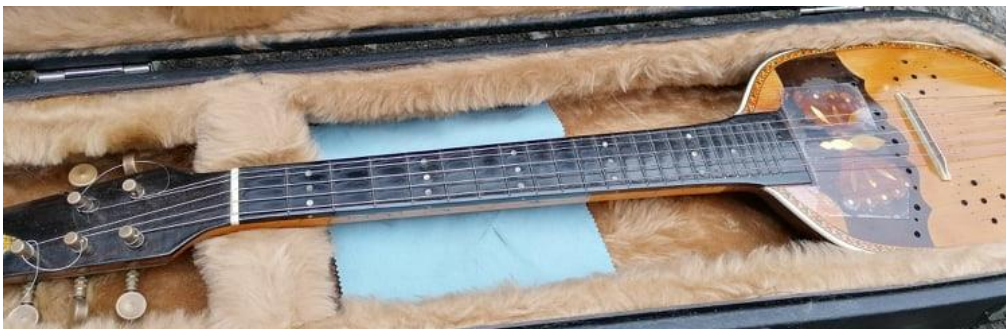
Slika 11. Bisernica

Bisernica ili prim ( Slika 11. ) je prema veličini najmanji instrument u tamburaškom sastavu. Ima pet žica te proizvodi visoke tonove. U tamburaškim se orkestrima koriste dvije do tri bisernice (prva, druga i treća), a u većim se orkestrima upotrebljava i više njih. Dionice se pišu u violinskom ključu, ali se radi lakšeg čitanja note pišu za oktavu niže od onog kako instrument zvuči.