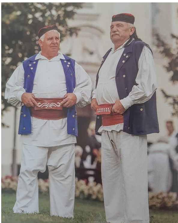
Slika 5. Muška narodna nošnja

Ranije spomenuta platnena košulja , gaće stegnute čemerom 11 , ječerma 12 , opanci kapičari 13 te lička crvenkapa 14 (Lipošćak i Sučić, 2000) samo su neki od dijelova ljetne, odnosno zimske muške svečane nošnje. Čemer, kojim su muškarci opasavali košulju, odražavao je maštovitost i vještinu majstora koji ga je izradio jer se svaka kožna uska vrpca ispreplitala na drugačiji način ( Slika 5. ). Tako nijedan čemer u ogulinskom kraju nije identičan. Na čemeru se Ogulinaca najčešće nalazio motiv obrisa Kleka na koji su bili iznimno ponosni te hrvatska šahovnica s natpisom „Bog i Hrvati“ čime su iskazivali ljubav prema zavičaju, domovini i Bogu. Povrh toga muškarci su odijevali ječermu (Luketić Delija, 2018).