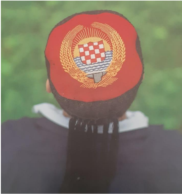
Slika 8. Crvenkapa (lička kapa)