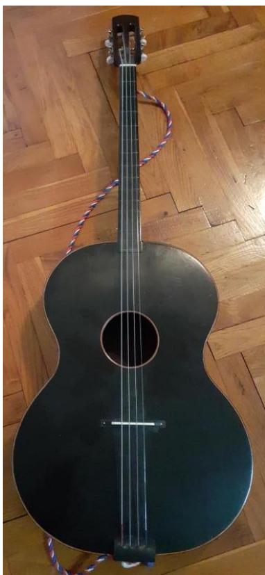
Slika 14. Čelo

Ono što je violončelo u simfonijskom orkestru to je čelo ( Slika 14. ) u tamburaškom. Čelo je oblikom slično kontrii, ali je od nje ipak malo veće. Njegova je posebnost, u odnosu na ostale tamburaške instrumente, u tome što mu je glava slična glavi violončela. Ima četiri žice i raspon tonova od FIS do h1. Dionice se čela u partituri pišu u bas ključu i zvuče onako kako su i napisane. Kada su tamburaški orkestri veći mogu se koristiti i stojeća čela koja su slična basu, ali su od njega malo manja.