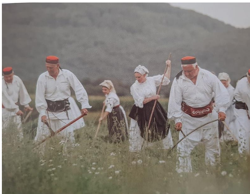
Slika 2. Žene i muškarci na polju

Narodni se običaji ogulinskog kraja temelje na tradicijskom životu seljana kojima su glavne djelatnosti bile poljoprivreda i tekstilno rukotvorstvo. Proizvodnja platna, uzgoj lana i konoplje poslovi su koji vuku korijene iz stare slavenske baštine te su bili osnova tekstilnog rukotvorstva. Konoplja se sijala u proljeće, a brala ljeti, dok se lan sijao u jesen, a brao u proljeće ili ljeto. Nakon postupka omekšavanja vanjskog dijela stabljike, stari su Ogulinci za daljnju obradu upotrebljavali alat poput tukače 1 i trlice 2 koji je olakšavao provlačenje stabljike kroz drveni češalj te se tako dobila iščešljana pređa koja se mogla presti. Prelo se pomoću preslice i vretena. Za tkanje su se, osim lana i konopljine pređe, upotrebljavale kupovna pamučna vuna i kupovna pređa. (Slika 3) Takvo se istkano platno koristilo za izradu pojedinih dijelova muške i ženske nošnje te predmeta poput plahte, jastučnica, stolnjaka i blazina (Eckhel, 1986). Slika 2. prikazuje žene i muškarce u narodnim nošnjama na polju.