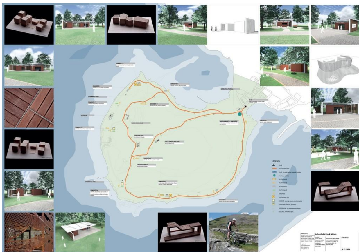
Slika 4. Projekt „Arheološki park Vižula“