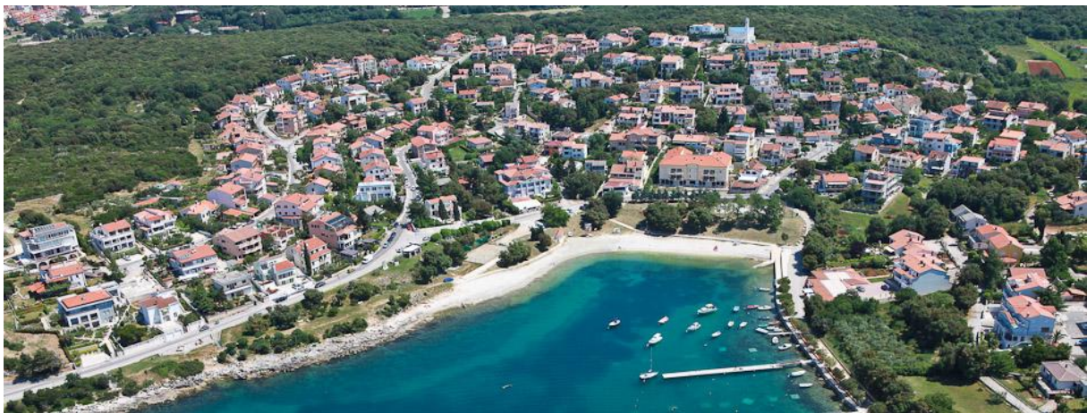
Slika 2. Narušavanje reljefa Pješćane uvale