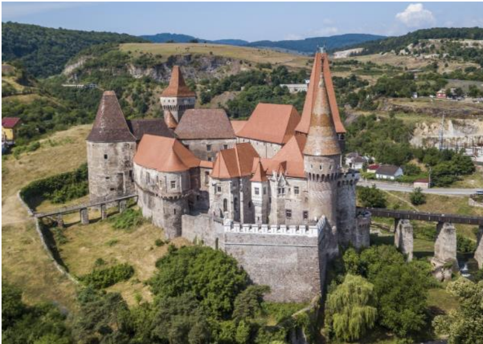
Slika 8: Dvorac Corvin