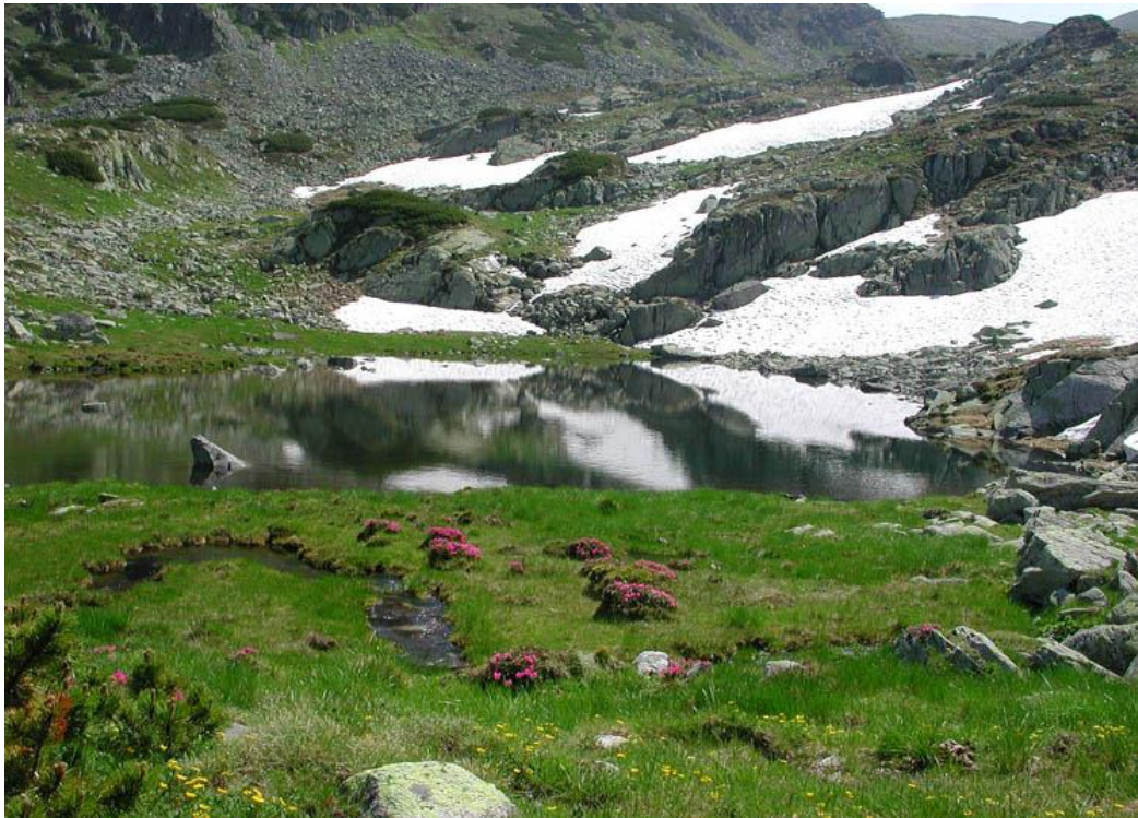
Slika 4: Ledenjačko jezero u Ratezatu