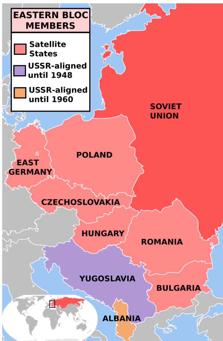
Slika 1: Karta zemalja Istočnog bloka