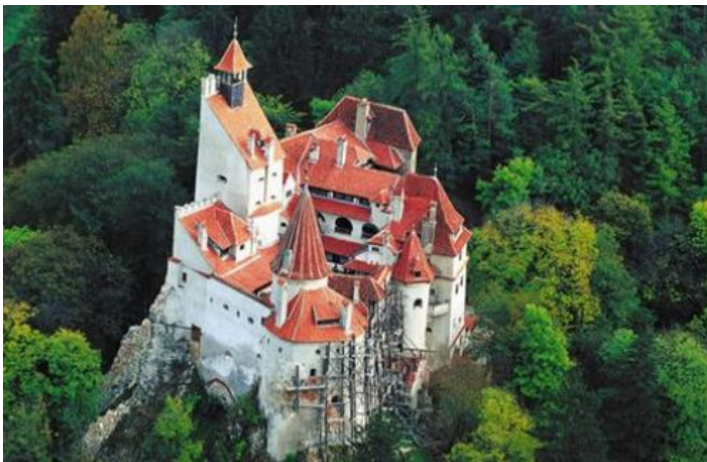
Slika 7: Dvorac Bran