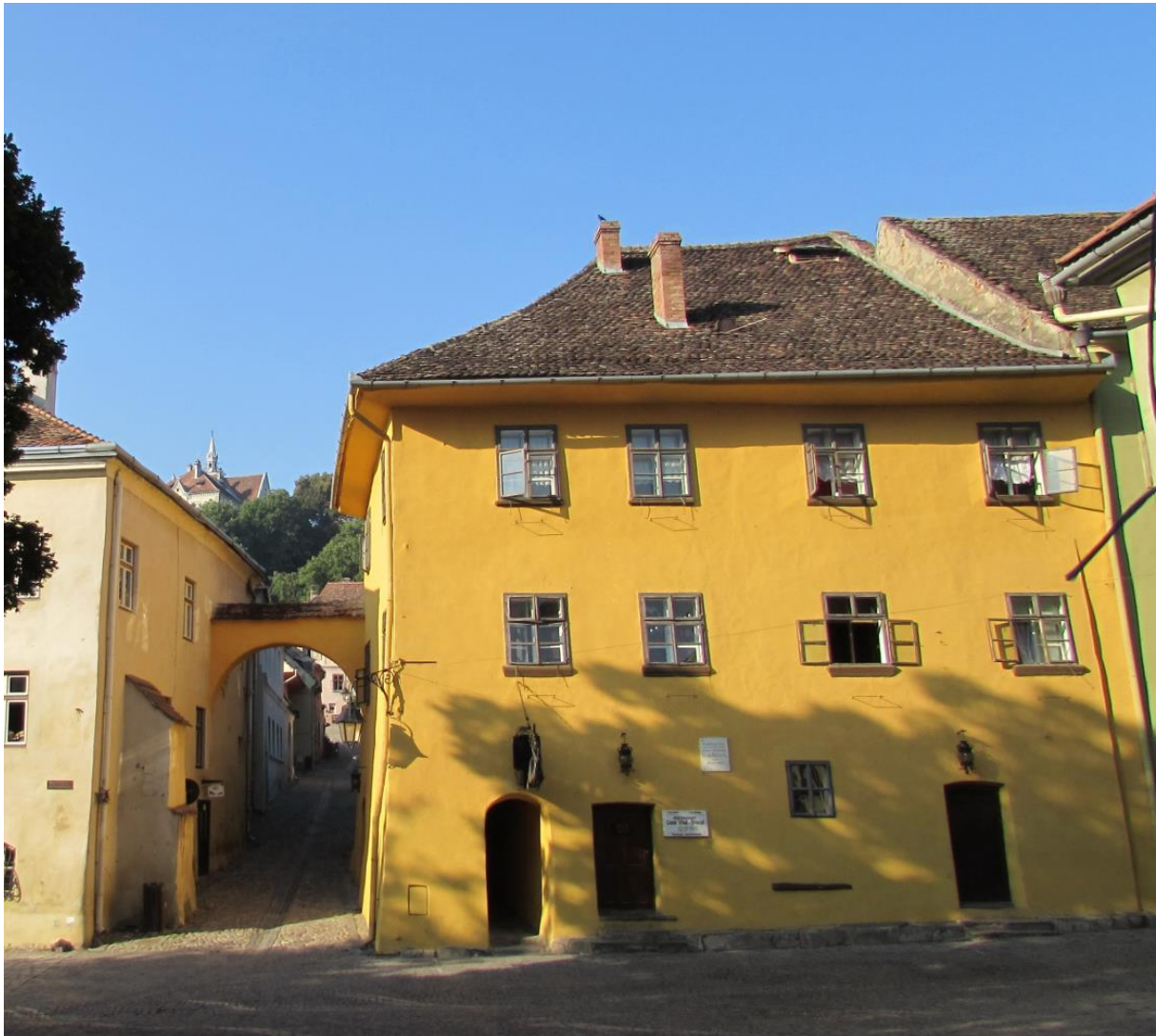
Slika 12: Rodna kuća Vlada III.