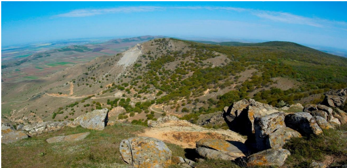
Slika 3: Planine Măcin