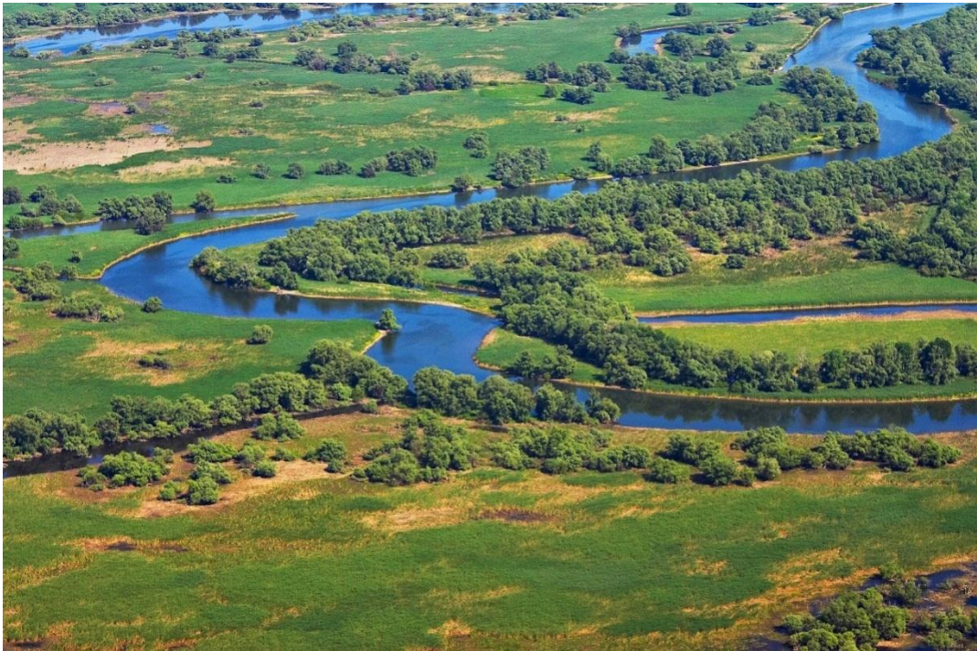
Slika 2: Delta Dunava