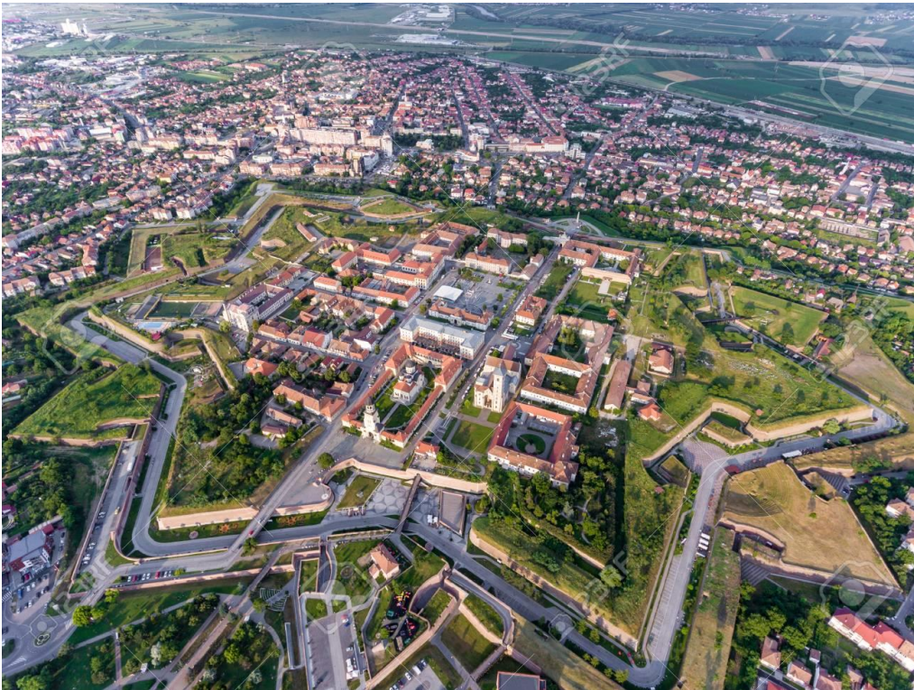
Slika 9: Alba Iulia i Alba Carolina iz zraka