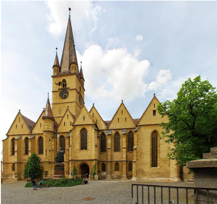
Slika 10: Luteranska katedrala

Trg Huet treći je od tri glavna trga Sibiu. Njegova najistaknutija značajka je evangelička luteranska katedrala (sl. 10) u njegovom središtu. To je mjesto na kojem su sagrađene najranije utvrde u kasnom 12. ili početkom 13. stoljeća. Zgrade oko ovog trga uglavnom su gotičke. Na zapadnoj strani nalazi se Brukenthal Highschool, umjesto nekadašnje škole iz 14. stoljeća.