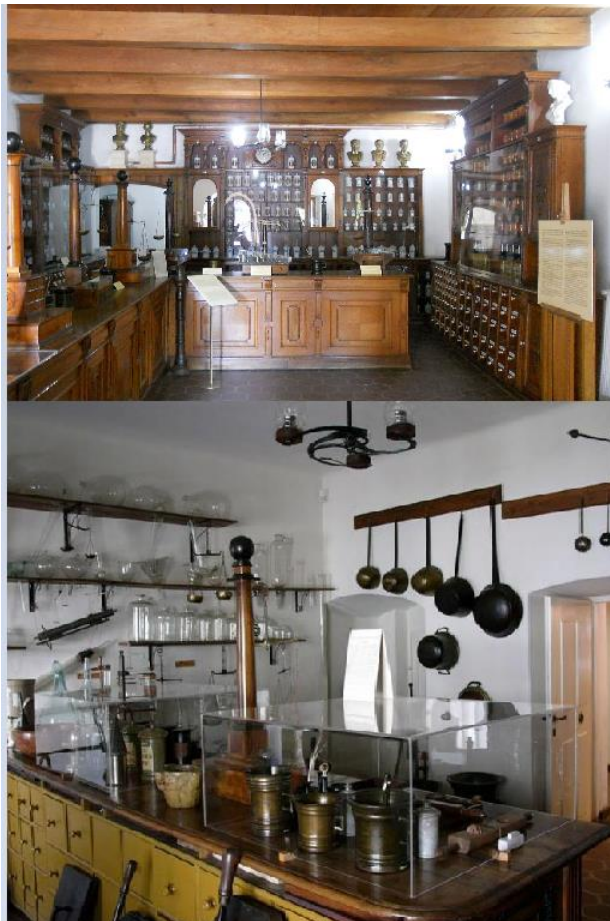
Slika 11: Pult galerije (gore) i laboratorij (dolje)