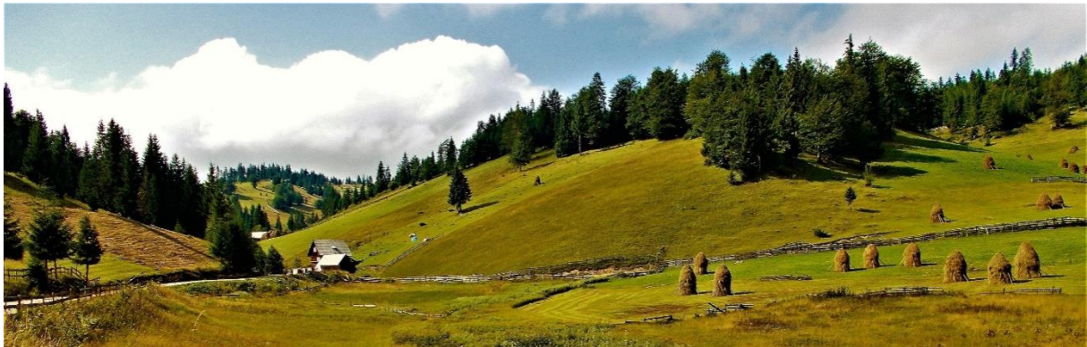
Slika 5: Apuseni brežuljci