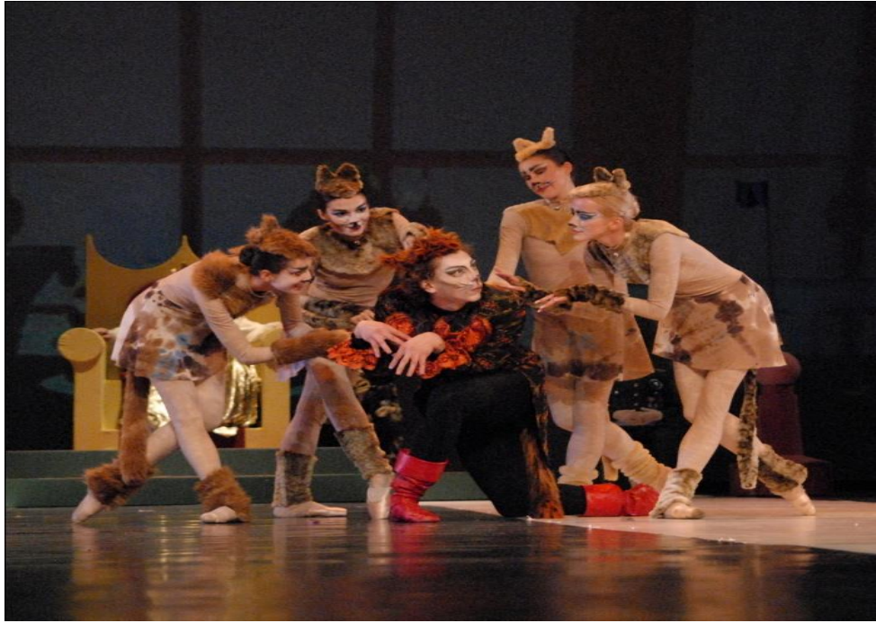
8. Scena iz baleta Mačak u čizmama