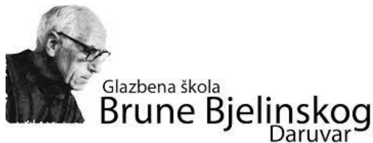
9. Logo Glazbene škole Brune Bjelinskog Daruvar

Djelovanje Brune Bjelinskog nije ostalo bez traga u hrvatskom glazbenom školstvu. Jedina glazbena škola u Hrvatskoj koja nosi njegovo ime nalazi se u Daruvaru te je ujedno ista škola koju sam i sama pohađala. Iz te glazbene škole izašlo je mnogo uspješnih mladih glazbenika, koji čuvaju vrijednosti iznimnog skladatelja i njegov pedagoški rad, uvažavajući njegov opus, izgrađuju svoj stil i vlastiti put glazbenih ideja.