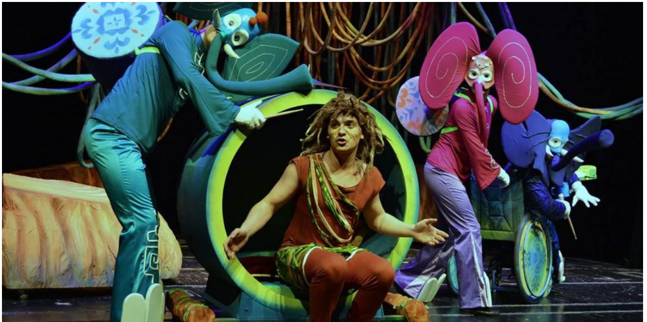
5. Scena iz lutkarske predstave Knjiga o džungli

Mowgli susreće razna stvorenja koja nemaju baš uvijek najbolje namjere, poput pitona Kaa čiji glas i pogled hipnotiziraju ili pak slatkorječivog Kralja Louia koji želi saznati tajnu nedostižnog i smrtonosnog crvenog cvijeta - vatre. No, uz pomoć svojih prijatelja i ponekog "ljudskog trika", Mowgli će se hrabro suočiti sa svim izazovima i uspješno se suprotstaviti kralju džungle.“(Ferenčić, 2016:1-2).