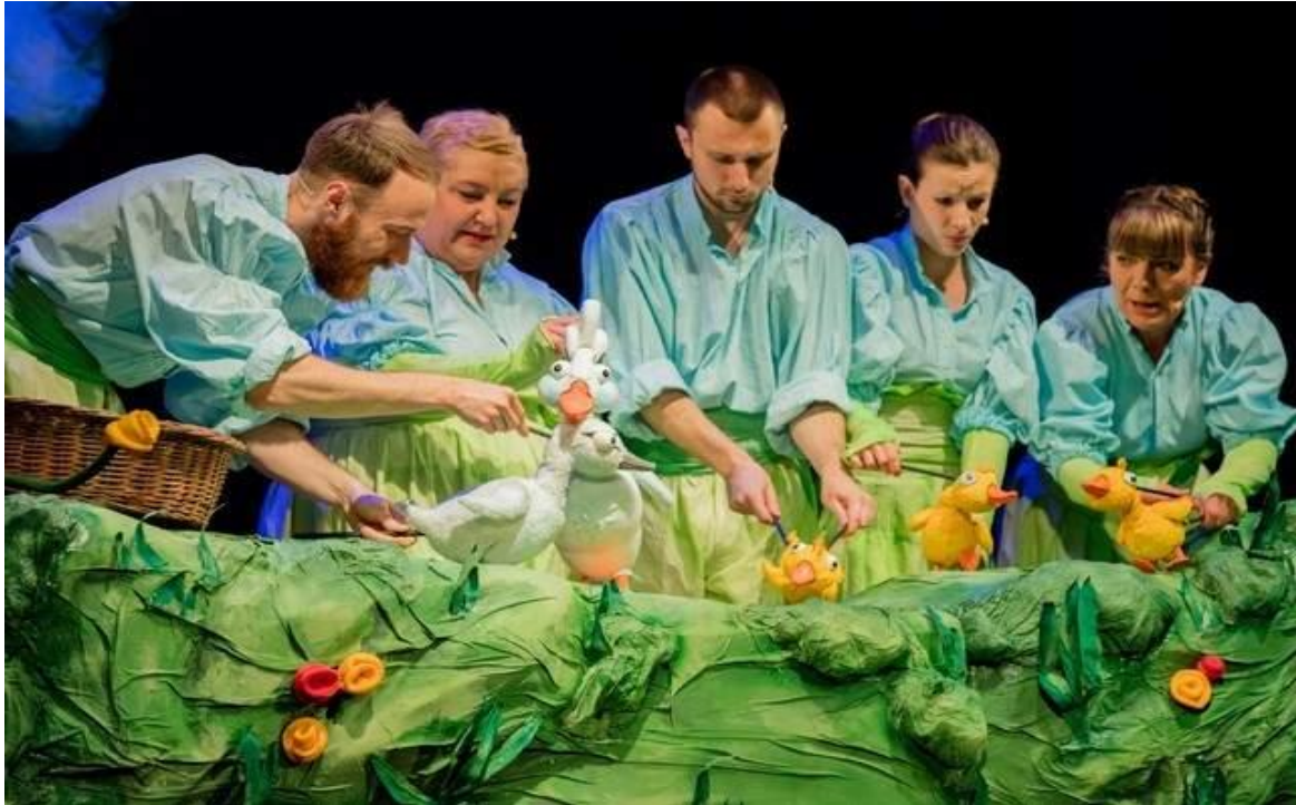
4. Scena iz lutkarske predstave Ružno pače