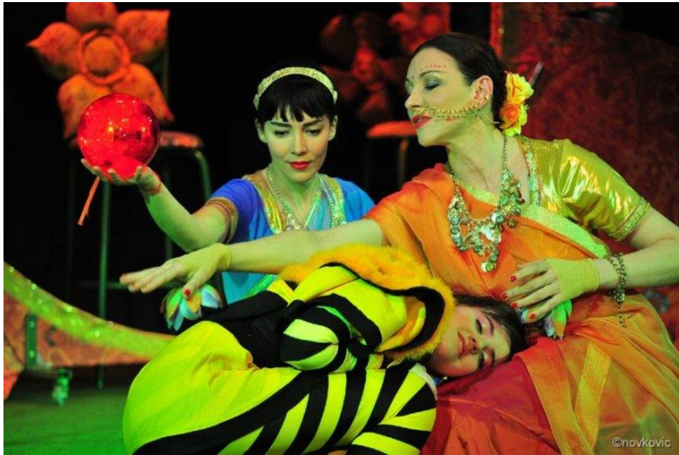
3. Scena iz operne priče Pčelica Maja

„Da bi operna priča i u radio-izvedbi došla do punog izražaja, autori su predvidjeli za tu priliku konferansijera, čija je zadaća da riječima opiše situacije na pozornici, koje se ne mogu vidjeti. Treba spomenuti, da opera obiluje mnogim relativno kratkim ulogama, koje predstavljaju pojedine kukce. Zbog toga je Bjelinski partituru tako sastavio, da sve tenorske uloge može pjevati isti pjevač, sve baritonske drugi i sl. Na taj način, naročito za izvedbu na radiju, nije potreban veći vokalni aparat.“ (Kovačević, 1966:72).