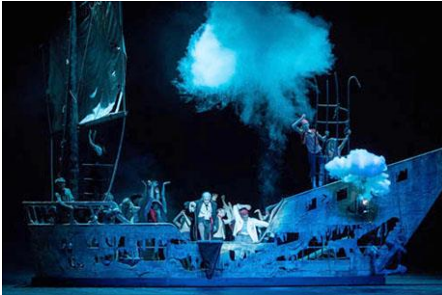
7. Scena iz baleta Peter Pan

kao pobjednik. Djeca s početka priče vraćaju se kući, a zajedno s njima dolaze i izgubljena djeca iz Nigdjezemske. Majka s radošću dočekuje vlastitu djecu, ali prihvaća i izgubljene dječake.