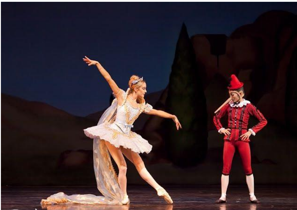
6. Scena iz baleta Pinocchio

„Pinocchio nije pravi dječak, ali nije ni običan lutak. Kada Plava vila oživi drvenog lutka, za Gepetta i Pinocchija započinje pustolovina u kojoj će Gepetto morati preispitati što znači biti otac, a Pinocchio naučiti što znači biti pravi čovjek. Ova priča ostaje jedan od najljepših klasika o odrastanju, relevantan i u današnje doba jer podsjeća roditelje da ugađanje djeci nije najbolji pedagoški pristup, a djecu uči altruizmu i odgovornosti te nužnosti da otrpe dobronamjerne zabrane, „dosadnu“ nastavu i druge obveze. Ovaj balet pokazuje kako ljubav i odgovornost prema drugima nisu najlagodniji put, ali su jedini koji vodi do ispunjenog i smislenog postojanja.“ 3