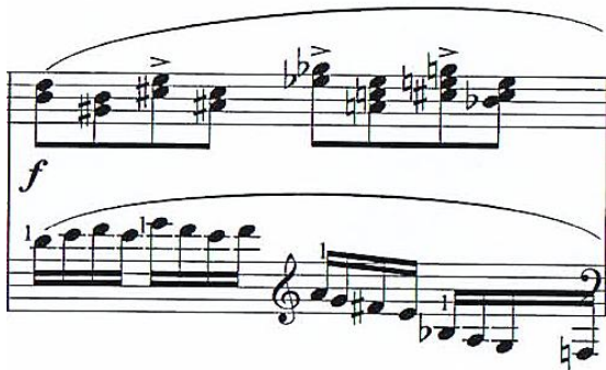
Primjer br. 40 (takt 40)

Skladba se sastoji od šest dijelova koje smo nazvali abecednim redom A, B, C, D, E i F te predstavljaju rad s motivom.