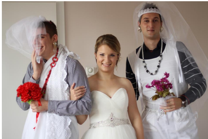
Slika 6: „Lažna mlada“

prije mlade izvedu dvije ili tri djevojke, koje se nazivaju „lažne mlade“ (sl. 6.), a slijedi ih sama mladenka, za koju djever ili kum daju dogovoreni iznos novca. Taj običaj i danas nalazimo na vjenčanjima. 10