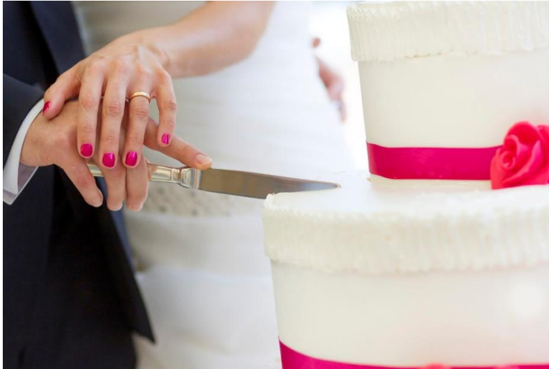
Slika 8: Rezanje mladenačke torte

se i pričekati dva, tri dana. Posjetitelji donose mladenkinim roditeljima ili svim članovima obitelji poklone, uglavnom pića ili hranu (npr. slatku rakiju, tortu, pečenku). 12