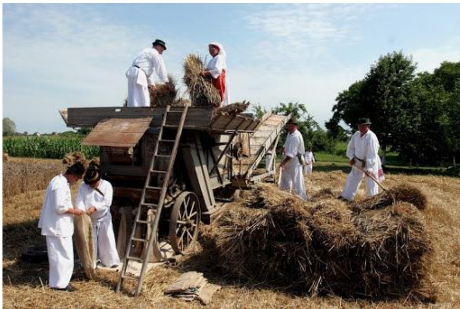
Slika 3: Žetva i vršidba

Izvor: https://lh3.googleusercontent.com/proxy/MasRVpAiO1dWTPVg5Xn-f2ZyldggIjrxFBI6AoaVqKXSOyqCjquSX9nfAkecvpiLC76ywlnkWS7qzjk1_jpc-Zmuqyi8onKjOSFprPrHhEktAKex4_2m2YgnFJOhn8qApOAXb6-Zu3J , 28. svibnja 2020.