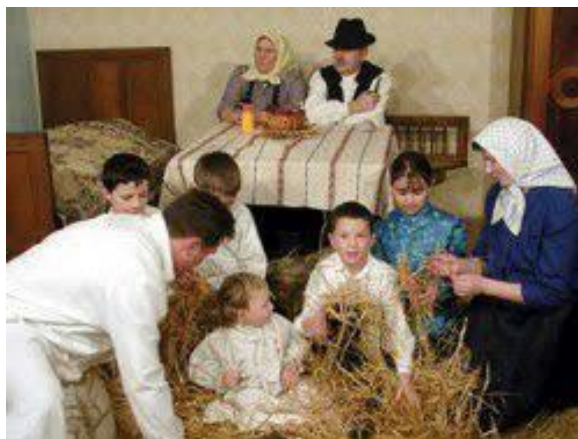
Slika 9: Prostiranje slame na Badnjak

zoru, kako bi svi poslovi u kući bili završeni do večernjeg crkvenog zvona, nakog kojeg domaćin kuće poziva sve na objed. U prostoriji u kojoj se objeduje ranije je rasprostranjena slama (sl. 9.). Također, postoji običaj da se na Badnjak daruje prvo muško dijete. U zoru dječaci obilaze susjedne kuće i selo u tzv. „položaj“. Koji od njih poželi domaćinu najviše obilje u novoj godini tom se daje najveća kobasica i slatkiši. Prije večernje mise, tijekom večeri, cijela obitelj se zajedno moli. 14