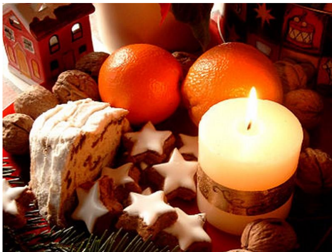
Slika 10: Voće i deserti na božićnom stolu

vino i druga pića (sl. 10.). Mrvice s božićnog stola se ne bacaju, već se spaljuju ili čuvaju, kako bi bile blagoslov i snaga u teškim vremenima. Nakon ručka ide se čestitati rodbini, prijateljima i ostalim ljudima u selu. Mladići često djevojkama daju ono što se naziva tradicionalnom „božićnicom“, odnosno ukrašenu jabuku. Drugog dana blagdana Božića, dana Svetog Stjepana, bilo je više prilika za susrete mladih jer započinje društveni zimski život sela, posebice s plesnim zabavama. Na blagdan Sveta tri kralja iznosi se slama iz kuće. Sveta tri kralja također su posljednji dan božićnog ciklusa te je taj dan uobičajeno datum blagoslova blaga i kuće. Ljudi su na taj dan odlazili u crkvu te blagoslovili vodu koju su kasnije davali blagu, a s njom su blagoslovili polja i kuću. Tog dana ukrasi su uklonjeni s božićnog drvca i izneseni iz kuće. 15