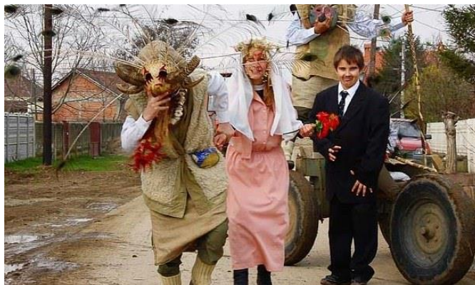
Slika 1: Tradicionalne poklade