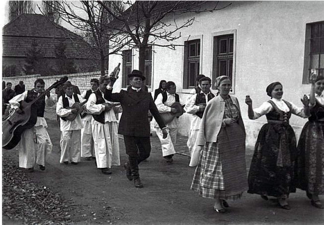
Slika 5: Tradicionalne zaruke

slijedi organizacija i priprema vjenčanja. To je prilika za oživljavanje starih i novih običaja, prigoda za gostoprimstvo, užitak, zabavu i ples. 8