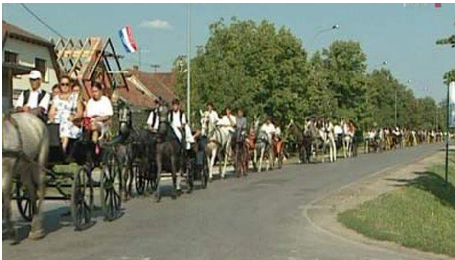
Slika 7: Povorka u kolima na putu prema crkvi

mladoženjom i njegovom obitelji, a danas nastavljaju mladenka i mladoženja živjeti sami i osnivaju vlastite obitelji. Nakon vjenčanja putuju zajedno na „medeni mjesec“. 11