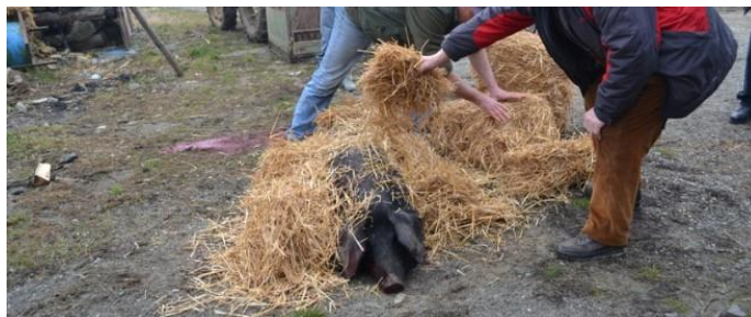
Slika 2: Tradicionalno kolinje

Izvor: https://i0.wp.com/Narodni.NET/wp-content/uploads/2014/01/Tradicionalno-slavonsko-kolinje-i-slavonski-obi%C4%8Daji.jpg?fit=659%2C271&ssl=1 , 26. svibnja 2020.