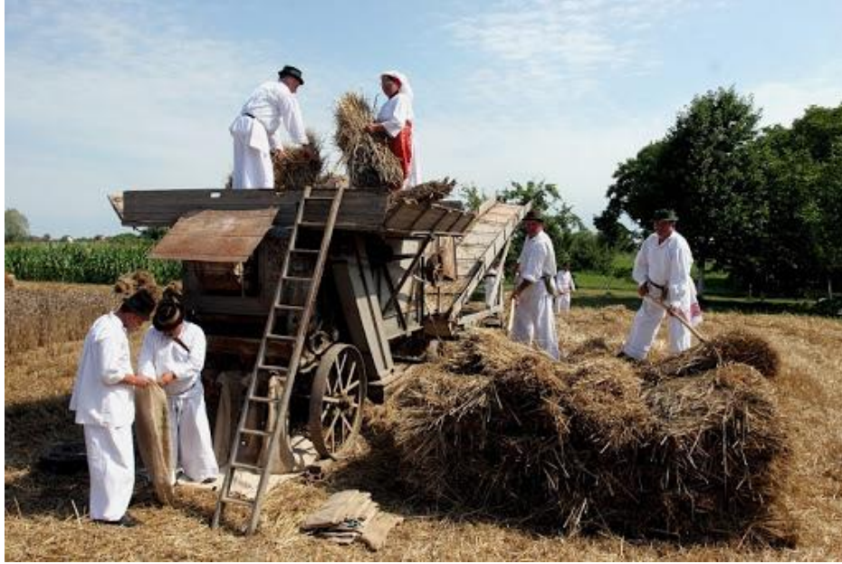
Slika 3: Žetva i vršidba