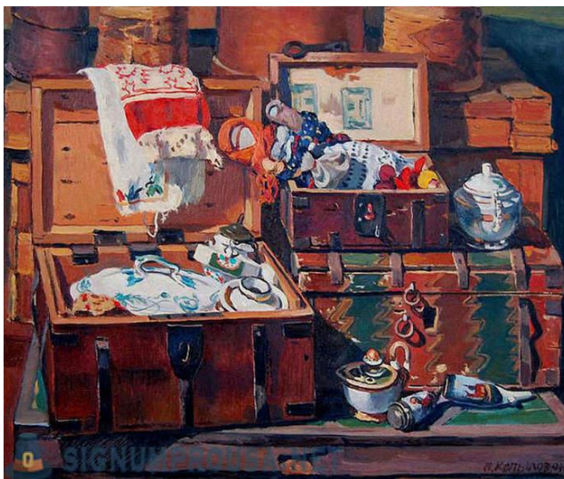
Slika 4: Mladenkin miraz

sobom. Uz jabuke, novac i prsten koje djevojka prima kod zaruka, također dobiva i druge darove kao što su korisni i dekorativni tekstil, nakit i često jela ili kolače. 7