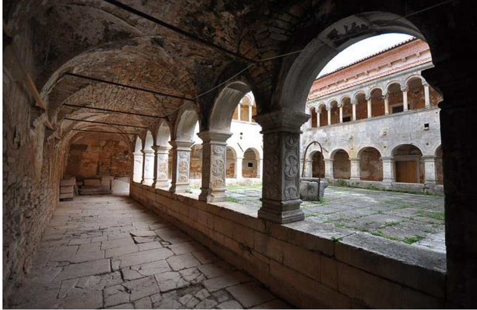
Slika 4. Klaustar samostana u Sv. Petru u Šumi