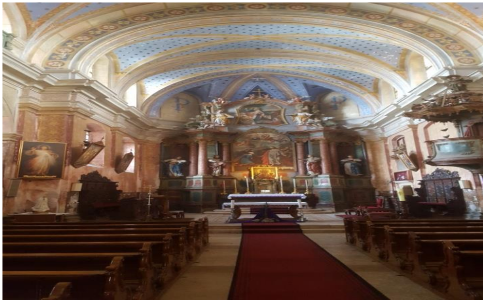
Slika 5. Unutrašnjost crkve Sv. Petra u Šumi