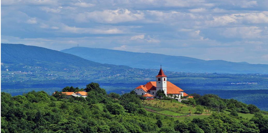
Slika 3. Samostan i crkva u Sveticama