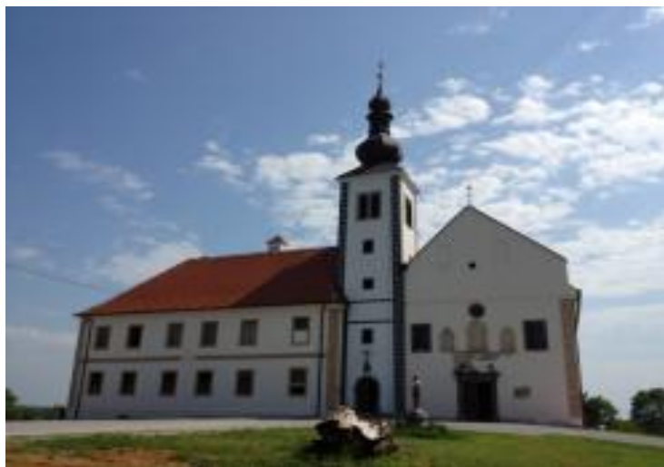
Slika 2. Crkva i samostan u Kamenskom