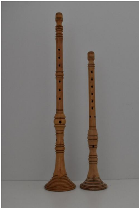
Slika 4. Velika i mala roženica