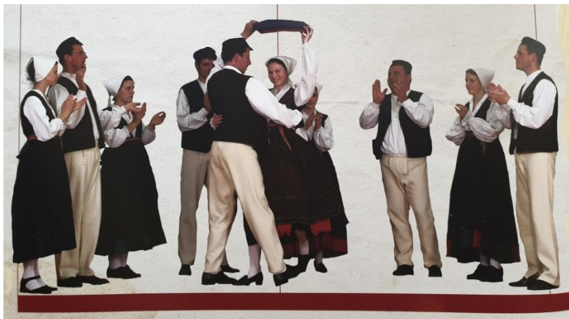
Slika 10. Prikaz otvorenog kruga s parom u sredini