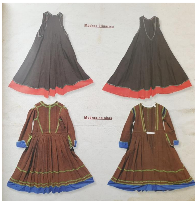
Slika 12. Moderna klinarica i modrna na skas