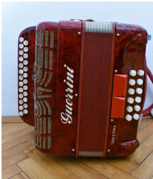
Slika 8. Armonika trieština