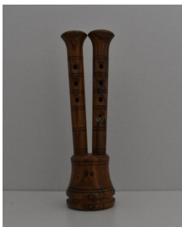
Slika 3. Šurle