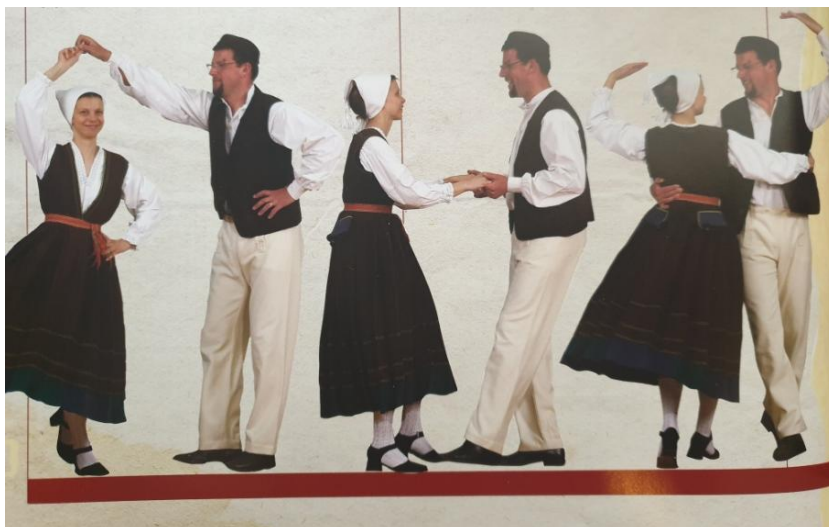
Slika 9. Prikaz figura preslica, kančenica i valcanje

Ples započinje figurom „okolo hoditi“ na znak „osan dan“ koji izgovara vođa plesa, takozvani capoballo. Mladić drži djevojku desnom rukom oko struka, a lijeva mu je savijena u laktu i postavljena o bok. Djevojka svojom lijevom rukom drži mladića za rame, dok desnu ruku drži savijenu o bok. Zatim slijede dijelovi figure prebiranja, u što ubrajamo preslicu – mladić drži djevojčinu lijevu ruku dok se ona okreće ispod njegove ruke. Poslije preslice parovi idu korakom prebiranja po krugu dok se ne začuje udarac vođe nogom o pod, tada se hvataju za ruke i plešu u kolu. Takvo kolo gdje se parovi drže za ruke naziva se veće kolo, dok kasnije slijedi malo kolo gdje se mladići drže rukama oko ramena, a djevojke njima oko struka. Kančenica je figura prebiranja u kojoj se parovi drže za ruke okrenuti licem jedan prema drugome, mladić je leđima okrenut sredini kruga. Figura valcanja izvodi se na mjestu, tako da su partneri okrenuti svatko na svoju stranu i jedan drugoga drže desnom rukom ispod lijevog pazuha.