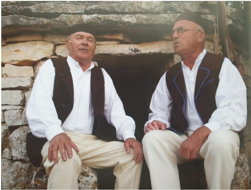
Slika 13. Muška narodna nošnja