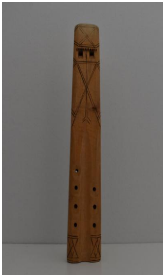
Slika 2. Duplice