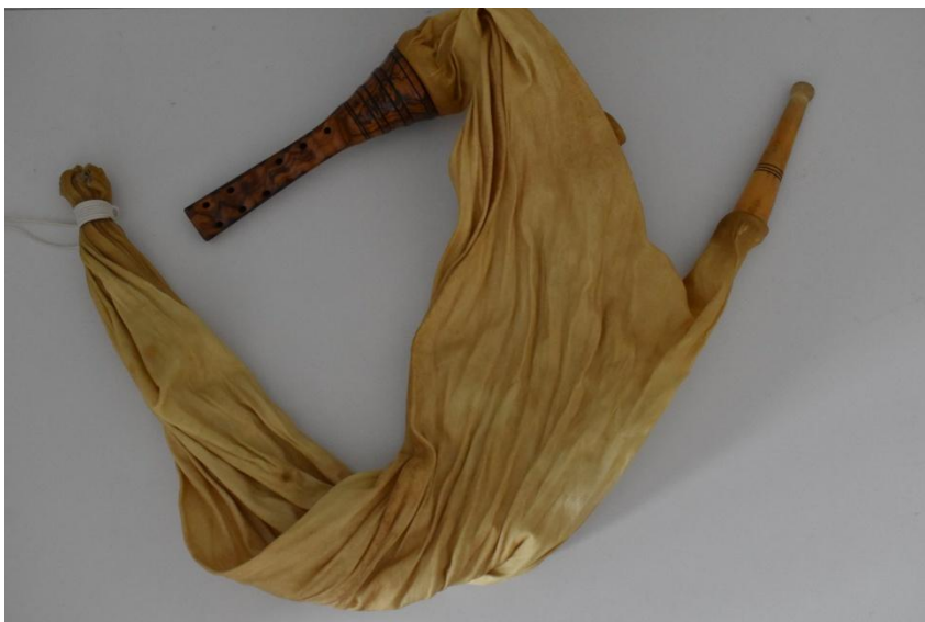
Slika 1. Ispuhani mih