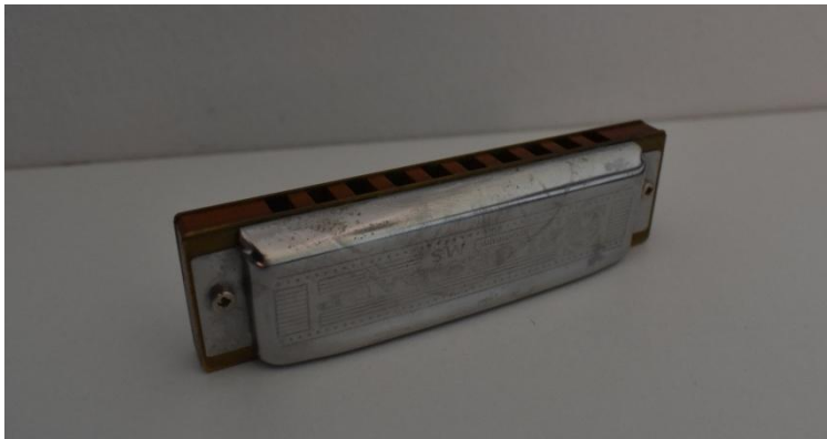
Slika 6. Organić