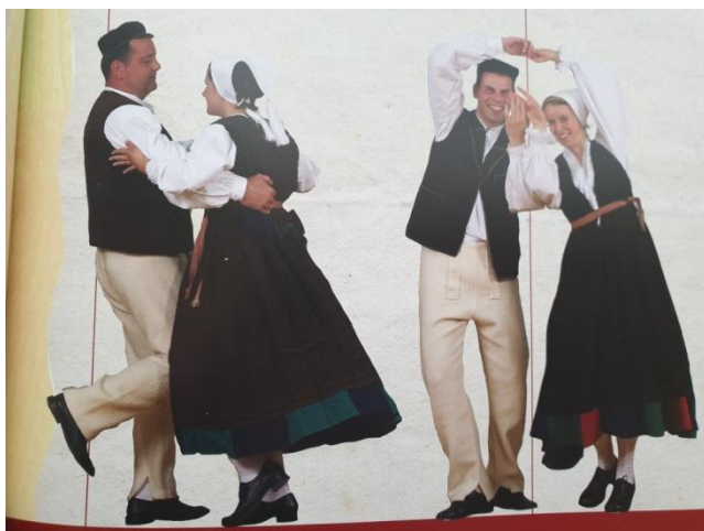
Slika 11. Prikaz okretanja u paru