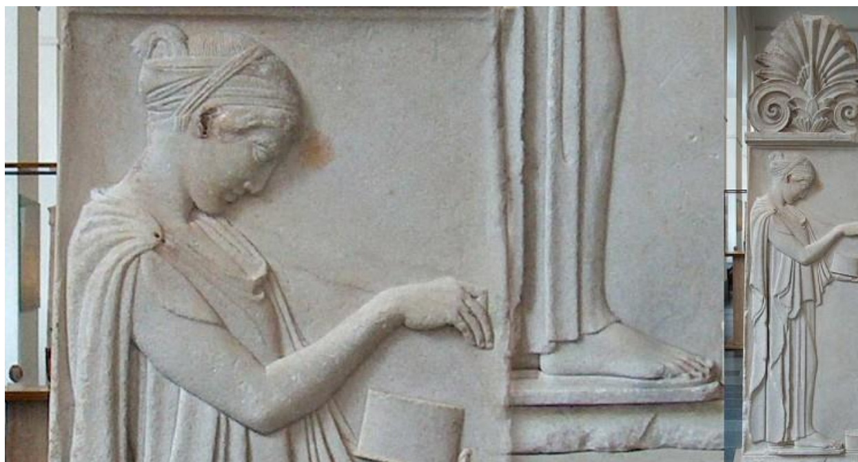
Slika 3. Život Atenjanke

su se školovale. Dječaci su osim škole odlazili i na vježbališta te atletske svečanosti. Kako se djevojčica približavala pubertetu sve izraženije postaje njezino odijevanje, pa tako neudata mlada djevojka ne može obavljati poslove van kuće jer to ne priliči djevojkama u Ateni.