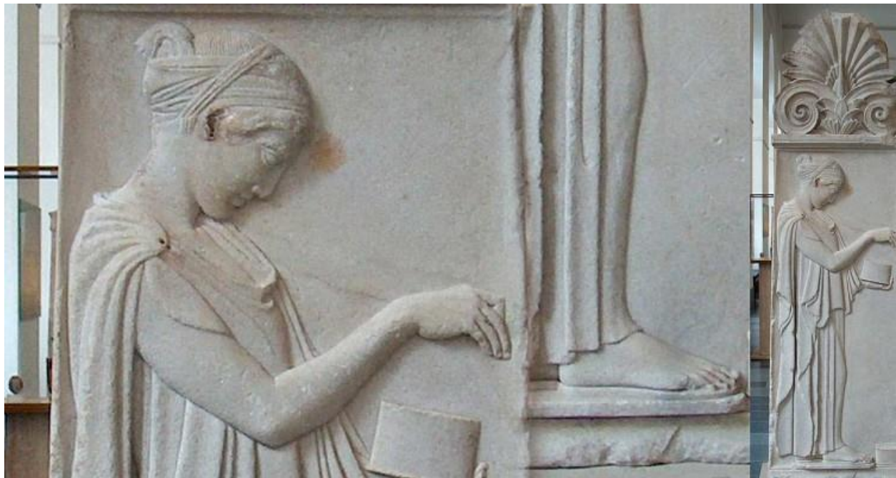
Slika 3. Život Atenjanke

su se školovale. Dječaci su osim škole odlazili i na vježbališta te atletske svečanosti. Kako se djevojčica približavala pubertetu sve izraženije postaje njezino odijevanje, pa tako neudata mlada djevojka ne može obavljati poslove van kuće jer to ne priliči djevojkama u Ateni.