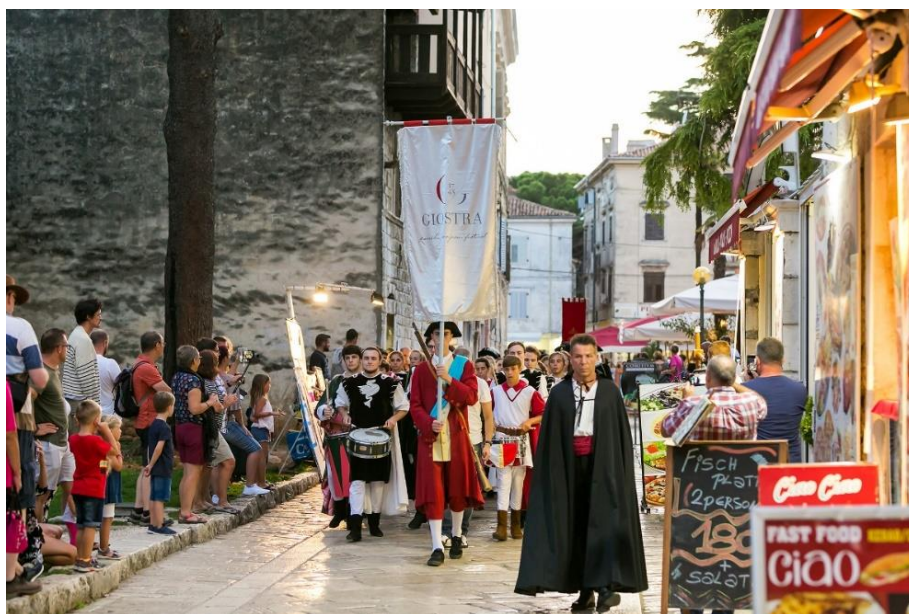
Slika 3. Giostra

Najpoznatija kulturna manifestacija koja predstavlja nematerijalnu baštinu Poreča je Giostra. Povijesni festival Giostra pokrenut je 2007. godine i to kao projekt zaštite nematerijalne kulturne baštine, ali i kao manifestacija koja obogaćuje turističko – kulturnu ponudu Poreča. Manifestacija je nastala u organizaciji Studia 053 iz Poreča, Turističke zajednice Grada Poreča te pod pokroviteljstvom Grada Poreča, a ulogu u osmišljavanju projekta imala je ravnateljica Zavičajnog muzeja Poreštine, Elena Uljančić. Prvi poznati podaci o Giostri datiraju iz 1672. godine kada je 8. svibnja na dan SV. Mihovila u Poreču organizirana svečanost Fiera franca triduana, trodnevni festival s natjecanjima u samostrelu, plesovima i pučkim igrama, a glavni događaj bila je viteška igra Giostra. Dokument u kojem se ova svečanost detaljno opisuje, a na kojem se ujedno i temelji današnja manifestacija, potječe iz 1745. godine. 52