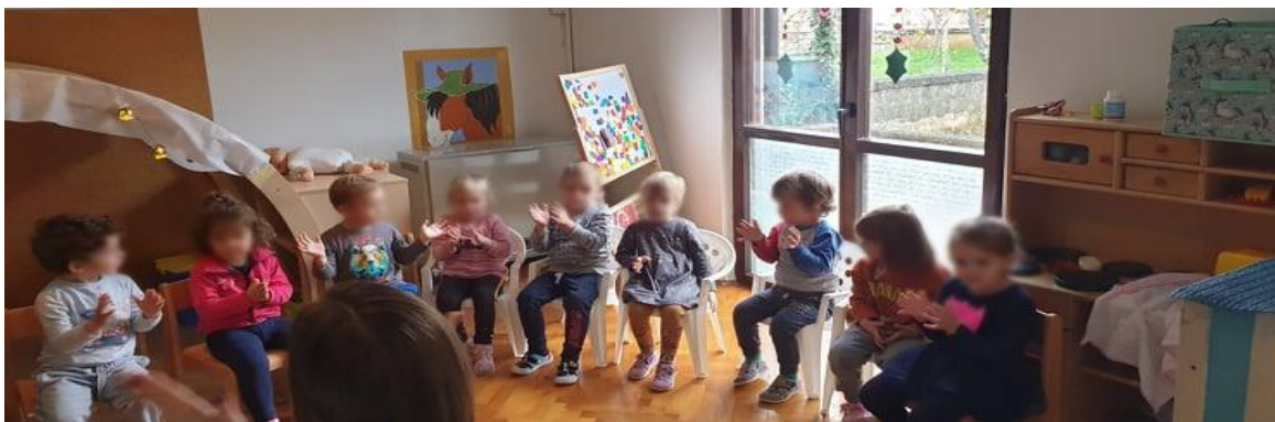
Slika 8. Interpretacija ritma pljeskanjem 42

Sadržaj se obrađivao stih po stih. Prvo bi se pročitao prvi stih nakon čega bi ga djeca ponovila. Stihove su ponavljali više puta uz različitu dinamiku i tempo, a zatim se tekstu dodalo pljeskanje i tiho lupkanje nogama o pod zbog dobivanja osjećaja za ritam.