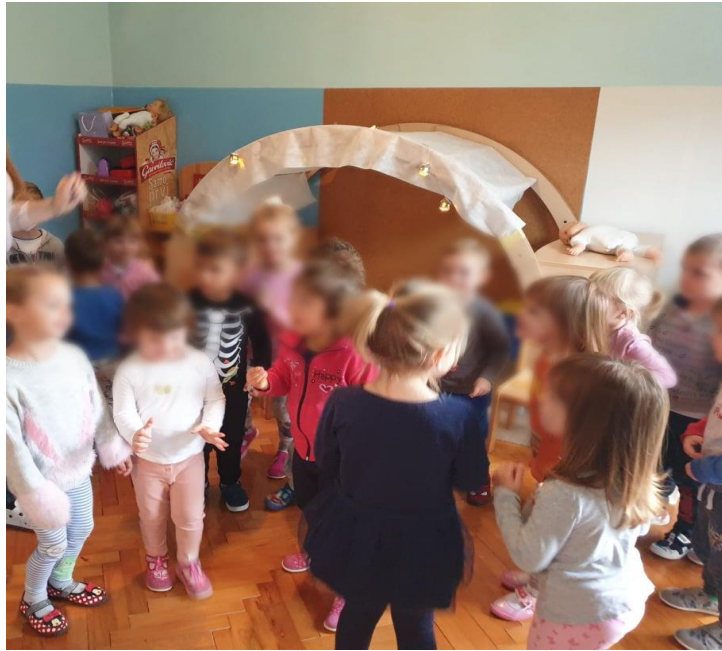
Slika br. 7. Igranje igre „Glazbeni kipovi“ 39

su im pohvale kako su uistinu pravi kipovi. U igri su svi rado sudjelovali i veselili se plesu.