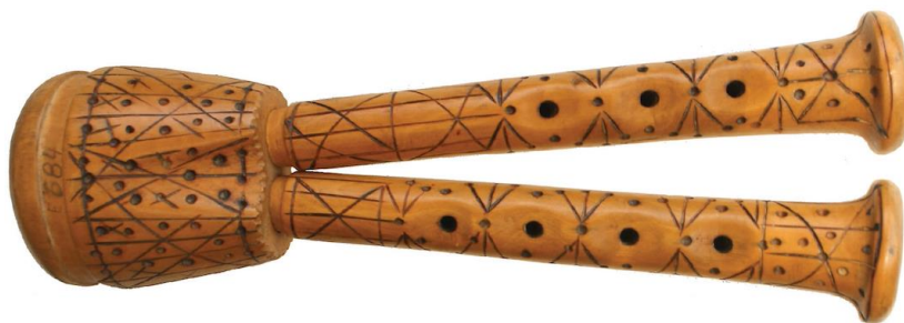
Slika 4. Šurle

Puhaći instrument klarinetskog tipa sličan mišnicama i duplicama, ali prodornijeg zvuka zove se šurle. Za ovo glazbalo mogu se čuti nazivi poput svirale, roženice ili tutule. Šurle su sagrađene od dvije samostalne cijevi i svaka ima zaseban pisak napravljen od trstike. Prebiraljke su spojene u grljak ili did, zaobljeni prstenasti tuljak. Šurle imaju veliku sličnost s duplicama kada govorimo o broju rupica. Desna prebiraljka sastoji se od pet rupica od kojih se jedna nalazi sa stražnje strane, a služi za sviranje palcem. Na lijevoj prebiraljci s prednje strane nalaze se tri rupice. Zbog postojanja utora na grljku dokazano je da su se u prošlosti šurle koristile i kao prebiraljka na mihu. Zbog svojeg zvuka, šurle su se najčešće koristile kao pratnja plesu. 12