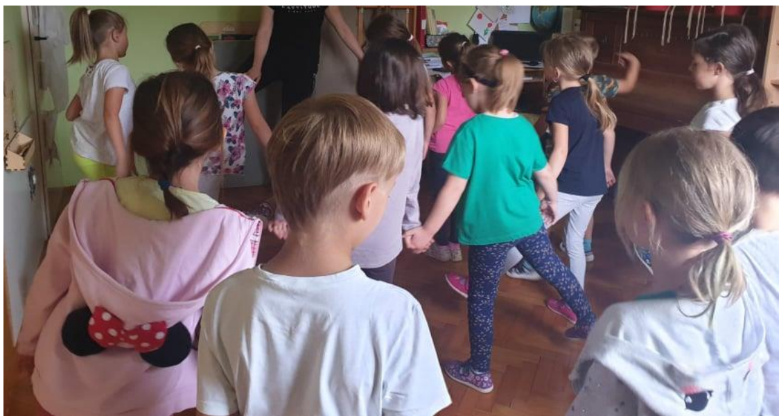
Slika 11. Vježbanje uz sadržaj ritmičkih figura 45

Zamišljena aktivnost započela je po završetku doručka u sobi dnevnog boravka. Djeca su zauzela mjesta po prostoriji nakon čega su uslijedile tjelesne vježbe. Vježbe su sadržavale ritmičke figure s kojima su se djeca kasnije susrela u balunu. Bili su vrlo zainteresirani za vježbanje i trudili se što bolje izvesti ritmičke figure.