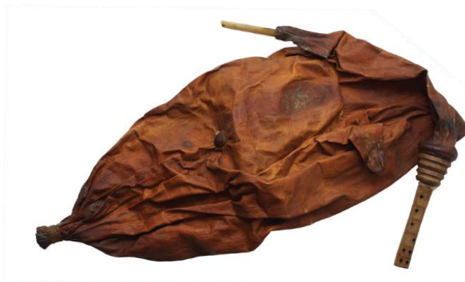
Slika 1. Mih i mišnice

upuhani zrak u mješini pritišće laktom i tako se zrak gura kroz prebiraljku. Prebiraljka ili mišnica je dvocijevno klarinetsko glazbalo koje ima rupice (škuje), a izrađuje se najčešće od šimšira, trešnje, smreke ili maslinova drva. Mišnica ili prebiraljka je napravljena od jednog komada drva s dvije usporedne cijevi koje sadrže rupice. Na lijevoj strani se izbuše tri rupice (škuje), a na desnoj strani pet rupica. Na mišnici se nalazi pisak od trstike koji se pričvrsti za svaku cijev na gornjoj strani svirala. Mišnicu se najčešće koristi kao solističko glazbalo, no često se može susresti u sastavu s roženicama kao pratnja tarankanju. 9