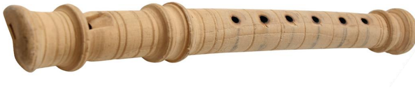
Slika 5. Sopelica

se nalaze s prednje strane. Ovo je glazbalo nekad bilo najrasprostranjenije, a danas se više ne gradi, rijetko se viđa i čuje. Sopelica je vizualna imitacija današnje blokflaute. 13