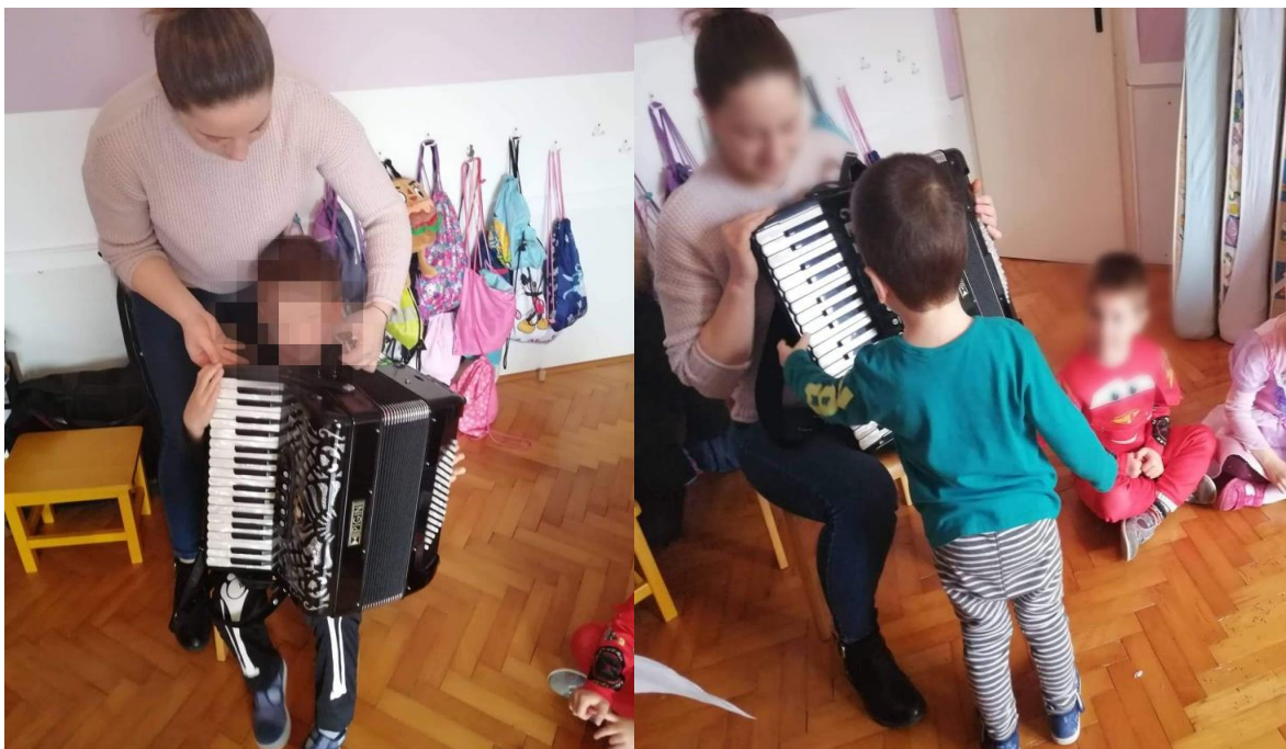
Slika 10. Istraživanje harmonike 44