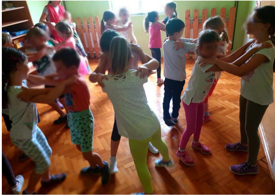
Slika 13. Plesanje plesne figure vrtnja 47

Usvajanjem svih figura djeca su bila sprema za plesanje uz glazbu. Dobila su uputu da će se tijekom reprodukcije glazbe više puta mijenjati figure. Veselili su se plesu, a najviše ih je radovalo mijenjanje figura.