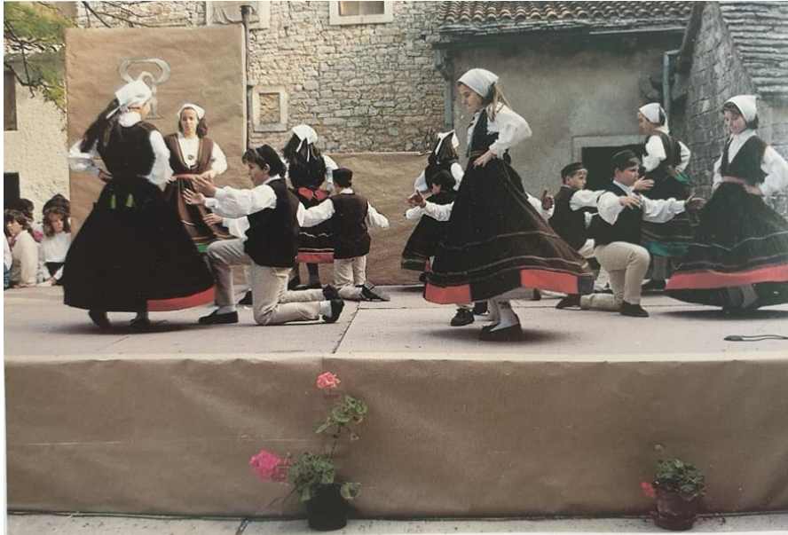
Slika 6. Balun, UKUD „Neven“, Pula

Glazbena pratnja baluna najčešće se izvodi na sopelama ili mihi, nešto rjeđe na šurlama ili cindri, a danas često nailazimo na dijatonsku ili usnu harmoniku. 36