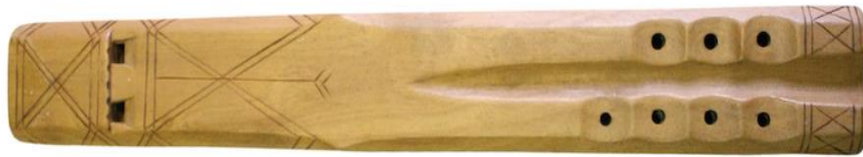
Slika 3. Duplice

oktavu viši ton ili kombinacijom jednog i drugog načina. Zbog slabijeg intenziteta zvuka, ovo se glazbalo rijetko koristilo za plesnu glazbu. 11