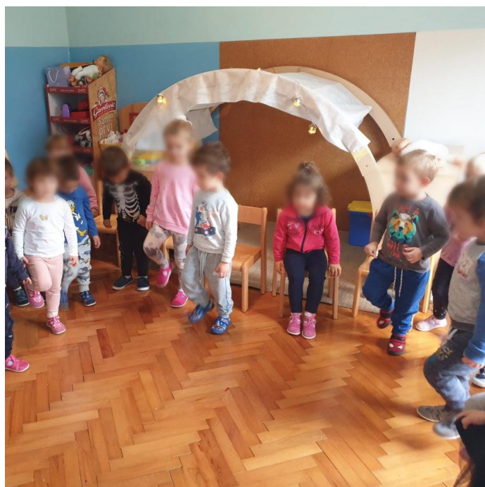
Slika 9. Interpretacija ritma lupkanjem o pod 43

Sadržaj se obrađivao stih po stih. Prvo bi se pročitao prvi stih nakon čega bi ga djeca ponovila. Stihove su ponavljali više puta uz različitu dinamiku i tempo, a zatim se tekstu dodalo pljeskanje i tiho lupkanje nogama o pod zbog dobivanja osjećaja za ritam.