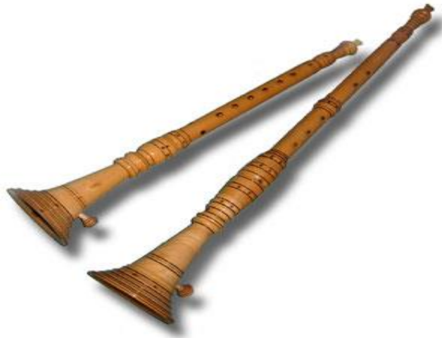
Slika 2. Roženica

i glavni dio roženice na kojoj je izbušeno šest jednako udaljenih rupica. Na donjem djelu glazbala nalazi se ljevkast drveni tulac (lijak) koji je pričvršćen za prebiraljku, a služi za pojačati intenzitet njegova zvuka. Ton se dobiva upuhom zraka kroz pisak, a njegova kvaliteta tona i boja zvuka ovisi o kvaliteti piska. Roženice se najčešće sviraju samostalno, a uz vokalnu pratnju uvijek se koristi samo mala roženica. Najpoznatije svirke u kojima možemo pronaći roženicu su mantinjada, balun, polka i mazurka. 10