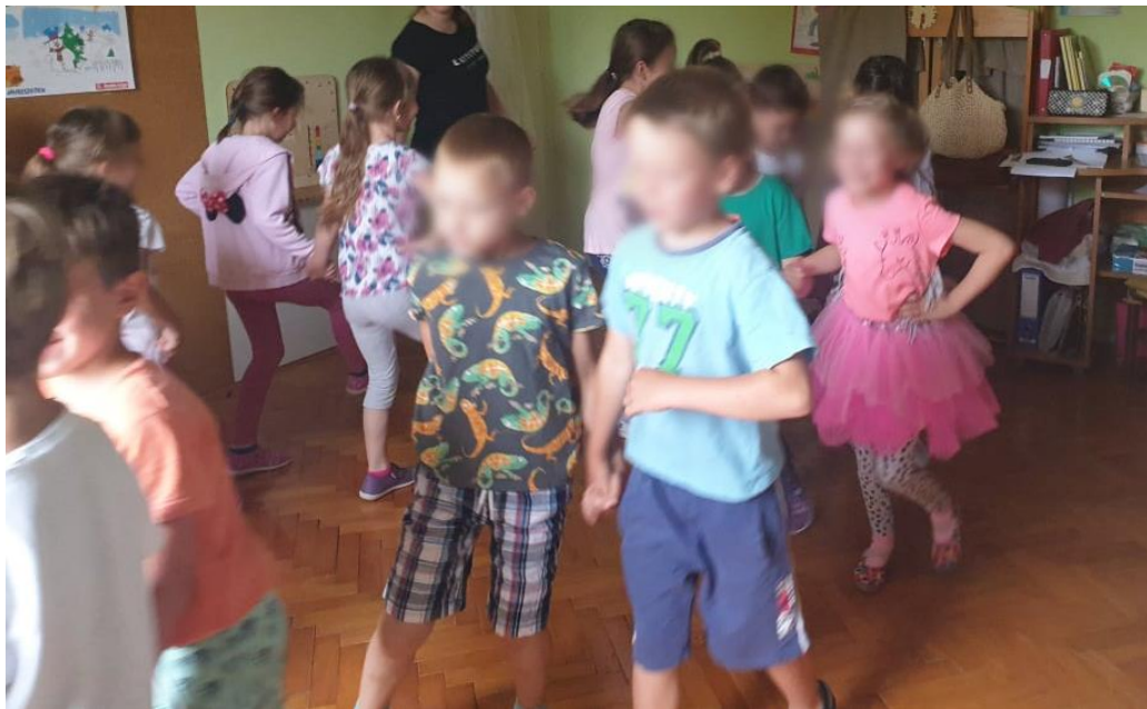
Slika 12. Plesanje plesne figure prebiranje 46

reproduciralo tri puta. Prije prvog slušanja djeca su dobila zadatak obratiti pozornost na tempo i dinamiku, to jest brzinu i glasnoću isječka. Pažljivim slušanjem djeca su zaključila da je balun brz i glasan. Kod drugog slušanja bio im je zadatak obratiti pozornost na izvođački sastav. Na pitanje „Koje ste instrumente čuli u pjesmi?“ dobiveni su različiti odgovori poput harmonike, trube, flaute. Iz ovih odgovora moglo se zaključiti da djeca dobro raspoznaju instrumente jer su znala da glazbalo koje svira u balunu pripada puhaćim instrumentima. Pokazana im je fotografija harmonike koju su tijekom slušanja prepoznali, a zatim fotografiju roženica. Objasnio im se način sviranja roženice te važnost tog instrumenta na istarskom području. Kod zadnjeg slušanja dobili su zadatak da još jednom pažljivo slušaju pjesmu jer će zatim oni pjevati sa slogom „na“. Djeca su odlično interpretirala melodiju i ponovili su je nekoliko puta različitom dinamikom, a zatim su ustala i slobodno se rasporedila po prostoriji. Demonstriralo im se osnovne plesne korake baluna nakon čega je započelo usvajanje tih koraka. Figuru šetnje i prebiranja najprije se vježbalo na mjestu bez glazbe, a zatim s glazbom. Kad su već usvojili prve dvije plesne figure, formirao se krug u parovima. Prije puštanja glazbe demonstriralo im se zadnju figuru vrtnja.