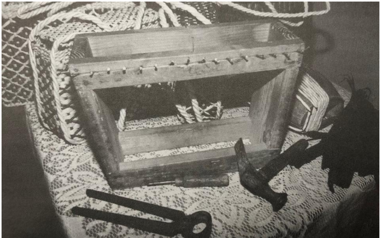
Slika 6. Pribor za pletenje (modla, hakel, kliješta, čekić)

Način na koji su se dekorirali, odlučivali su sami naručitelji ili kreativnost osobe koja je plela. Uz kalupe je za pletenje bilo potrebno koristiti i škare za oblikovanje, kliješta, te hakel- "specifični metalni klin pomoću kojeg su se ispreplitale bobice. Haklom su se pletačice služile u svakoj vrsti oblikovanja i manipuliranja bobicama, tj. pletenja cekera umotanim komušinjem."(Cimerman, 2003:65). Jedan od važnih koraka u samom procesu izrade bilo je i sumporenje, kojim se iz komušinja uklonile štetočine.