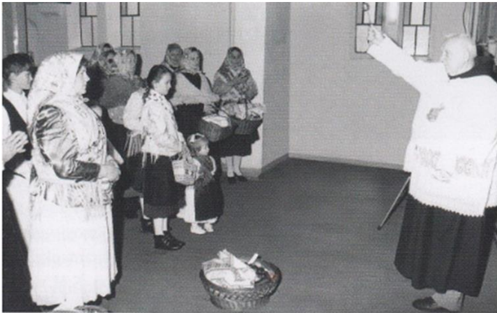
Slika 13. Blagoslov jela