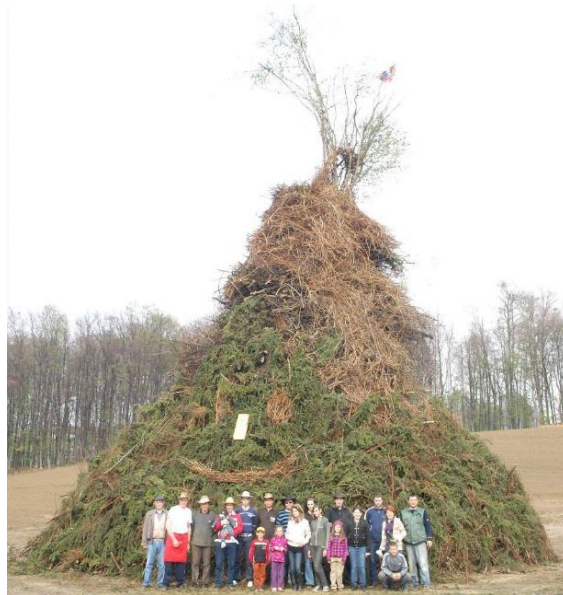
Slika 14. Vuzmenka

“Smisao je vuzmenke višestran. U prakorijenu običaja leži obredna funkcija (kao i kod ivanjskih, jurjevskih i drugih krjesova) da se ognjem otjeraju zle sile od naselja, ljudi i polja. Potom „preko garišta iza vuzmenke tjerala se stoka da bude zdrava i da joj ništa ne nahudi; dalje, osobita moć ugaraka sa garišta, koji se stavljaju na njive ili vrtove pa će tu širiti radost bilja; naposljetku i vjerovanje da sve dotle neće zle sile (vještice, demoni) imati vlasti, dokle dopre svjetlo (ili dim) tih krjesova. Današnji smisao vuzmenki nije ni odredni ni sveti nego u prvom redu društveni. One su tek značajan oblik društvenog okupljanja i nadmetanja : uz njih se veseli u Velikoj noći i potiče se natjecateljski duh.” (Hranjec, 2011:132)