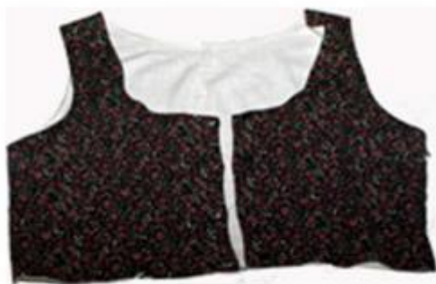
Slika 18. Prsluk

„Na košulju se oblačio prsluk od pustene tkanine s osnovnom crvenom bojom, potom kratka bunda i na kraju dugačak „zobun“ iz grubog sukna, bez rukava i ovratnika. Međimurci su šili u poseban „zobun“ za praznike, ali taj nije bio iz grubog platna, već iz pustene tkanine. Bio je crvene boje i na sebi imao gajtane.“ (Gönczi, 1995:104).