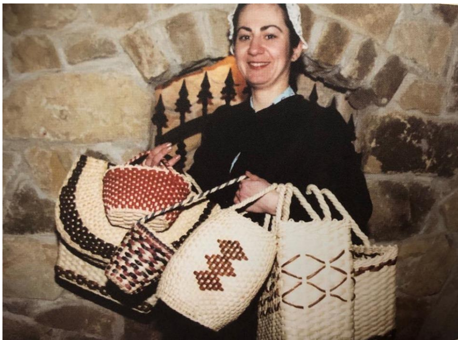
Slika 9. Djevojka sa cekerima spremnim za prodaju