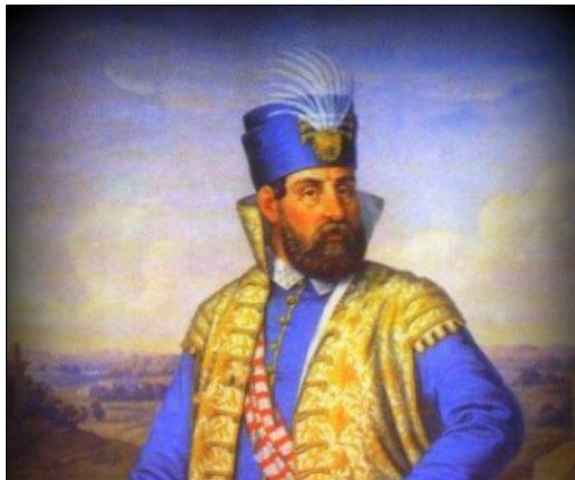
Slika 3. Nikola Zrinski Sigetski

Grad Čakovec je središte Međimurja u kojem se nalazi dvorac obitelj Zrinski. Sam uspon obitelji Zrinski, koja je ujedno bila i najmoćnija hrvatska plemićka obitelj na području Međimurja, započeo je za vrijeme vladavine Nikole Zrinskog Sigetskog koji 1546. godine dobiva Međimurje od kralja Ferdinanda Habsburškog za zasluge u borbi protiv Turaka. Dvorac Zrinski izgrađen je u Čakovcu da bude obrana od turskih napadanja. Još dan danas uz neke male pregradnje, utvrda svjedoči bogatstvu i moći obitelji Zrinskih. Nikola Zrinski Sigetski pogiba 1566. godine kod Sigeta u borbi s Turcima, te ga na prijestolju nasljeđuje njegov sin Juraj Zrinski.