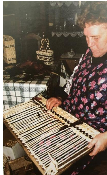
Slika 8. Druga faza pletenja