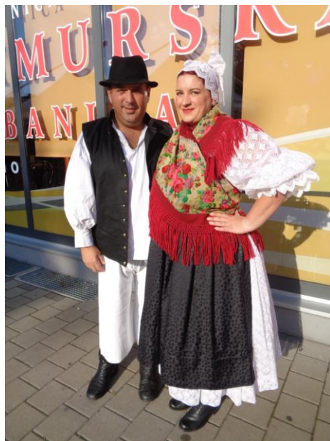
Slika 21. Današnja narodna nošnja

„U Donjem Međimurju svakodnevna odjeća žene sastoji se od jednostavne bijele košulje i kratke suknje, a preko nje veže se plava pregača. Gornji dio odjeće čini crveni ili bijeli prsluk, sprijeda četvero-uglasto izrezan. Na njega dolazi velika marama, bunda ili „bajka“. Suknja je snježno bijela, otraga naborana. Na njoj je crveni pažljivo ušitkan pojas. Košulja je iz finog platna s ispupčenim, naboranim i čipkastim rukavima. Kontrast bijeloj boji čini crni svileni prsluk, krznena „bajka“, mentenica i pregača. Prsluk je vrlo lijep, gotovo svugdje sprijeda prošaran s tri do četiri prsta širokim porubima od gajtana“. (Gönczi, 1995:108)