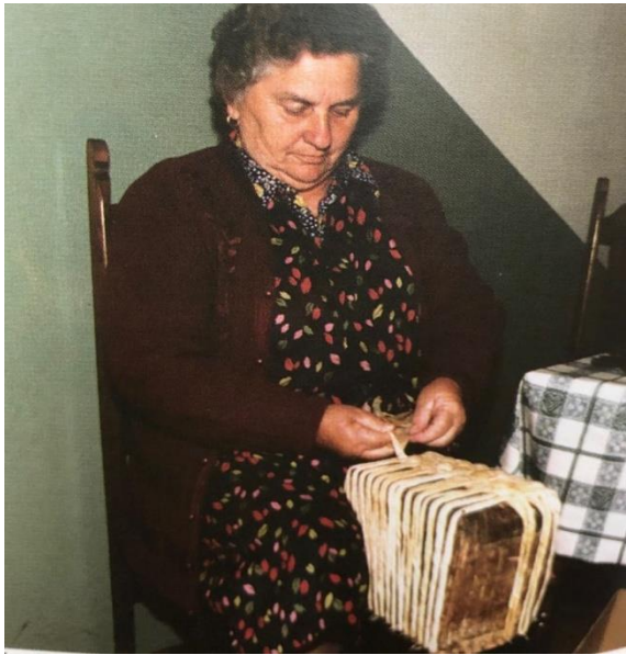
Slika 7. Početak pletenja cekera

Bočna strana cekera, osobito veći dio njezine donje strane ( ovisno o vrsti cekera) plela se ispreplitanjem bobica kroz već postojeće kolce, njihovim horizontalnim ispreplitanjem, uokolo cekera, slijeva na desno. Kod tog su se ispreplitanja pletačice obvezno ( ili najčešće) služile haklom i istovremeno su bobice stalno potiskivale prema dnu cekera da im ceker ne bude – rijetki.