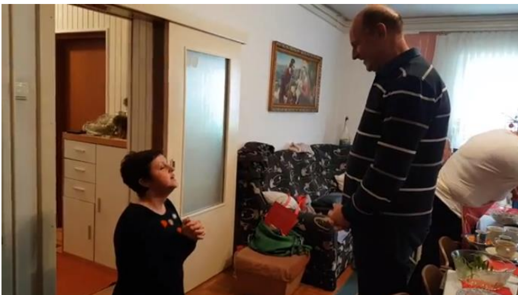
Slika 12. Međimursko „bajanje“ po kućama

Svrha je njihova jasna: donošenjem poljoprivrednih proizvoda i predmeta u kuću željelo se da toga ne ponestane sljedeće godine, tj. da priroda podari što je izloženo: bacanjem graha željelo se što više peradi, da bi se u bajanju i koljanima to direktno izrazilo govorom. Sve je to razumljivo kad se podsjetimo koliko je seljak ovisan o zemlji na kojoj živi.