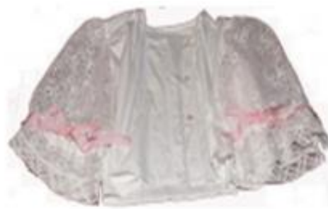
Slika 19. Košulja