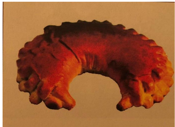
Slika 17. Perec