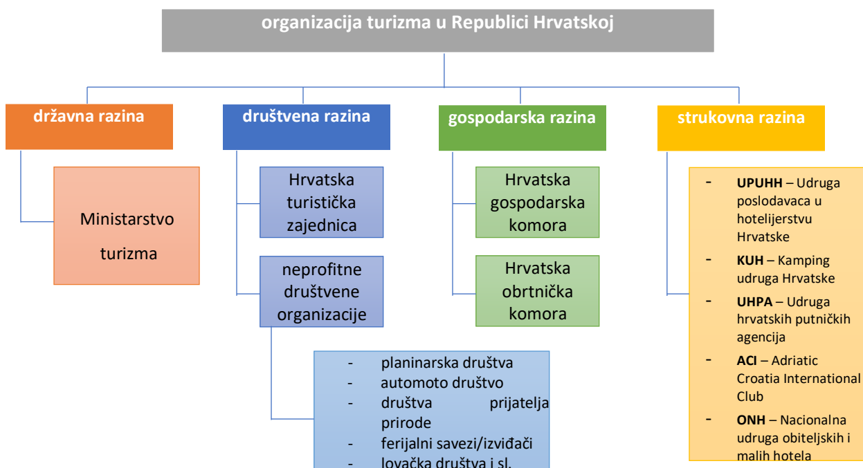
Slika 2. Organizacijska struktura turizma

Izvor: Bartoluci i dr. ... str. 94. prema Hitrec, T. Hendija, Z (2008), Politika, organizacija i pravo u turizmu, Zagrebačka škola za menadžment, Zagreb, str. 78